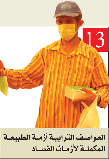
العواصف الترابية أزمة الطبيعة المكلمة لأزمات الفساد