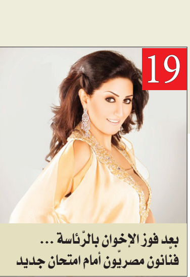
بعد فوز الإخوان بالرئاسة... فنانون مصريون أمام امتحان جديد