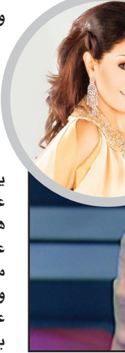
غادة عبد الرزاق

أعضاء جبهة الإبداع، وهو نفس موقف الفنانة غادة عبد الرزاق. بينما الفنانة لوسي قالت لـ "إيلاف" إنها لا تشعر بالخوف على الرقص في عهد الإخوان نظراً لكونهم لن يستطيعوا أن يمنعوها، مشيرة إلى أن ميدان التحريم موجود وستنزل إليه إذ تعرضت حرية الإبداع لأي قيود، مشددة على أنها لن تترك بلدها مهما