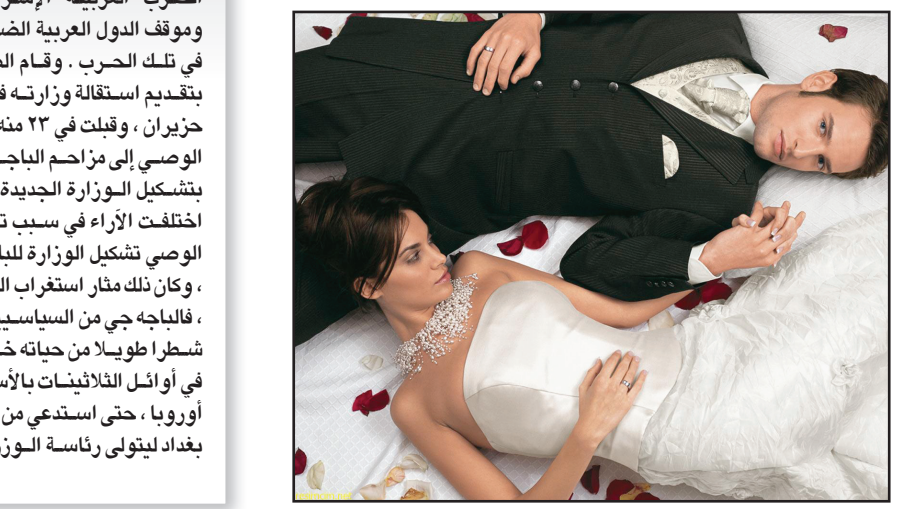
وقال النائب الفرنسي إنه عرف هذه القصة من أحد قضاة المحكمة العليا، الذي أخبره أن التوأمين انفصلا عن بعضهما بعد ولادتهما مباشرة، وتبينتهما عائلتان مختلفتان لم تخبر أي منهما التوأم بالأسماء الحقيقية لأبيهما، ولم يذكر عضو مجلس النواب أي تفاصيل عن هذين التوأمين أو مصير زواجهما.

اكتشف زوجان فرنسيان بعد زواجهما أنهما كانا توأمين انفصلا في طفولتهما وتبينتهما عائلتان مختلفتان. وروى هذه القصة الغربية أحد أعضاء البرلمان الفرنسي في محاولة منه للحصول على دعم لل نقاش الذي يثيره بشأن ضرورة إخبار الأبناء عن أبائهم البيولوجيين.