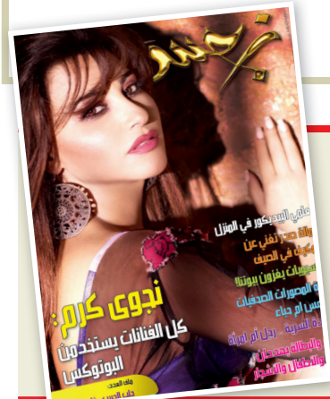
قريباً في العدد الجديد من مجلة

تقول كاتبة التقرير شيري ريتشاردي- احدى كبار الكتاب المساهمين في -مراجعة الصحافة الاميركية - والخاصة في القضايا الدولية " الواقع على الارض اليوم بعيد كل البعد عما تصوره مخطوط البنيتاغون عن المنظومة الصحفية المعاد تشكيلها في العراق، و صار العديد من وسائل الاعلام العراقية ابواقا للفصائل العرقية-السياسية، و يمكن ان تشعل لهيب الطائفية التي تاندت البلاد الى حافة حرب أهلية ."