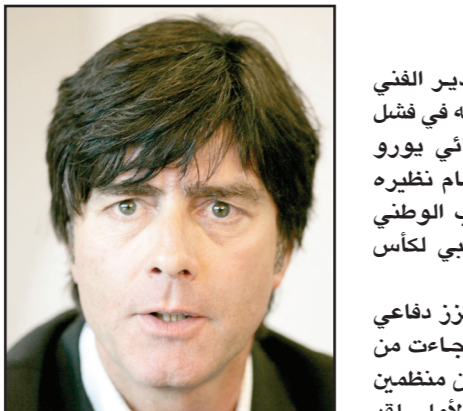
لوف يشغل من مزاجية إيطاليا