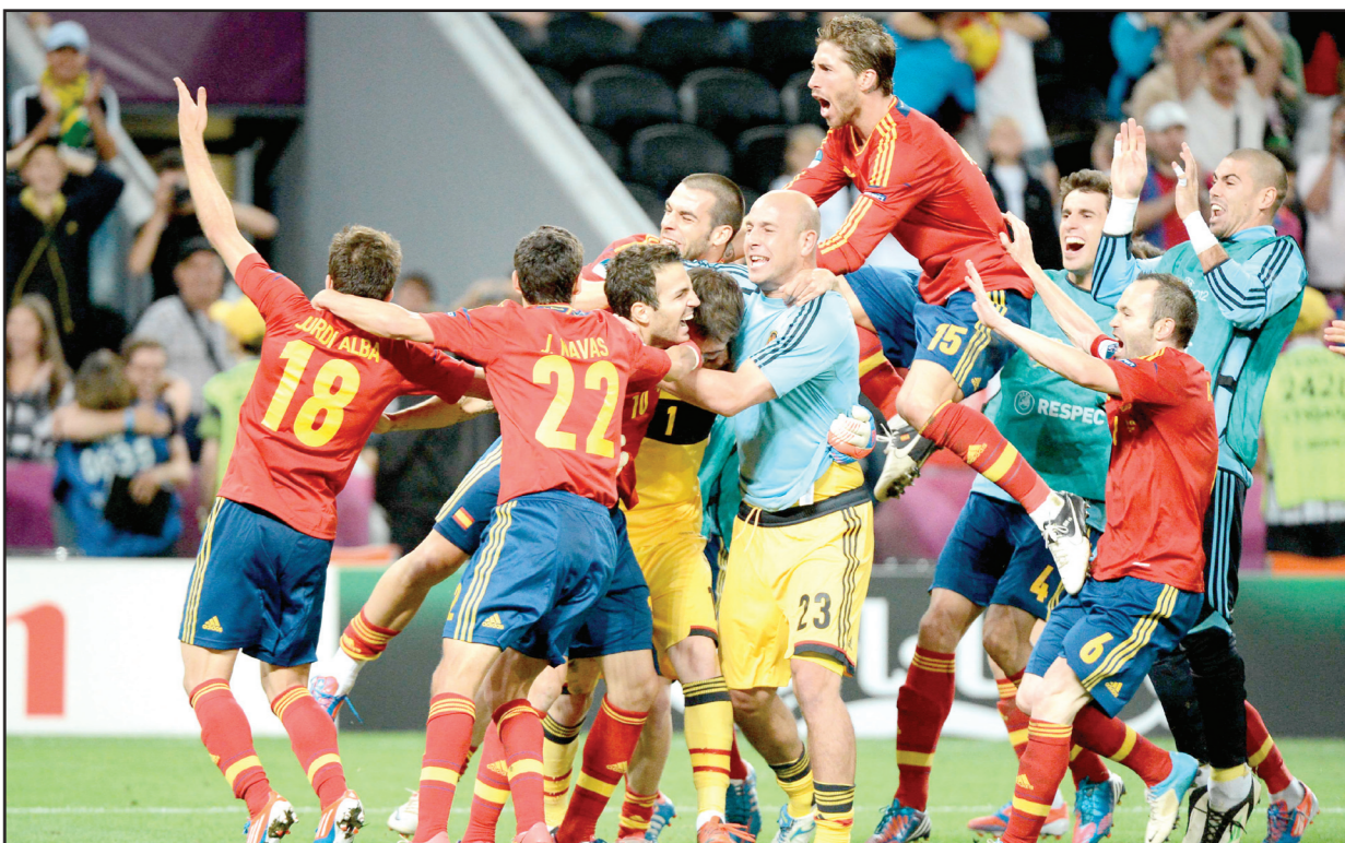
الاسبان يتيمجون ببلوغ النهائي

بات المنتخب الإسباني (الماتادور) على بُعد خطوة واحدة من أن يصبح أول فريق يتوّج باللقب الأوروبي للمرة الثانية على