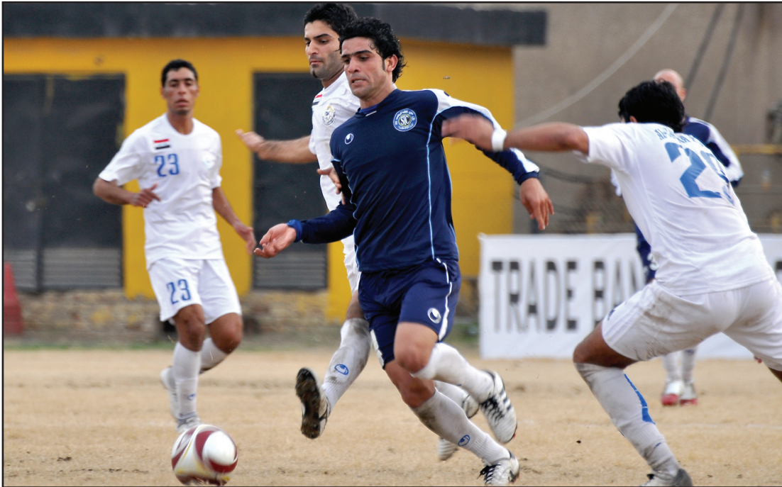
الطلبة يواجه المثار الصناعية لتعويض الجولة الماضية

الشرطة يقف في المركز الرابع برصيد ٥٣ نقطة ويمتلك منافسه ١٠ نقاط في المركزالاخير على لأحة الترتيب.