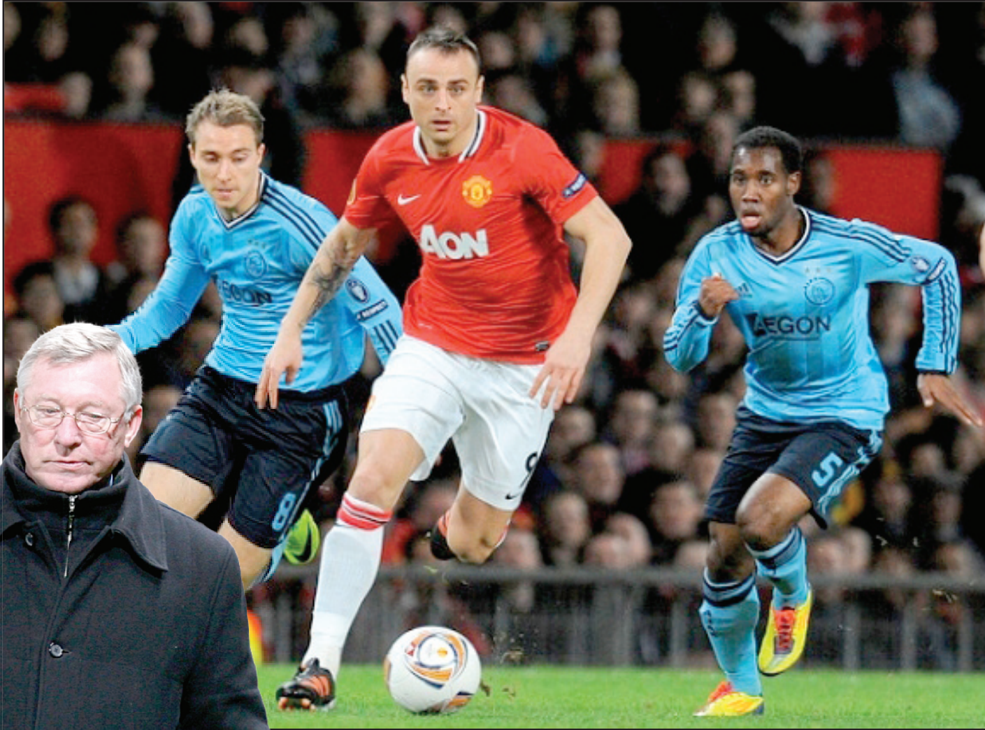
فيرغسون يفتح باب المان على مصراعيه لضم النجم الجدد

وأضاف فيرغسون عن الدوري البلغاري: لم يكن الموسم الماضي