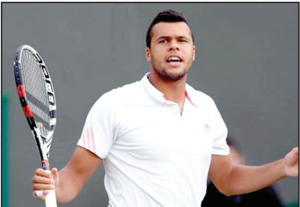
جو ويلفريد تسونغا

المصنف رابعاً الدور ذاته بسهولة بفوزه على الكرواتي مارين سيليتش السادس عشر 6-5 و 6-6 و 7-3.