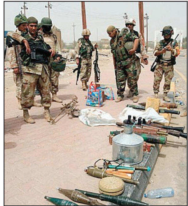
العثور على أكداش من العتاد .. (أرشيف)