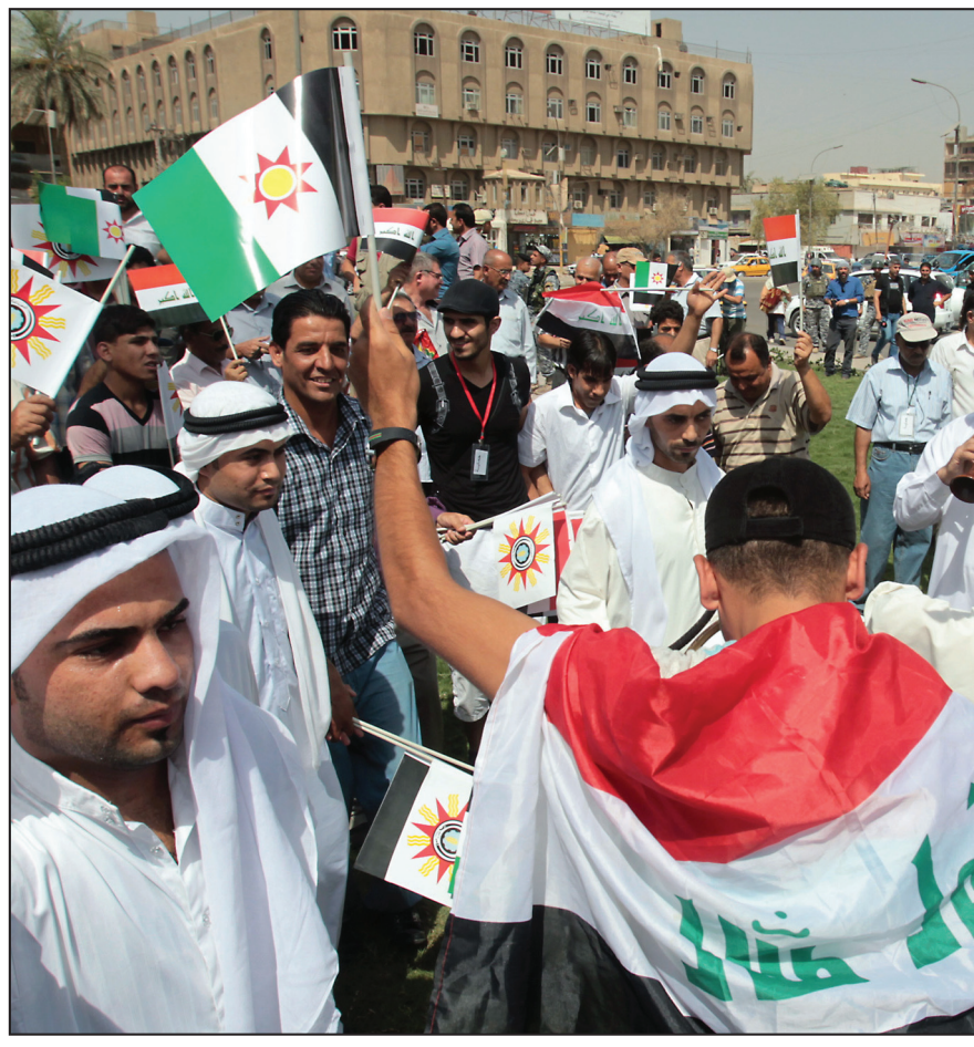
مسيرة في بغداد لاجلاء ذكرى ثورة ١٩٥٨.

المناطق كافة صحواً مع غبار في أماكن متعددة من المنطقتين الوسطى والجنوبية وظهور بعض القطع من الغيوم المنفرقة في المنطقة الجنوبية". وأضاف البيان "فيما سيستمر تأثير المنخفض الجوي الحراري الموسمي ليوم الاثنين المقبل ليكون الطقس في المناطق كافة صحواً مع غبار في أماكن متعددة من المنطقتين الوسطى