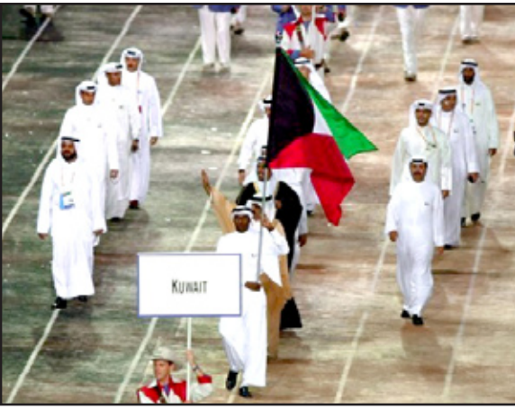
إفراج ازمة الوفد الاولمبي الكويتي

كشف مصدر في اللجنة الأولمبية الدولية لوكالة الأنباء الفرنسية ان اللجنة رفعت الإيقاف عن الرياضيين الكويتيين بعد تلقيها رسالة من أمير الكويت صباح الاحمد الصباح في هذا الشأن. وقال المصدر ان مندوب أمير الكويت، وزير الشؤون الاجتماعية والعمل سالم الأدينة، قابل رئيس اللجنة الأولمبية الدولية جاك روج البوم في مقر اللجنة الأولمبية الدولية في لوزان وسلمه رسالة خطية من الأمير بشأن رفع الإيقاف عن الرياضيين الكويتيين. وتابع اجتمع المكتب التنفيذي للجنة الأولمبية الدولية ودرس