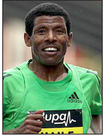
العداء هابلي جبريسيلاسي

يتقدم العداء الأنثوي هابلي جبريسيلاسي وحامل ذهبية العشاربية الأميركية براين كلاي لائحة الرياضيين الذين سيغيبون عن دورة الألعاب الأولمبية الصيفية التي ستطلق في لندن نهاية الشهر الحالي. جبريسيلاسي البطل الأولمبي مرتين وبطل العالم اربع مرات في سباق ١٠ آلاف متر، عجز عن التأهل من التصنيفات الانثوية التي أقيمت في هونغكو في ايار الماضي. وما زاد الطين بلة، ان جبريسيلاسي (٣٩ عاماً) فشل سابقاً بالتأهل الى