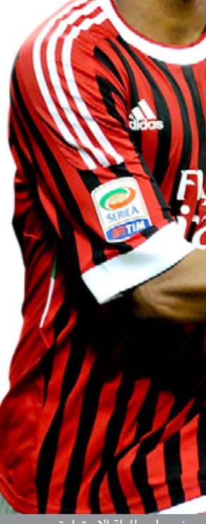
روبينيو على طرارة الاستعارة

يحصل بها على خدمات روبينيو مقابل الاستغناء عن حارس المرمى البرازيلي الشاب رافاييل كابرال إلى ميلان. واختار مانو مينيزيس المدير الفني للمنتخب البرازيلي لكرة القدم الحارس كابرال ضمن قائمة المنتخب الذي سيشارك في أولمبياد لندن ٢٠١٢.