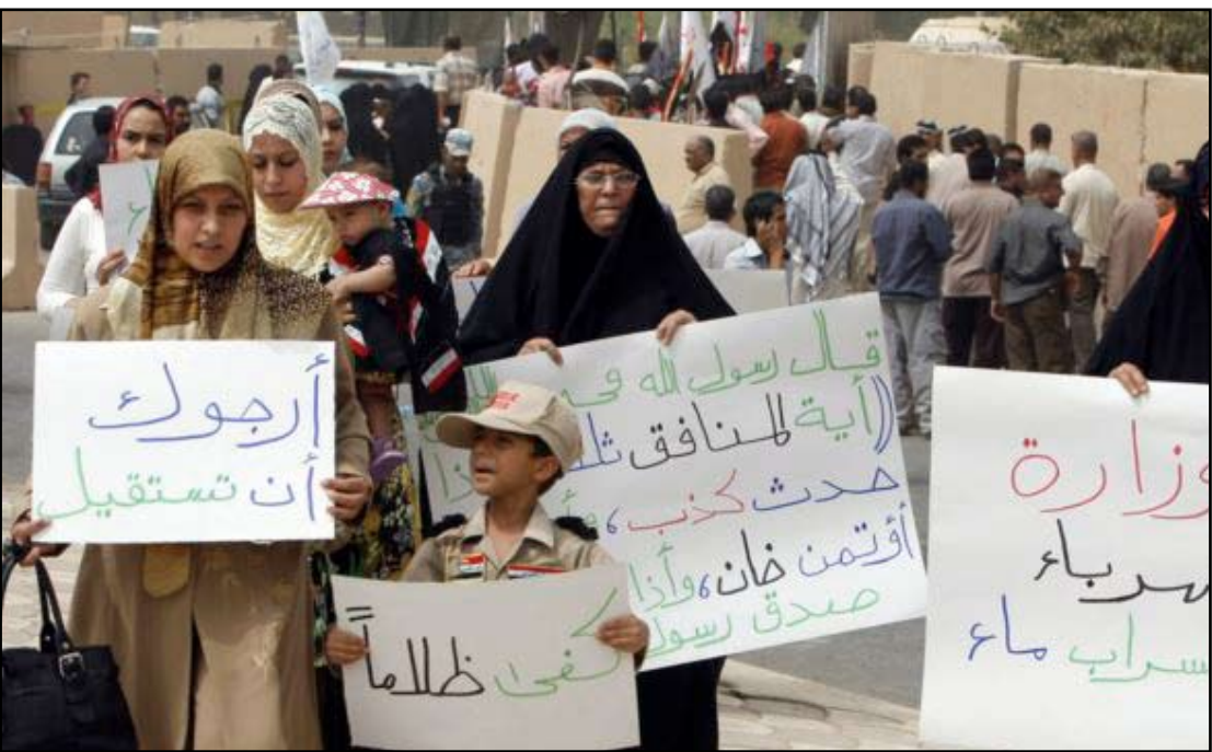
تظاهرات نسوية ضد غياب الخدمات

كثير من الأحيان تضطر إلى تأخير تقديم وجبة الطعام لأسرتها بسبب انقطاع الكهرباء لاسيما في الوجدات التي تتطلب استخدام الفرن الكهربائي والخلاط وأجهزة التبريد. وتابعت بالقول: إن انقطاع الكهرباء جعل من المرأة في سياق دائم مع الوقت لانجاز