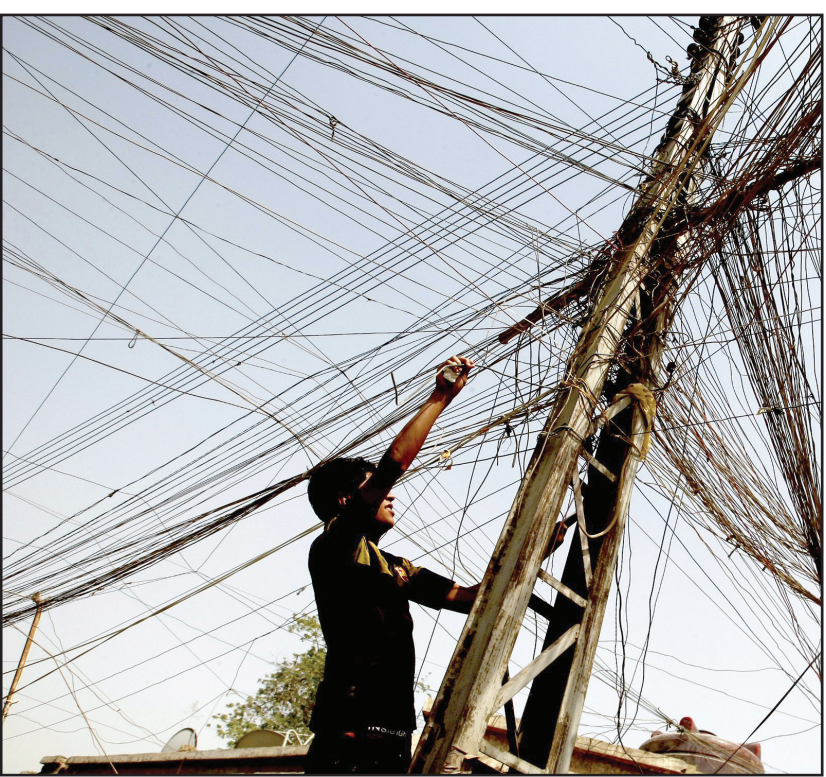
مع انقطاع التيار الكهربائي المستمر.. المولدات الأهلية الحل الوحيد للمواطن..