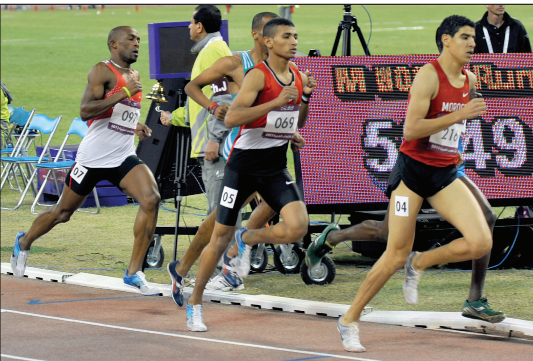
الرياضة العراقية بحاجة الى الاستراتيجية والمال

وحتى عندما استبشرنا خيرا بخطوة بناء المدينة الرياضية في البصرة وإنشاء بعض الملاعب في المحافظات فان أسلوب اختيار الشركات والمخططات وبعض التفاصيل الفنية والمدة الزمنية لإنشائها قد شابها الكثير من اللغظ والتشكيك حينما تضاربت الأحاديث واختلف الكثير من التفاصيل المهمة وخاصة بشأن حجم التكلفة مقارنة