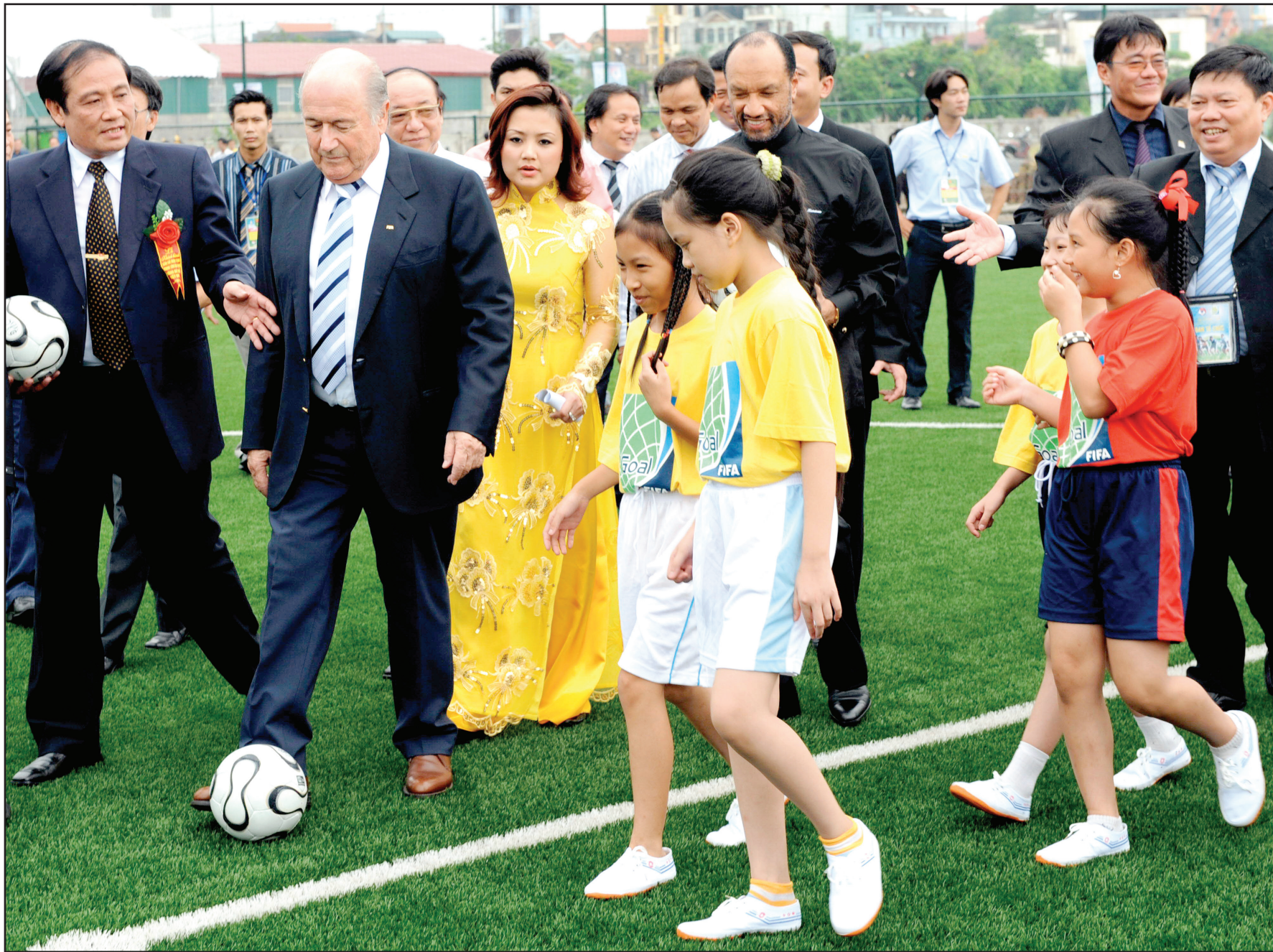
بلاتر وابن همام في افتتاح احد مشاريع الهدف

وتابع ابن همام: الوقت ليس للثأر، بل للتسامح، مشيراً إلى أنه في حاجة إلى استشارة فريقه القانوني قبل الإقدام على الخطوات التالية التي سيقوم بها. وكانت المحكمة قد رفعت عقوبة الإيقاف مدى الحياة عن ابن همام وهو قرار غير قابل للاستئناف من قبل أية جهة. وضمنت المحكمة ثلاثة قضايا هم: الإسباني خوسيه مارييا ألونسو