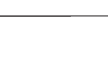
النجم السلوي كوبي براينت