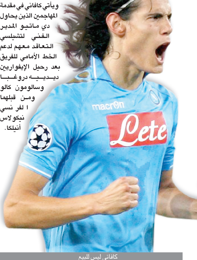
كافاني ليس للبيع

يحاول أوريلو دي لورنتي رئيس نادي نابولي الإيطالي صرف نظر تشيلسي الإنكليزي عن التعاقد مع الأوروغوياني أدنيسون كافاني هداف نابولي بالمبالغ في المقابل المادي المطلوب لإتمام الصفقة. ورفع دي لورنتي، سعر مهاجمه الهدف إلى ١٠٠ مليون يورو (٧٨ مليون جنيه إسترليني) وفقاً لما ذكرته سكاي سبورتنس إيطاليا. وقال لورنتي الأحد الماضي: كافاني ليس للبيع، ولكننا لن نمانع في رحيله إذا حصلنا على ١٠٠ مليون يورو. وأضاف: هذا المقابل لا يوازي قيمة اللاعب، لكننا بصفة مبدئية سنوافق على مناقشة أي عرض يصل إلى هذا المبلغ، ولن نلتفت إلى عروض أخرى. وكانت تقارير إنكليزية قد أكدت تجدد مفاوضات تشيلسي مع وكيل كافاني، وأن اللاعب أبدى ترحيباً بالانضمام للبلوز بشرط الحصول على ١٥٠ ألف جنيه إسترليني أسبوعياً ليتساوى بفيرناندو توريس، أصحاب الأجر الأعلى في الفريق اللندني. وأشارت التقارير إلى أن بطل أوروبا في طريقه للتقدم بعرض قيمته ٣٥ مليون جنيه إسترليني (٤٢ مليون يورو) لضم المهاجم الأوروغوياني، وأن هذا المبلغ قابل للزيادة.