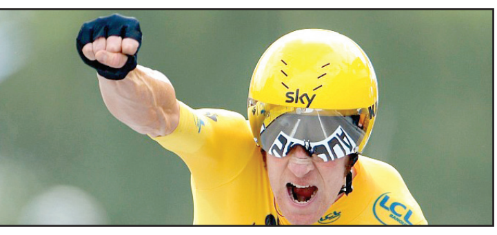
الدراج ويغينز يدخل التاريخ بفوزه بسباق فرنسا

بروك، و ١١،٠٠٤ ث عن الأميركي تيجاي فان غارن. وخلف ويغينز الأسترالي كادل إيفانز الذي اكتفى في نسخة هذا العام باحتلال المركز السابع بعد أن أصبح في ٢٠١١ أول أسترالي يتوج بلقب بطل هذه الدورة. وكان إيفانز الذي أصبح عام ٢٠٠٩ أول أسترالي أيضاً يتوج بطلا للعالم، انتزع القميص الأصفر من اللوكسمبورغي أندري شليك قبل مرحلة على احتتام السباق، وهو توج بلقب نسخة ٢٠١١ برغم تحقيقه المركز الأول في مرحلة واحدة فقط.