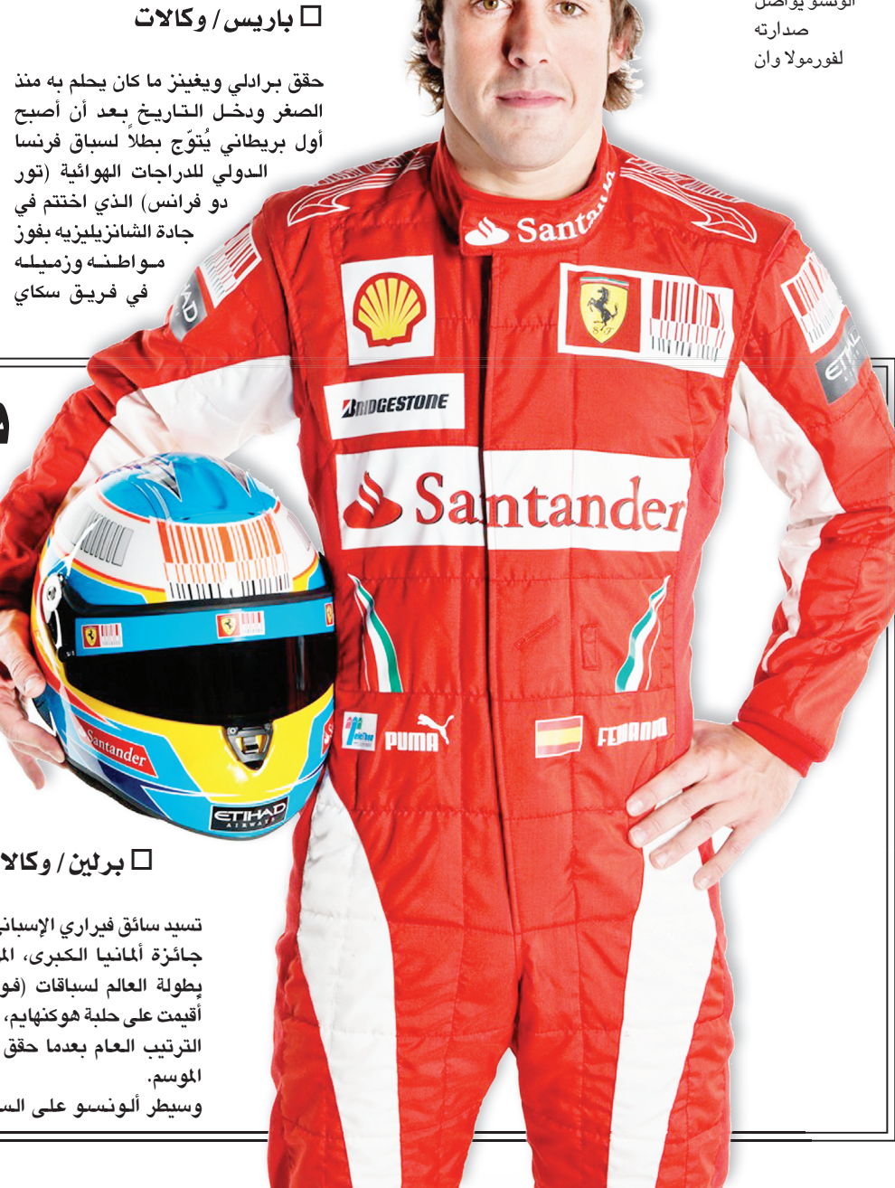
الونسو يواصل صدارته فورمولا وان

بروساكيلينغ مارك كافنديش، بطل العالم، بالمرحلة العشرين الأخيرة التي انطلقت من رامبويه وامتدت لمسافة ١٢٠ كيلومترا. وأنتهى ويغينز (٣٢ عاماً) الذي فاز بمرحلتين فقط هما التاسعة والتاسعة عشرة (كلاهما ضد الساعة)، السباق الفرنسي الشهير في الصدارة بفارق ٢،٢١ ث عن مواطنه كريستوفر فروم، و ٦،١٩ ث عن الإيطالي فينشنزو نيبالي، و ١٠،١٥ ث عن البلجيكي يورغن فان در