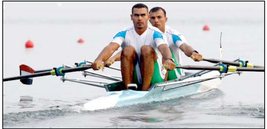
التجذيف يعسكر في دوكان