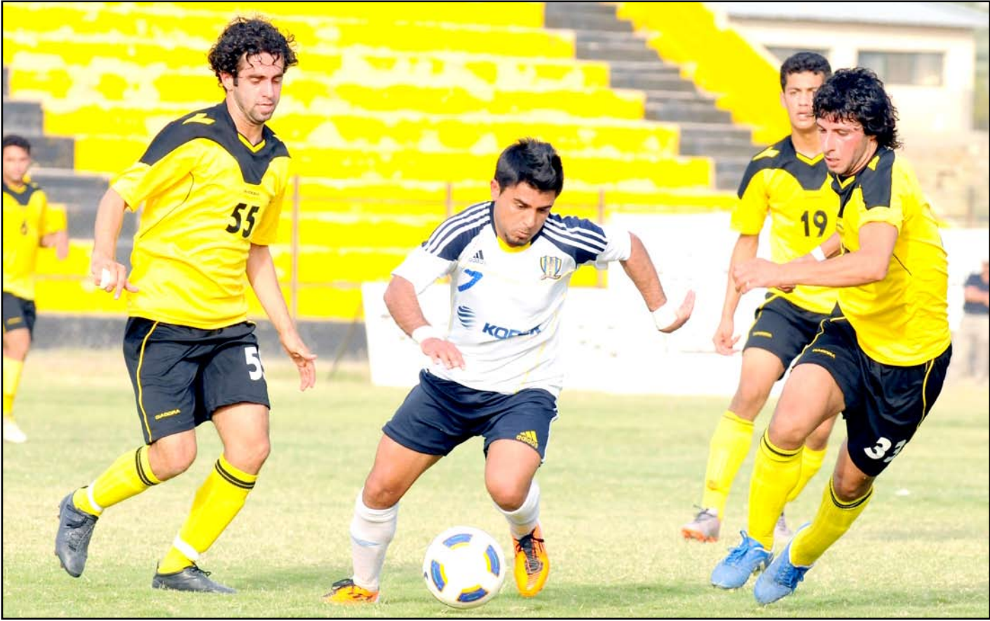
دوري النخبة يدخل مراحله الأخيرة