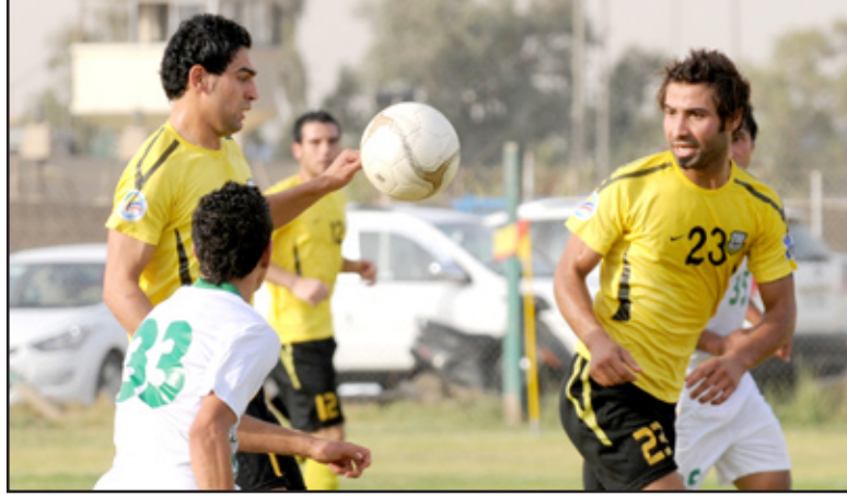
أربيل يضمن اللقب قبل اختتام الدوري

في الشوط الثاني استمر الحال على ما عليه برغم الرغبة القوية من قبل فريق أربيل لحسم النتيجة لكن النتيجة النهائية اشارت الى