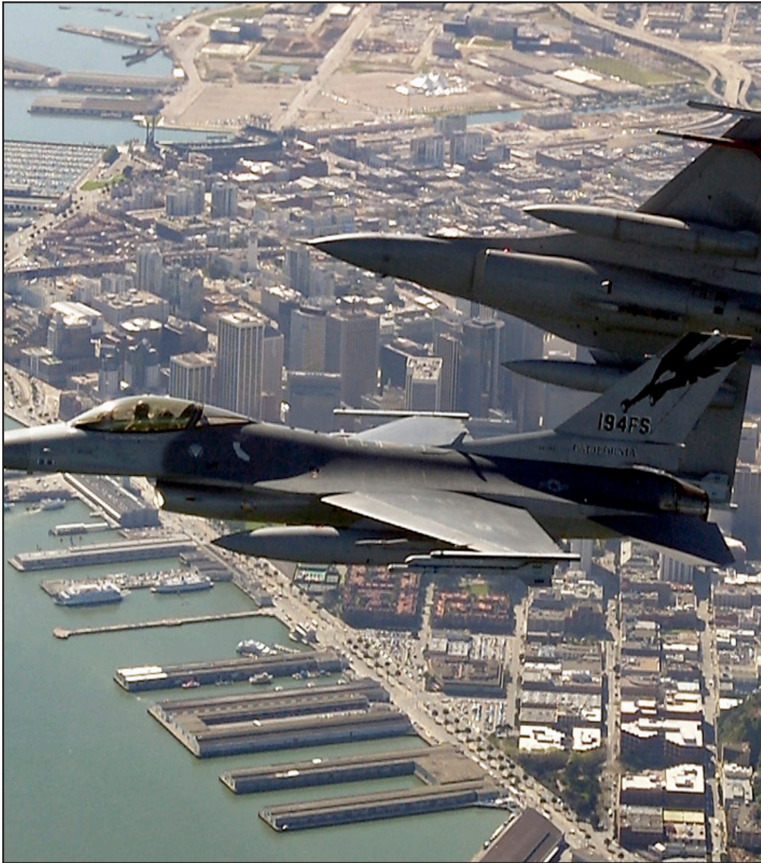
الطائرات المقاتلة F-١٦..

ويضمن البرنامج التدريب على جميع مكونات طائرات تي-٦ أي تيكسن و إي-٣٨ تالون بالإضافة إلى مقرر دراسي يسمى "مقدمة في أساسيات المقاتلة". وسيتم استكمال تدريب الطيران بتدريب متخصص باللغة الإنكليزية على الملاحه الجوية. يستمر التدريب لفترة تصل إلى ١٢ شهر لكل طيار وفقاً لمستوى خبرة الطيار.