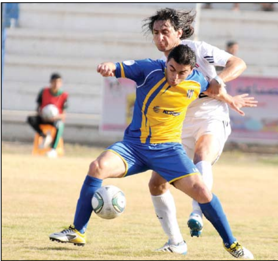
تنافس شرس بين الجوية ودهوك للظفر بوصافة النخبة

ويقف الكرخ في المركز الثامن عشر برصيد ٣١ نقطة ولكرلاء ٤١ نقطة في المركز الخامس عشر، ويلتقي في اليوم ذاته الجوية مع التاجي والنجم مع المصافي .