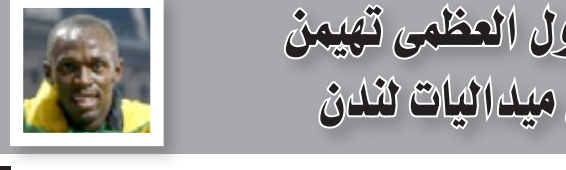
الدول العظمى تهيمن على ميداليات لندن