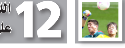
المكسيك تدخل التاريخ بلذهبية كرة القدم