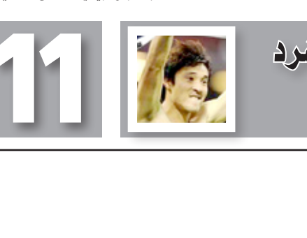
لاعبو البارالمبية يواصلون تحضيراتهم لدورة لندن