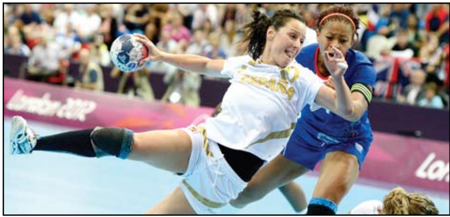
اليد النسوي عنوان الاتارة في اولمبياد لندن

هذه الانجازات الاستثنائية لرياضيي بريطانيا دفعت كامبرون لزيادة الرياضة التنافسية في المدارس الابتدائية، إذ أن بيانات حكومية أظهرت أن مدرستين فقط من كل خمس مدارس ابتدائية تعتمد الرياضة