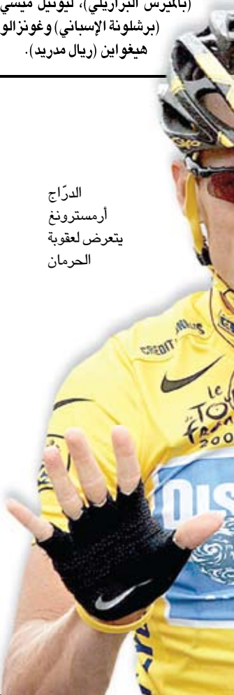
الدرّاج آرسترونغ يتعرض لعقوبة الحرمان

منتخب الجوارح يوم ٧ أيلول المقبل وتلعب مع البريرو يوم ١٠ من الشهر نفسه. وضمت لأثمة