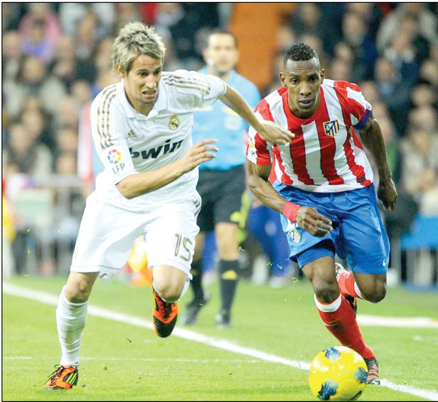
ريال مدريد يستهل مشواره بلقاء خيتافي

قائلاً : لست مندفعاً بشكوى مورينو من التحكيم، فهو يقوم بذلك دائماً، وأصبح الأمر معتاداً. وعن مباراة إياب كأس السوبر الإسباني، التي انتهت بمباراة الذهاب بفوز البرسا ٣-٢ قال اللاعب : أعتقد أن الأمور ستتحسن بمرور الوقت، وعلينا التركيز واللعب بقوة أكثر من ذلك، وعلينا اجتياز مشكلة الركلات الركنية، ولكننا في الأساس بسبب أطوال اللاعبين.