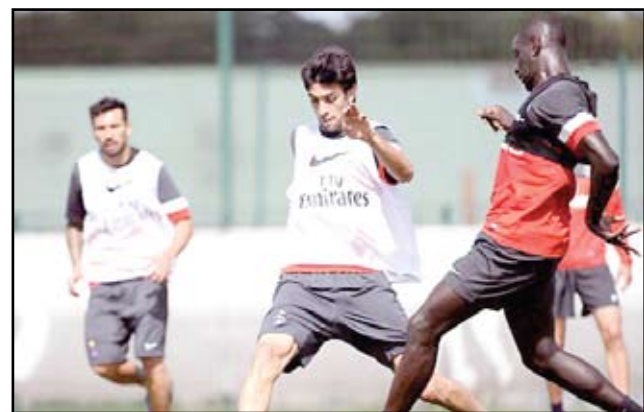
سان جيرمان يطمح لاستعادة توازنه ميكرو

نقاط على حساب ضيفه الذي حقق انتصارين حتى الآن على كل من ايفيان (٣-٢) وريين (١-٠).