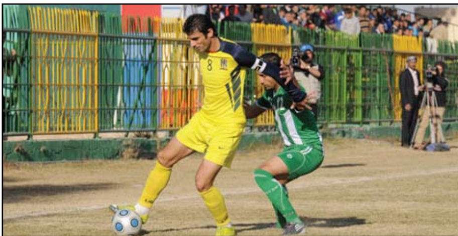
دهوك يتمسك بنجوم الموسم الماضي