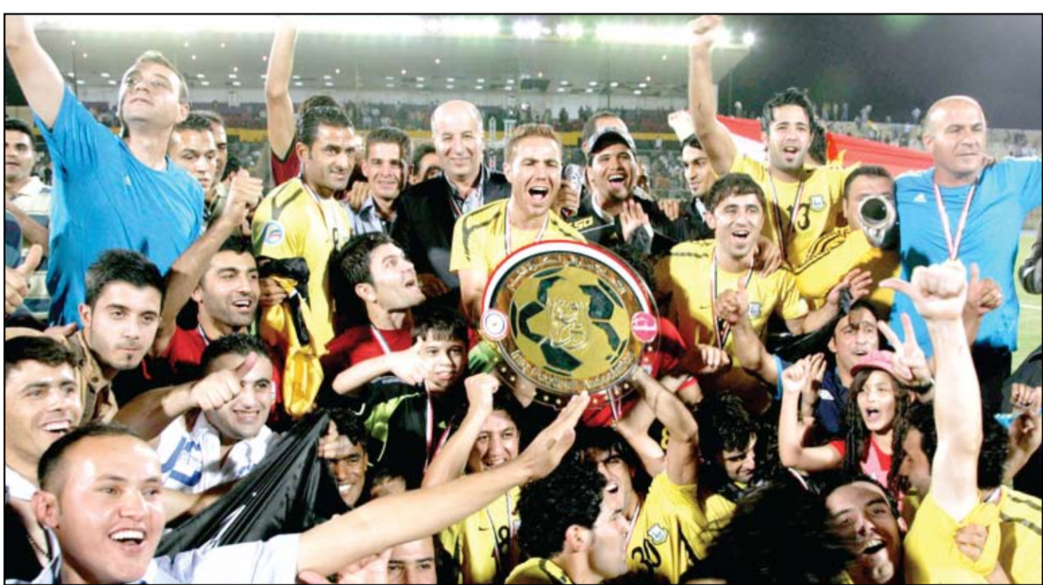
لحظة احتفال فريق أربيل باللقب الرابع

خطوات التي اتخذها والمبالغ التي خصصها للفريق اتت بنتامها من خلال خطف اللقب الحقيقي للدوري ، وسيكون وضع الفريق أكثر استقراراً في الموسم الجديد خاصة وان الإدارة قررت ان تجدد لأغلب اللاعبين المتميزين في الفريق وكذلك التعاقد مع لاعبين محترفين.