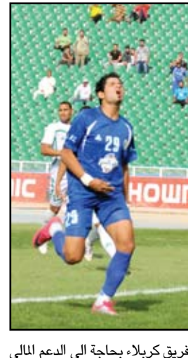
فريق كربلاء بحاجة الى الدعم المالي

وإيجاد الحلول لها وزيادة المخصصات لها وتخصيص مبالغ لبناء المقر... وأكد إن كربلاء