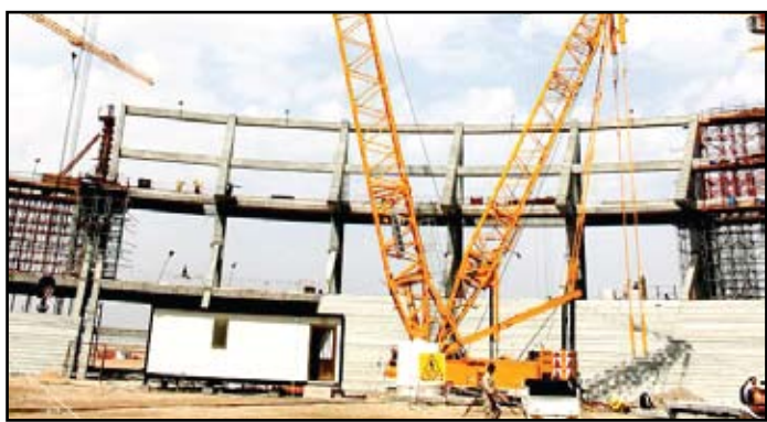
جانب من أحد مشاريع الإعمار