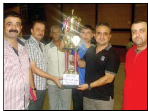
رئيس فريق الاعتماد يرفع الكأس