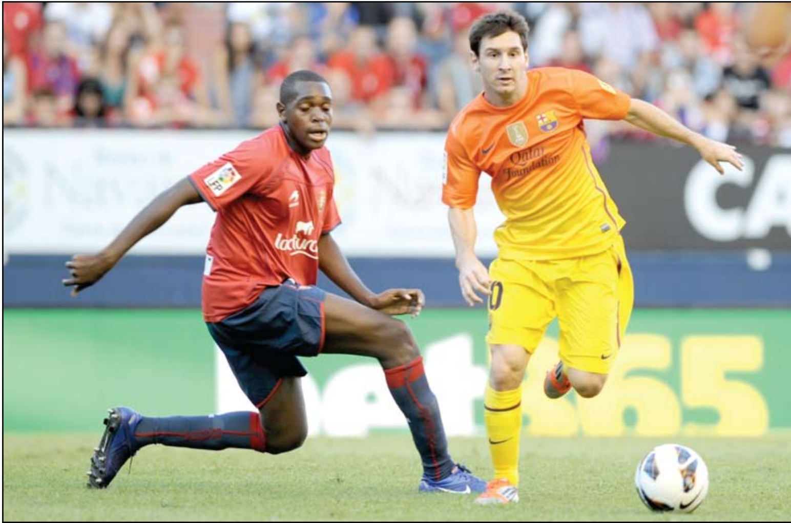
ميسي يرفع رصيده إلى أربعة أهداف في الليغا

ووسط غلظة من دفاع برشلونة نجح المهاجم المخضرم العمار من ريال سوسيسيداد خوسيبا يورنتي في تسجيل الهدف الأول لأوساسونا في الدقيقة ١٧، إثر كرة عرضية لعبها البلجيكي رولان لاماه من الجهة اليسرى إلى داخل منطقة جزاء برشلونة، عاجلها يورنتي بيميناه مباشرة على الطائر في الزاوية الضيقة العليا على يسار الحارس فيكتور فالدين. حاول لاعبو برشلونة الضغط على منافسيهم جهومياً لإبراك التعادل وشهدت الدقيقة ٢٦ الإنذار الأول في المباراة وكان من نصيب ميسي غونزاليز لاعب وسط أوساسونا نتيجة لمسه يد، وتلقى أليخاندرو أربياس مدافع أوساسونا إنذاراً ليوئل عرقلة الخشنة للأرجنتيني ليونيل ميسي نجم برشلونة. توالى ظهور البطاقات الصفراء فال سيرخيو بوسكيتس لاعب وسط برشلونة إنذاراً بدوره في الدقيقة ٣٥ وتواصل الضغط الهجومي من لاعبي الفريق الكاتالوني وسط استماتة من مدافعي أوساسونا وخلفهم الحارس أندريس فرنانديز للحفاظ على نظافة شباهم لينتهي الشوط الأول بتقدم أصحاب الأرض بهدف نظيف. بدأ الشوط الثاني بضغط هجومي من برشلونة لإبراك التعادل، استمرت الفرص الضائعة من