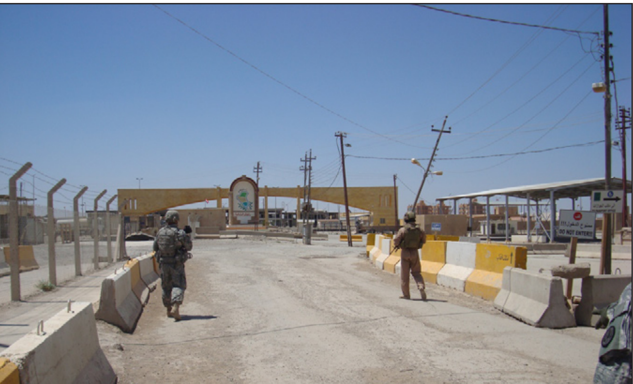
الحدود السورية العراقية ( ارشفيف)

الخليج العربية وبعض الدول الأخرى كممثل شرعي للعراق ولكن الولايات المتحدة احتفظت بصلاحيات واسعة في العراق وكانت هي صاحبة القرار أثناء فترة الحكومة المؤقتة.