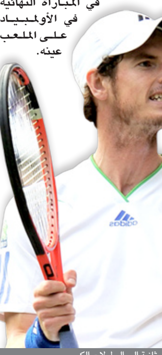
موراي يتأهل ثانية إلى البطولات الكبرى

لاعب يصل إلى المباراة النهائية في فلاشينغ ميدوز بعد فوزه بالذهبية الأولمبية. وهي المرة الثانية على التوالي التي يبلغ فيها موراي المباراة النهائية في البطولات الكبرى بعد أن سقط أمام فيدرر في توماس برديتش السادس ٥-٧ و ٦-٦ و ٦-٧ و ٩-٧). وبات موراي بفوزه على برديتش الذي أخرج السويسري روجيه فيدرر المصنف أولاً من ربع النهائي، أول