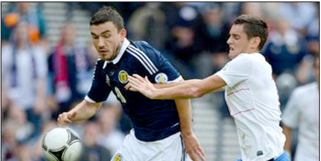
اسكتلندا تخرج بنقطة من لقاء صربيا

أفتتحت بفوز كرواتيا على مقدونيا (٠-١)، وبلجيكا على ويلز (٢-٠). وتقام الجولة الثانية غداً الثلاثاء حيث تلعب اسكتلندا، الساعية إلى بلوغ النهائيات للمرة الأولى منذ عام ١٩٩٨، مع مقدونيا على أرضها في لقاء بلجيكا مع كرواتيا، وصربيا مع ضيفتها ويلز. كما تعادل منتخب الدنمارك مع نظيره التشيكي أيضاً بلا أهداف، على ملعب باركن شتاديون في كوبنهاغن لحساب المجموعة الثانية، التي أفتتحت منافساتها ، بتعادل بلغاريا مع إيطاليا (٢-٢) وخسارة مالطا أمام أرمينيا (٠-١).