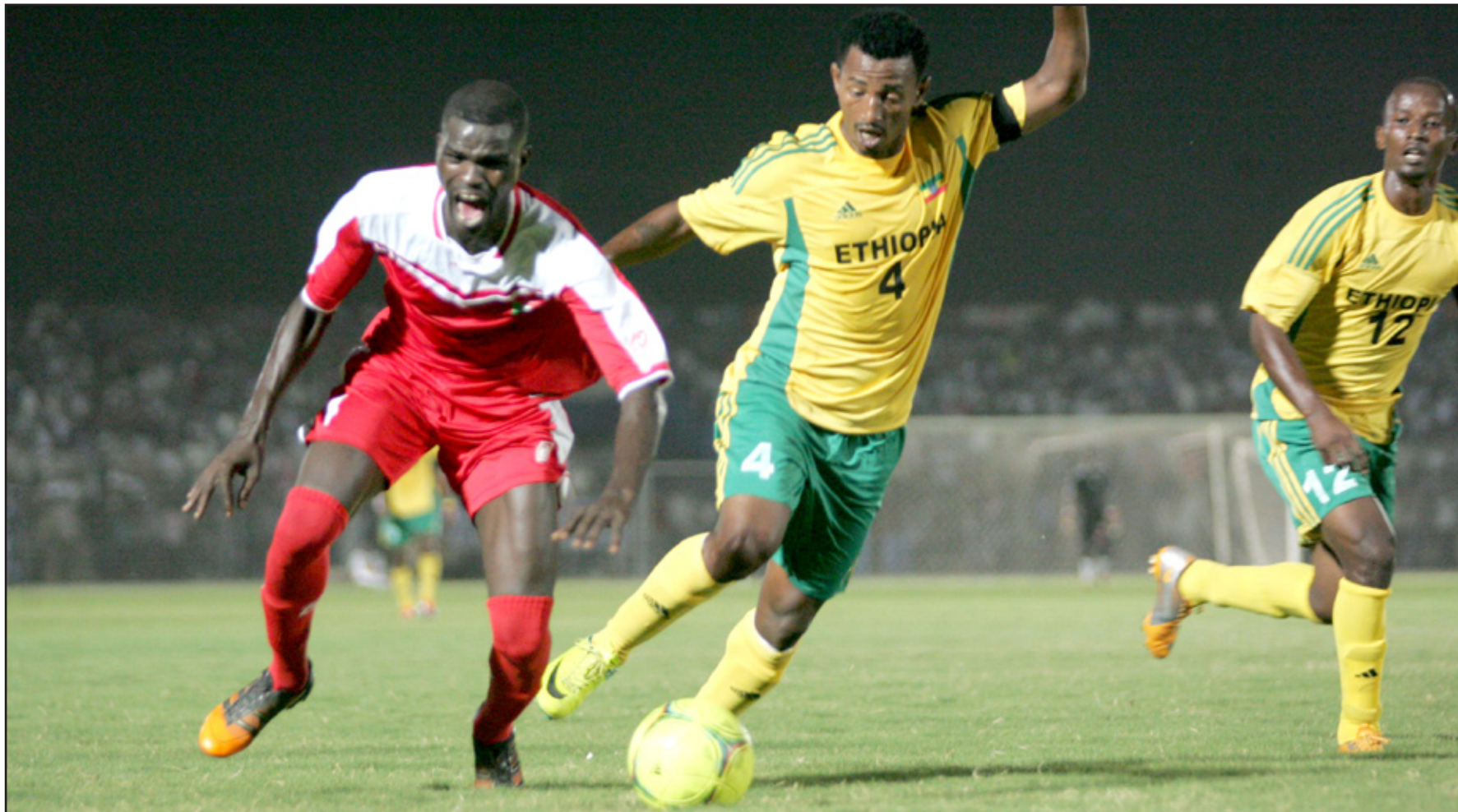
السودان يقهر أثيوبيا في أم درمان

فازت جمهورية أفريقيا الوسطى التي كانت قد أطاحت في الدور السابق بالمنتخب المصري حامل الرقم القياسي