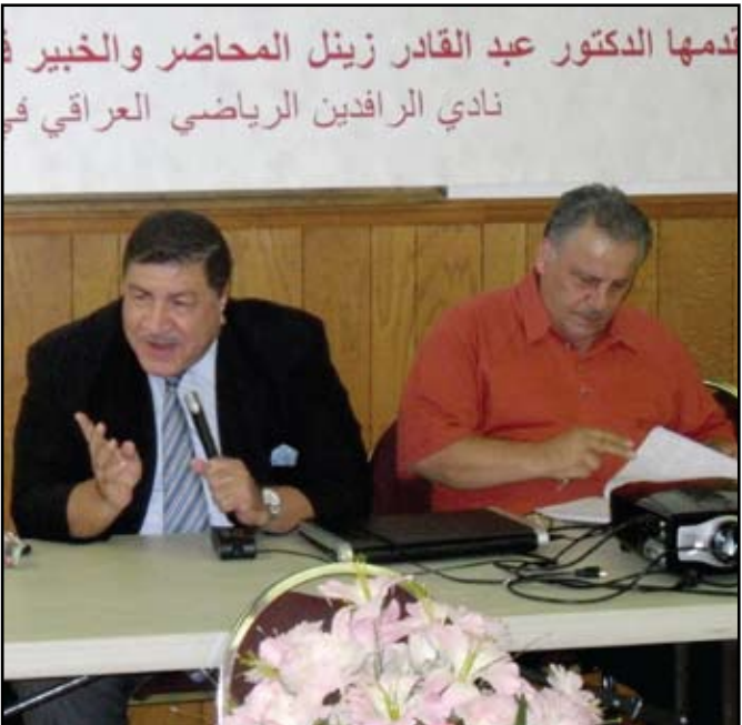
زمنل يتحدث عن تجربته الكروية أمام الجالية العراقية في ديترويت

حادي عشر: الإعلام والصحافة الرياضية إن دور المؤسسات الإعلامية بشكل عام حيوي ومهم جداً في العملية الرياضية والتربوية والتوعوية ويسهم مساهمة فعالة في آفاق تطورها ، على أن تأخذ هذه المؤسسات الرياضية دورها الكامل بالتعبير والنقد اللذين من شأنهما المساهمة في تصحيح الأخطاء إن وجدت ومعالجتها من خلال وضع الحلول المنطقية ورصد الخلل . إن طموح الجميع وهذا ما نعهد ان