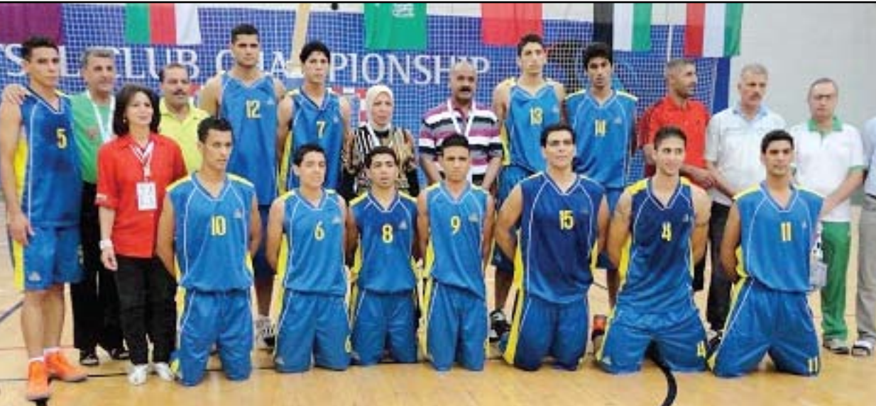
منتخب الطائرة المدرسي