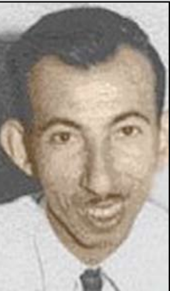
مطبعة الغري الحديثة بالنجف سنة ١٩٥٠م بتوظيف الأساطير، لأنه عبارة عن قصائد وجدانية غنائية مؤه بدر

بسميتها "أساطير" كي لا يكشف أن الكثير من تلك القصائد قد كتبها في الشعرة لميعة عباس عمارة التي كان يحبها حباً جماً، وتكشف بعضها أنها زارته في جيكرور حين تم فصله من دار المعلمين العالية سنة "دراسية" واحدة لنشاطه النضالي، ولعل مقدمة القصيدة التي سُمي الديوان باسمها تكشف عن ذلك التموهية، فقد جاء فيها: "وقف اختلافاً في المذهب حائلاً بينهما وبين السعادة، فأبى هو أن يلعن الأوثان". ولكي يبعد الشك عنه وعن لميعة أضاف بين معقوفتين اثنتين جملة [قصة في اليونان القديمة]. ولد بدر شاكر السياب في ١٩٢٦م، وتوفاه الله في ١٩٦٤م/١٧/٢٤، في المستشفى الأميري بالكويت، وحمل جثمانه إلى البصرة، ودفن في مقبرة الحسن البصري.