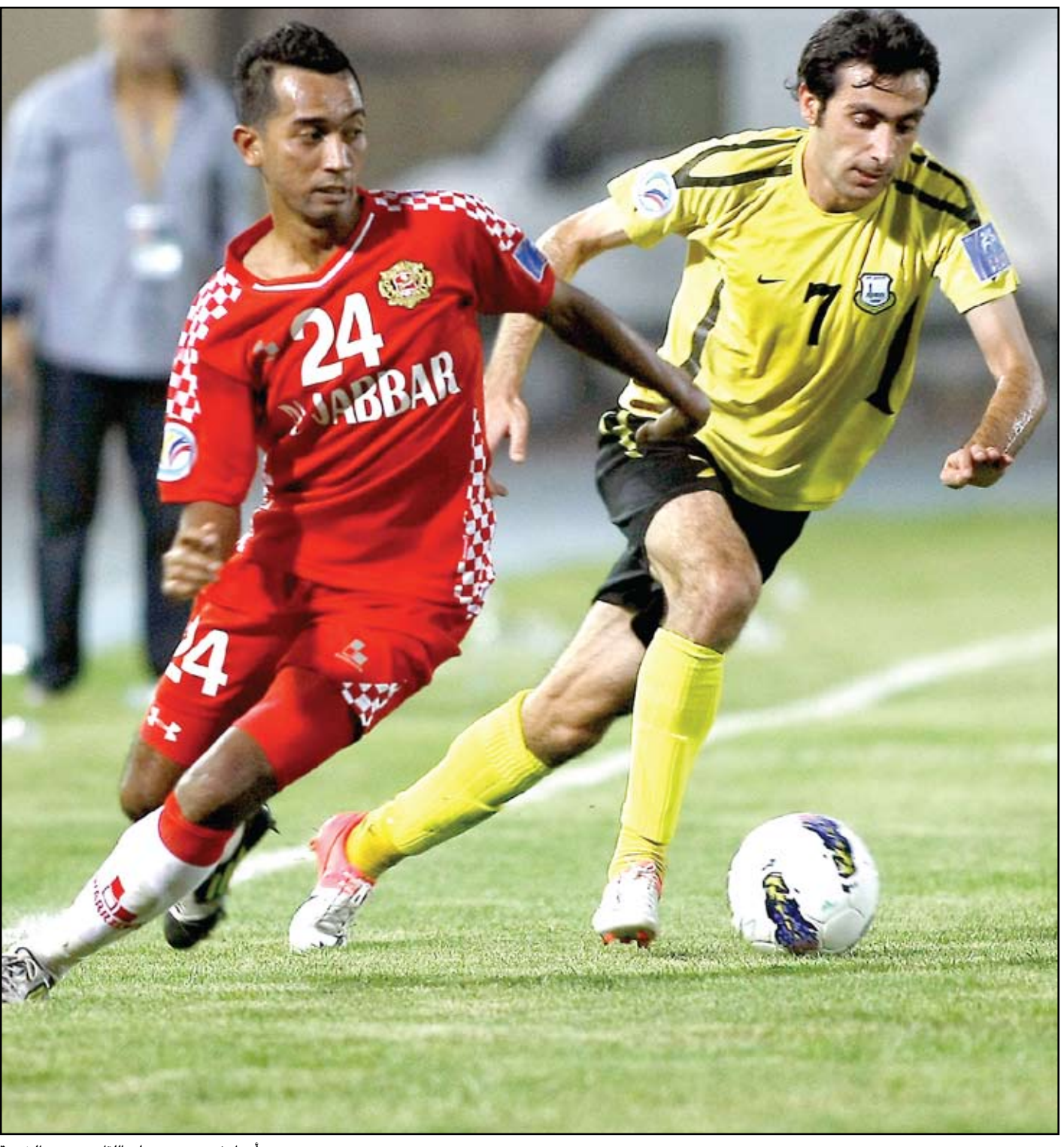
أربيل فرض هيمنته على اللقاء وحسمه بالخمسة