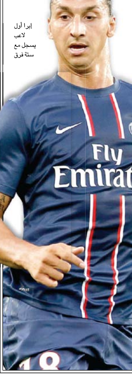
إبرا اول لاعب يسجل مع ستة فرق

□ باريس / وكالات استهل باريس سان جيرمان الفرنسي مشواره في دور المجموعات ببطولة دوري أبطال أوروبا بفوز كاسخ على أرضه على حساب ضيفه دينامو كييف الأوكراني بأربعة أهداف لواحد في أولى جولات المجموعة الأولى. اعتلى الفريق الباريسي الصدارة بفارق الأهداف عن بورنو البرتغالي الذي عاد بفوز نفيين من ملعب دينامو زغرب الكرواتي بنتائبة بيضاء. ففي المباراة الأولى دخل السلطان السعودي زلتان إبراهيموفيتش التاريخ من أوسع أبوابه، حيث بات إبرا كادابرا أول لاعب في تاريخ البطولة يسجل مع ستة فرق مختلفة (أياكس، يوفنتوس، إنتر ميلانو، برشلونة، ميلان وباريس سان جيرمان)، وذلك حين افتتح التسجيل (١٩) عبر ركلة جزاء تسبب فيها زميله الفرنسي جيريمي مينيز. وعزز من تفوق أترياء باريس زميله السابق في ميلان المدافع البرازيلي تياغو سيلفا (٢٩) مسجلاً أولى أهدافه مع فريقه الجديد من تسديدة أرضية زاحفة مستغلاً خطأ في التغطية الدفاعية. وبالطريقة نفسها أضاف زميله ومواطنه أليكس هفا دفاعياً آخر بعد دقيقة واحدة لحسم المباراة إكلينيكياً. وقلص الفارق البرتغالي ميغل فيلوسو (٨٧) من تسديدة قوية بعيدة المدى، لكن النجم الأرجنتيني خافيير باستوري أبقى أن يغادر اللقاء من دون إضافة مسنّه الجمالية، فاستغل تمريرة متقنة من زميله البرازيلي نيني بعد مراوغة رائعة للدفاع الأوكراني، حيث تسلم الكرة وصوب أرضية قوية في الشباك (٩٠) مختتماً الأسمية بالرباطية. وعلى صعيد آخر نسب فريق (التنانين) البرتغالي تفوقه خارج الديار على دينامو زغرب الكرواتي التي نجحها الأرجنتيني لوتشو غونزاليس والبلجيكي ستيفن ديغور، حيث سجل كلاهما ثنائية الفوز (٤١ و٩٠).