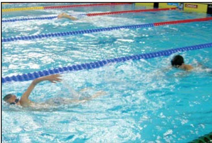
آخر بطولات السباحة الاولمبية لهذا العام تنطلق اليوم

وسيشارك سباحو الاندية لفئات للمتعدين والشباب والشاين في فعاليات