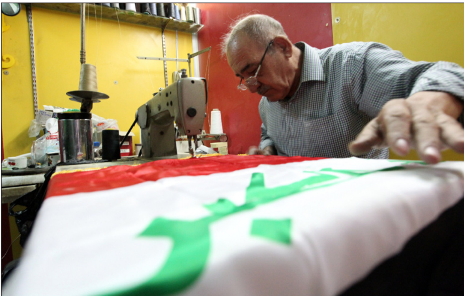
البرلمان يناقش اقرار قانون التشيد الوطني والعلم العراقي..... أ.ف.ب

وقال العامري في حديث لعدد من وسائل الإعلام بينها "السورية نيوز"، على هامش افتتاح مرآب الوفود في منطقة القناة شرق بغداد، إن حالة رئيس الجمهورية جلال طالباني الصحية أصبحت جيدة وسيعود إلى بغداد يوم الثلاثاء المقبل".