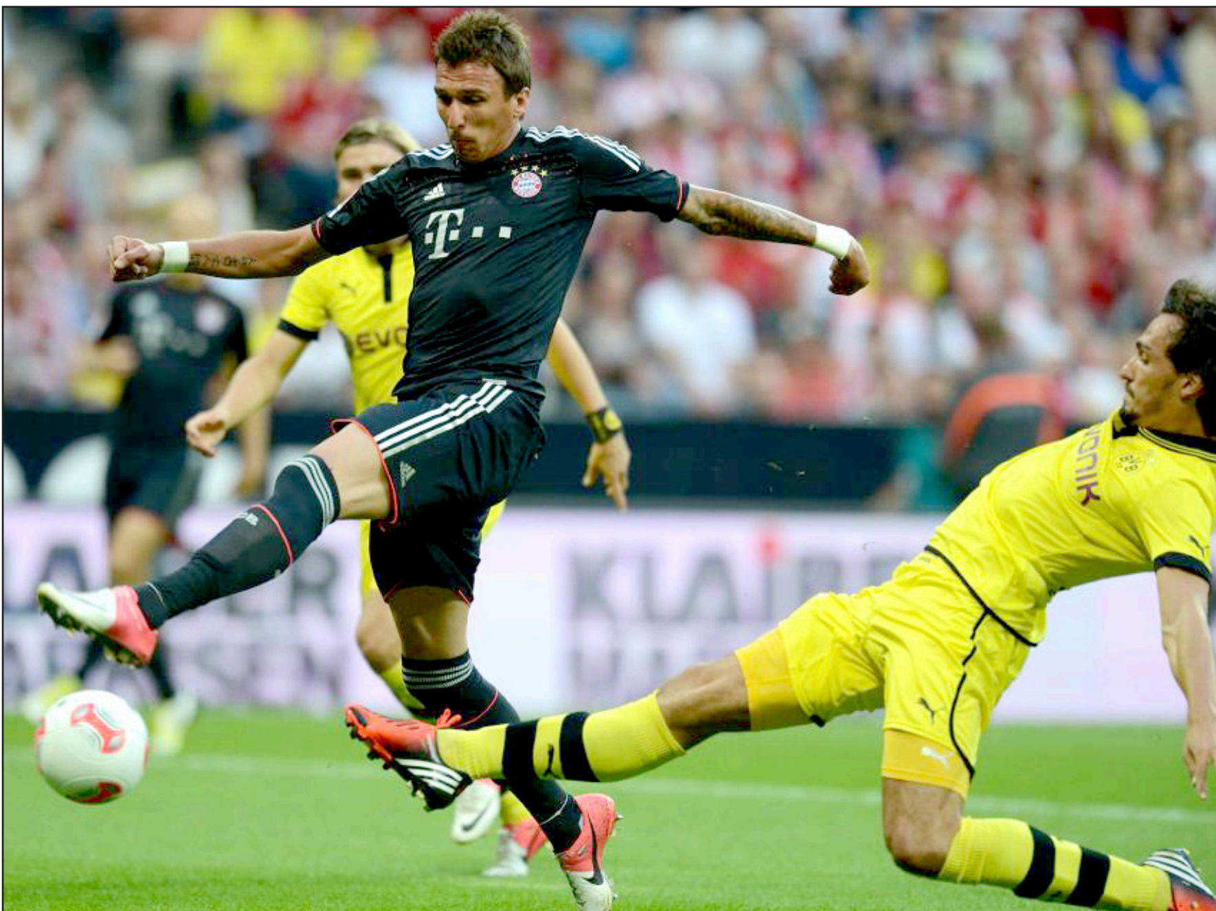
الإثارة تتصاعد في الدوري الألماني

وإضافة إلى ذلك فوزه على نادي يان ريغينبورغ ٥-٠ صفر في بطولة كأس ألمانيا وعلى نادي فالنسيا الإسباني ٢-١ في دوري المجموعات لبطولة الأندية الأوروبية الأبطال، ولذلك كله تنتظر فيردر بريمن الذي سيلعب على أرضه وأمام أنظار جمهوره، مهمة صعبة لإيقاف "العصار" البافاري الذي يبدو حتى هذه اللحظة من زمن هذا الموسم بأنه لا يوجد أي ناد لديه القوة والقدرة الكافية لإيقافه، ومنها نادي فيردر بريمن الذي ظهر بمستوى غير مستقر في أغلب مبارياته الخمس الماضية التي انتهت بخسارته ٢/١ أمام بروسيا دورتموند، وفوزه على هامبورغ ٢-٠ صفر، وخسارته أمام هانوفر ٣-٢، وتعادله مع شتوتغارت ٢-٢، وفوزه قبل يومين ١-٢ على فرايبورغ.