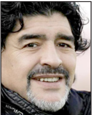
دييغو أرماندو مارادونا

■ تترقب مدينة مندوزا الأرجنتينية وصول الأسطورة دييغو أرماندو مارادونا للخضوع لعملية جراحية في العين، يجريها له طبيب العيون روبرتو زالديفار. وأشارت مصادر طبية إلى أن مارادونا سيخضع للعملية في مقاطعة شاكاس دي كوربا، أقصى غربي الأرجنتين. وكان آخر ظهور لمارادونا في نصف نهائي كأس ديفيز للنسب والذي جمع بين الأرجنتين وتشيكيا وانتهى بفوز الأخيرة ٣-٢ والتأهل للنهائي، وارتدى مارادونا طوال اللقاء نظارة سوداء. يذكر أن طبيب العيون روبرتو زالديفار يعتبر واحدا من أهم الأطباء في هذا المجال في الأرجنتين.