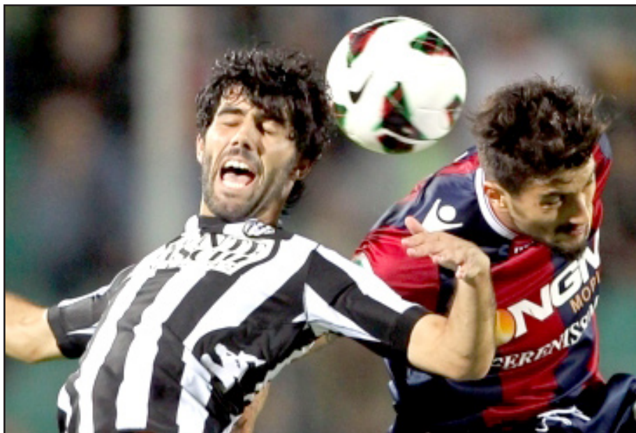
خسارة جديدة لبولونيا

وهذا التوتيرة قليلاً وقلص سينا سيطرة منافسه حتى الدقيقة ٣١ حين أطلق لاعب وسط بولونيا اركيميدي مورليو قذيفة من ركلة حرة بعيدة حولها بيغولو بقبضة يده اليمنى إلى ركنية، تكررت بعدها المحاولات من الجانبين خصوصاً من قبل بولونيا