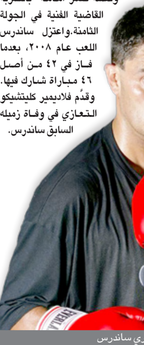
الملاكم كوري ساندرس

ميلاد أحد أقاربه في إقليم نورث ويست السبت الماضي، وتوفي بعد نقله إلى مستشفى في بريتوريا. كان ساندرس قد فاز على فلاديمير كليتشيكو بالضربة القاضية في ٢٠٠٢ ليفوز بلقب المنظمة العالمية للملاكمة في الوزن الثقيل. والنقى وقالت الشرطة إنه من المقرر أن يمثل الشنبة بهم - من بينهما اثنان في العشرين من عمرهما والثالث عمره ١٩ عاماً - أمام المحكمة بعد غد الاثنين. وأصيب ساندرس بطقتين ناريتين خلال عملية سطو مسلح بينمما كان يحضر حفل عيد