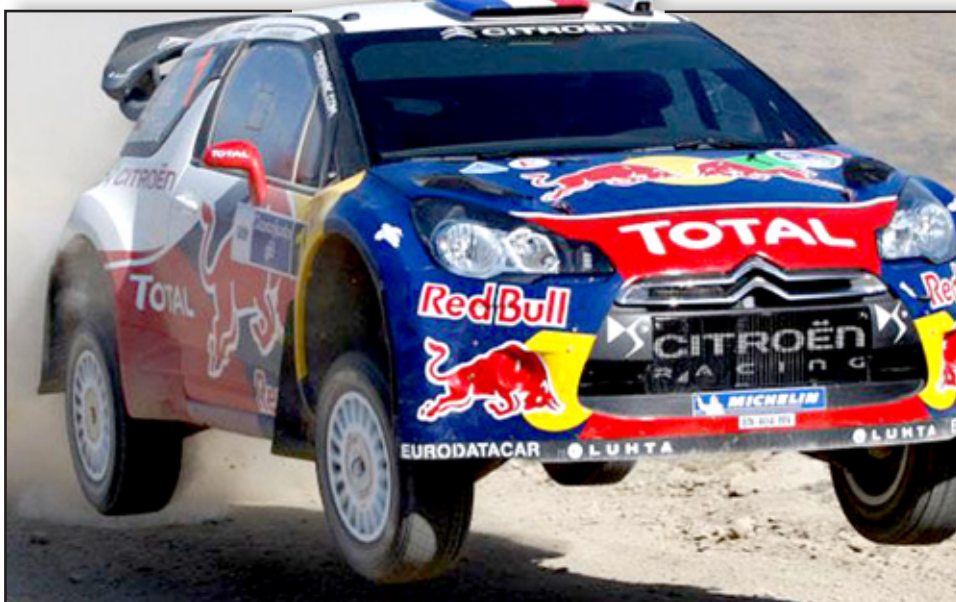
لوب يفشل في تحقيق رقم قياسي جديد في عالم الراليات

□ لندن/ أف ب أعلن مدرب المنتخب الإنكليزي روي هودجسون عن تشكيلة من ٢٥ لاعبا استعدادا للمبارتين أمام سان مارينو في ويمبلي وبولندا في وارسو على التوالي في ١٢ و ١٦ تشرين الأول الحالي ضمن الجولتين الثالثة والرابعة من منافسات المجموعة الثامنة في التصفيات الأوروبية المؤهلة الى نهائيات كأس العالم المقررة في البرازيل عام ٢٠١٤. ولم يوجه هودجسون الدعوة الى قطب دفاع مانشستر يونايتد ريو فرديناند (٣٣ عاما و ٨١ مباراة دولية) الذي كان مرجحا عودته الى التشكيلة عقب اعتزال قائد المنتخب السابق وتشيلسي حاليا جون تيري اللعب دوليا على خلفية إيقافه من قبل الاتحاد الإنكليزي ٤ مباريات بسبب توجيه اهانات عنصرية بعدما وجد الاتحاد المحلي تيري مذنباً بتوجيهه اهانات عنصرية مدافع كوينز بارك رينجرز انطون فرديناند، شقيق ريو،