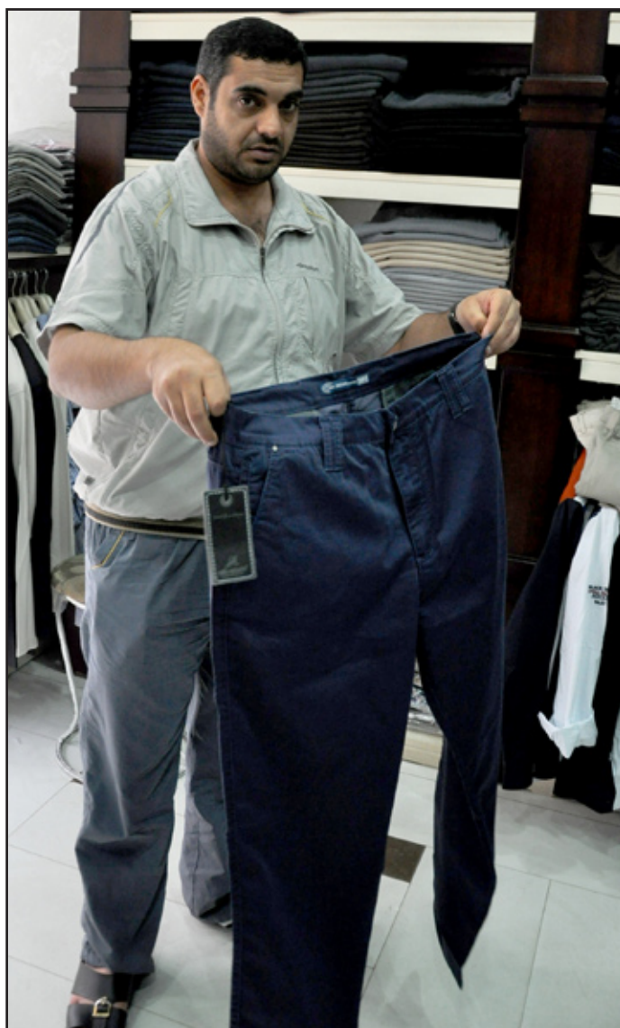
قياس ١٠٠ سم