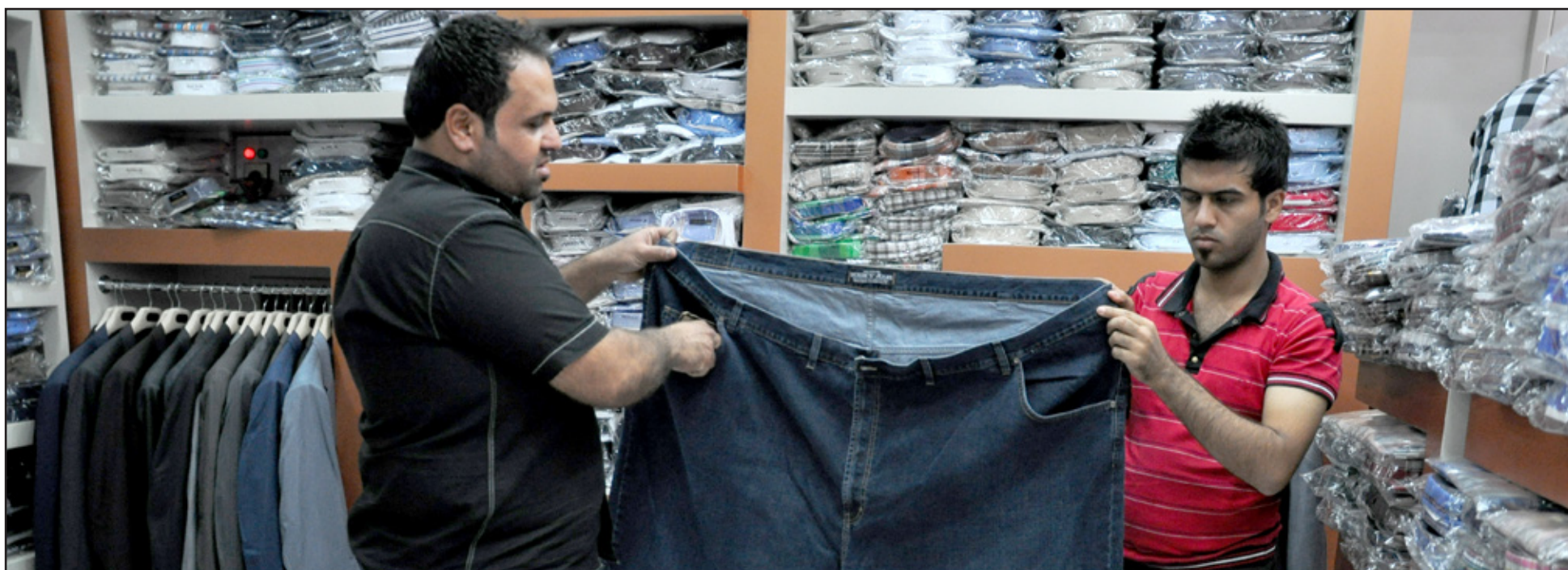
بنطال كأنه عباة

الذكورية وإنتاج الحيوانات المنوية، والشهوة الجنسية، ومسؤول أيضا عن نمو شعر اللحية. وترتفع مستويات هذا الشيء المسمى "التيستوستيرون" عند مرحلة البلوغ ثم تأخذ في الاستقرار في السنين التالية لها، ثم تبدأ في التناقص عند بدايات أواسط العمر. ولأن الهبوط في المستوى "التيستوستيرون" يكون في المتوسط في حدود ١٪ سنويا، فإن غالبية الرجال الكبار يحافظون على مستوياته الطبيعية. إلا أن السمنة تسرع من تقليل مستويات "التيستوستيرون"، حيث إن الرجال البدناء يعانون من تعرضهم لخطر أعلى للإصابة بضعف الانتصاب.