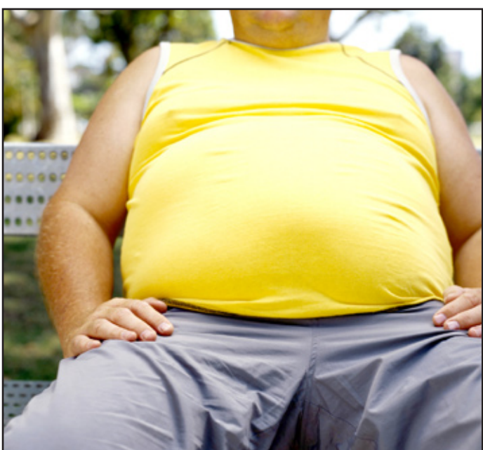
بدن يبحث عن حل