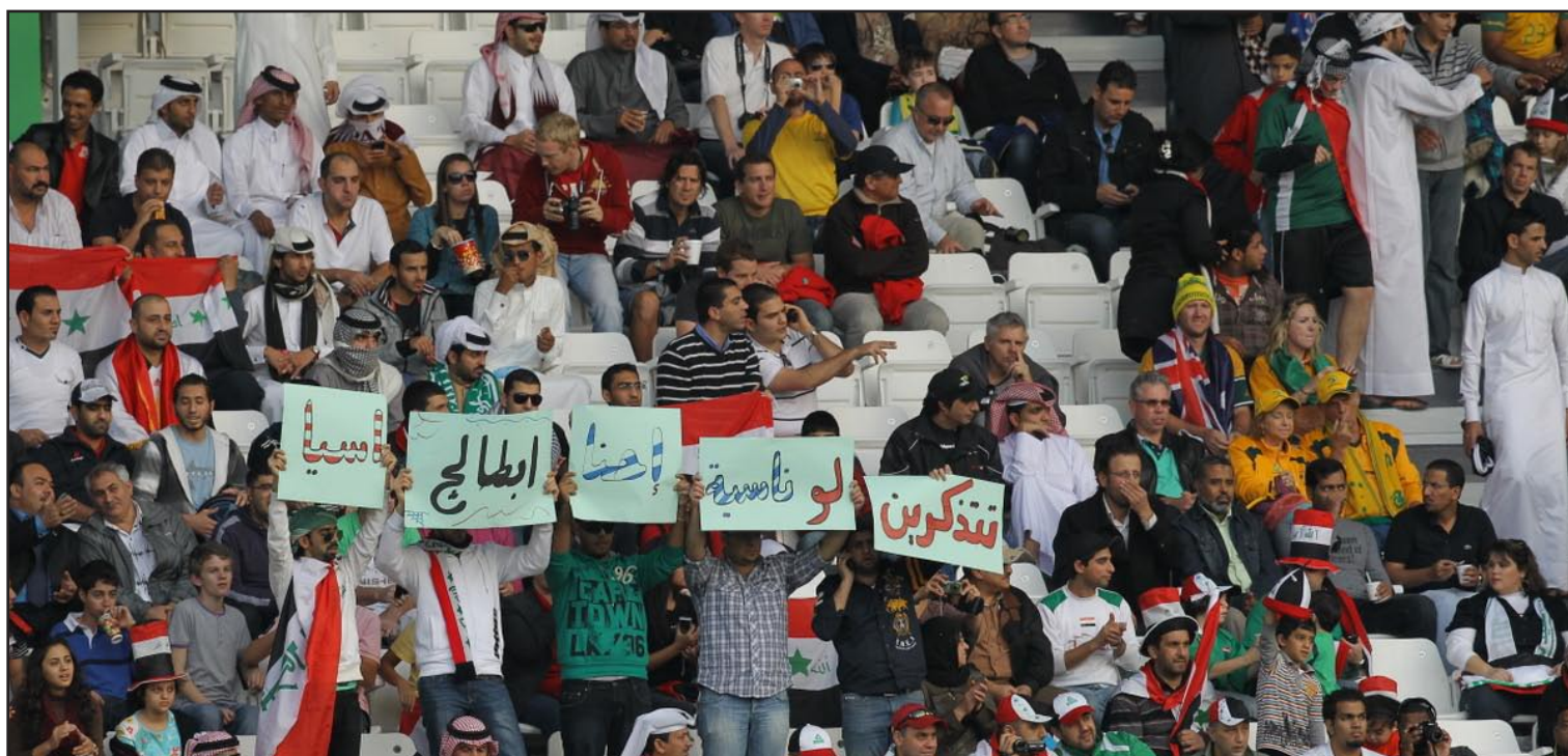
صدمة الجماهير العراقية بعد الخسارة امام استراليا

اعترف البرازيلي زيكو مدرب منتخبنا الوطني لكرة القدم ان الخسارة امام استراليا ٢-١ في الجولة الخامسة من التصفيات الآسيوية المؤهلة الى مونديال البرازيل جعلت موقف العراق صعباً جداً بعد تراجعه الى المركز الاخير في ترتيب منتخبات المجموعة الثانية التي يتصدرها المنتخب الياباني .