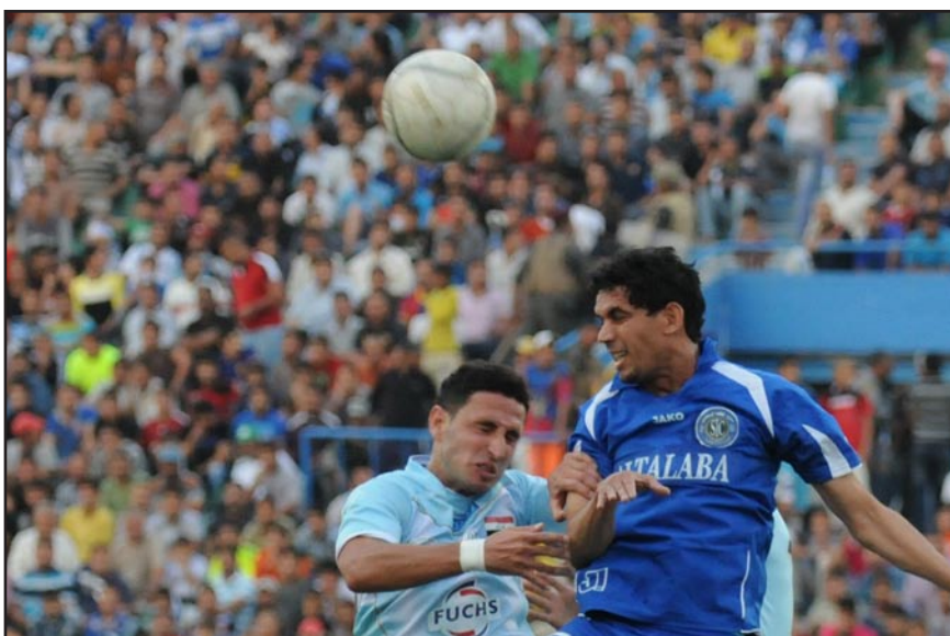
الجوية يستهل الدوري بلقاء مع الكهرباء

اليوم الجمعة سيشهد اقامة ثلاث مباريات على ملاعب بغداد والمحافظات حيث يضيف ملعب الشعب الدولي مباراة فريقى القوة الجوية والكهرباء التي يقودها طاقم تحكيمي مؤلف من علي صباح وحسين تركي وعمر رشيد ويوسف سعيد حكما رابعا وحازم حسين مقيما للحكام والمشرف خضير عباس ، بينما يحل فريق بغداد ضيفا على فريق كربلاء في مباراة يقودها الحكام واثق محمد ومحمود خلف وحيدر عبد الحسين وضياء جنديل حكما رابعا وعادل القصاب مقيما