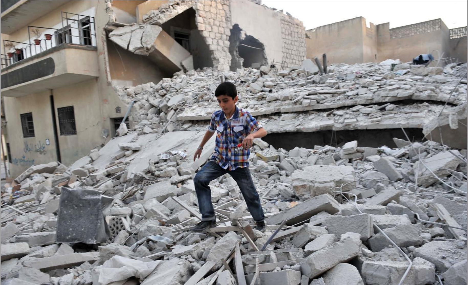
طفل سوري يبحث في أنقاض منزله في معرة النعمان الذي دمرته القوات الحكومية على ما يمكن العثور عليه.....