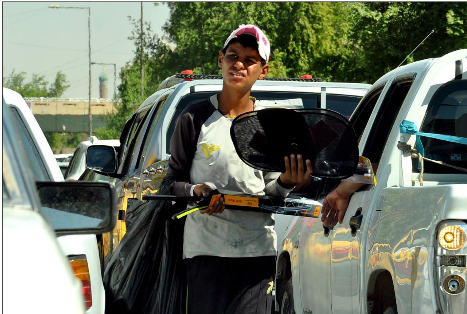
زحامات بغداد مصدر للرزق..... تصوير محمود رؤوف

ينكر ان الأجهزة الامنية في محافظة البصرة تنفذ بين فترة وأخرى حملات مدمامة للصيدليات غير المرخصة ولباعة الادوية على الارصفة من أجل تحقيق أمن دوائي للمواطن.