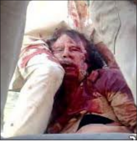
ونجّله المعتصم في مدينة سرت، عقب شهرين من وصول المعارضين إلى العاصمة طرابلس، وأنها توفيا أثناء وجودهما رهن الاعتقال، لافتة إلى أن

وأضافت المنظمة- في تقرير يصف الساعات الأخيرة من حياة القذافي- "إن المسلحين المعارضين اقتادوا العناصر الموالية للقذافي، وقاموا بضربهم بشكل وحشي، ثم قتلوهم في أكبر عملية إعدام جماعي موقوفة خلال فترة الاضطرابات التي شهدتها البلاد". وأشار التقرير إلى أن المسلحين اغتقلوا أيضا القذافي