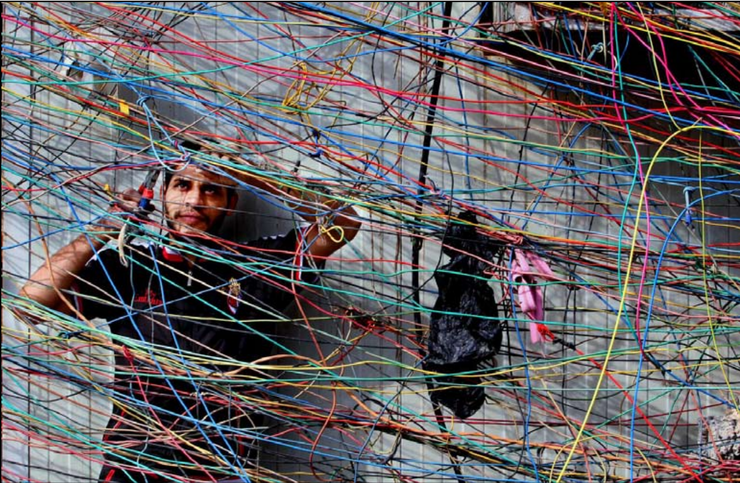
مهمة صعبة لعامل يربط الأسلاك في إحدى المولدات الكهربائية

وهذا يؤثر على المستوى الدراسي للطلبة والتلاميذ . ودعا محمد علي جمعه مدير مدرسة الحكومة المحلية إلى إصدار تعليمات لتزويد المدارس بالطاقة الكهربائية لاسيما وان وزارة الكهرباء لا تستثنئها من القطع المبرمج ،مناشدا أصحاب المولدات الأهلية ولجنة الطاقة للتعاون لإصدار تعليمات لزيادة ساعات التجهيز المجاني ،وطالب الحكومة الاتحادية ولجنة النفط والطاقة لتزويد أصحاب المولدات الأهلية بكمية إضافية من مادة الكاز دعماً لتجهيز المدارس المسائية بالطاقة الكهربائية