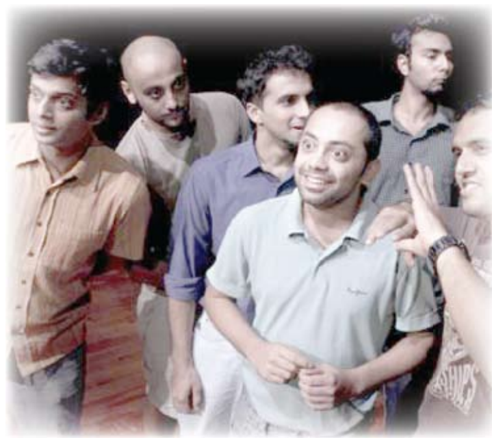
فوق عش الوقواق الى المسرح

و يفسر الياس خوري ذلك الصراع في مقدمته للرواية الصادرة باللغة العربية عام ١٩٨١ بقوله إن بين راتشيد الممرضة و ماكمورفي، الأميركي الصحيح العقل الهارب من الأشغال الشاقة إلى مستشفى الأمراض العقلية، علاقة بالغة التعقيد، علاقة القمع المضدوج. فراتشيد تحاول أن تفصح القمع الجزئي الذي يمارسه ماكمورفي على نزلاء المستشفى عبر أخذ أموالهم، و ماكمورفي يحاول أن يفصح القمع العام الشامل الذي تمارسه الممرضة. في الإنتاج الأخير، فيقوم بالدورين على التوالي راجيف رافيندرانات و فينا سايجناني. و لقد اتخمت قصة كيسي الأصلية بموضوعات التمرد الراديكالي ضد مؤسسة الستينيات من القرن الماضي. فنجد راندل ماكمورفي (من شخصيات القصة) يختار أن يقضي