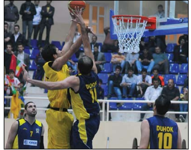
لقاء، تأري بين الكرخ ودهوك في القمة السلية

الربعة بقاعة نادي الكرخ في المنصور. وتعد هذه المباراة مهمة للفريقين فالكرخ يريد ألا يفرط بنقاطها ليقترب أكثر من دهوك ومزاحمته للمنافسة على الوصافة بعد ان ذهبت الصدارة المؤقتة لفريق الكرخ.