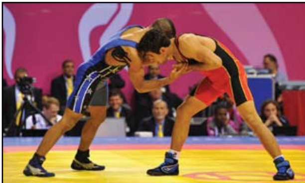
جانب من احدى بطولات الصارعة العربية