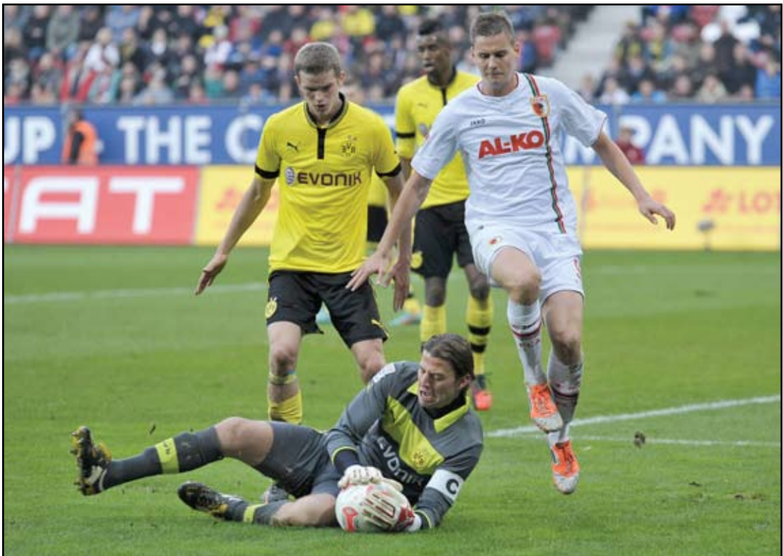
كأس ألمانيا تشهد مباريات حذرة

النادي البافاري الذي يسعى للفوز باللقب السابع عشر في بطولة الكأس ويواصل مسيرته بنجاح في هذا الموسم الذي انتهى قبل يومين رسميا وقبل ان يتمتع لاعبو هذا النادي في اجازة اعياد الميلاد والعام الجديد وقبل ان يحزموا حقائبهم للسفر الى الدوحة في الثاني من كانون الثاني المقبل لإقامة معسكر تدريبي استعدادا