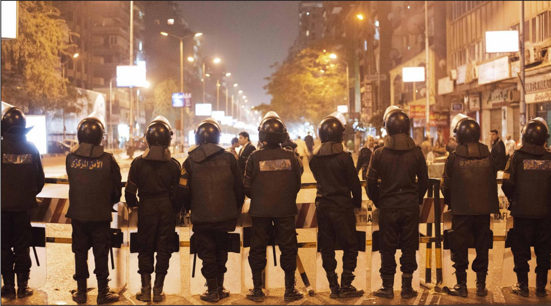
شرطة مكافحة الشغب المصرية تطلق الطريق المؤدي إلى مركز الشرطة في حي الدقي