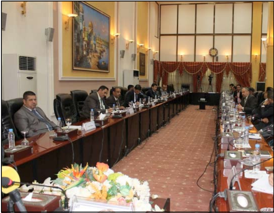
جانب من مؤتمر مسؤولي الاعلام في المحافظات

ومضى مدير الإعلام في مجلس محافظة واسط قائلاً، إن "المؤتمر تناول المخطط والبرامج الإعلامية في المحافظات وما ينبغي القيام به مع مطلع العام الجديد"، لافتاً إلى أن "التركيز سيكون على المشاريع المتكئة وريدية التنفيذ وكل السبلات الأخرى دون أن تكفي بالإيجابيات كما كان سائداً". يذكر أن الكثير من الصحافيين والعاملين في وسائل الإعلام المقروءة والمكتوبة والمرئية والصحافة الالكترونية، يعانون من سلوكيات قسم من مديري الإعلام سواء في الوزارات أم في المحافظة من خلال حجب المعلومات عنهم أحياناً أو اقتصار التعاون مع مؤسسة إعلامية معينة وعدم التعامل مع مؤسسات بذاتها .