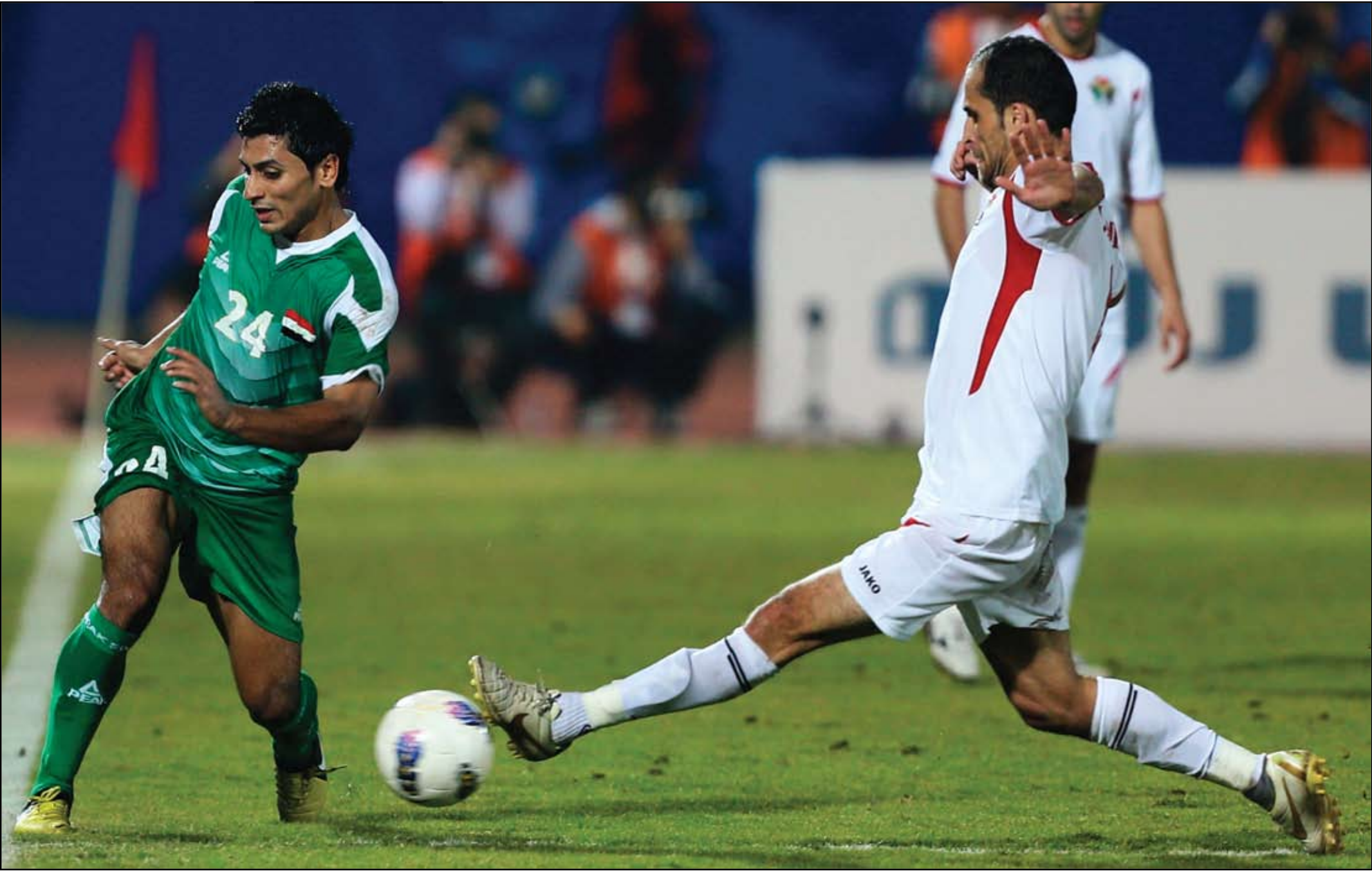
منتخبنا في مواجهة صعبة مع شقيقه العُماني