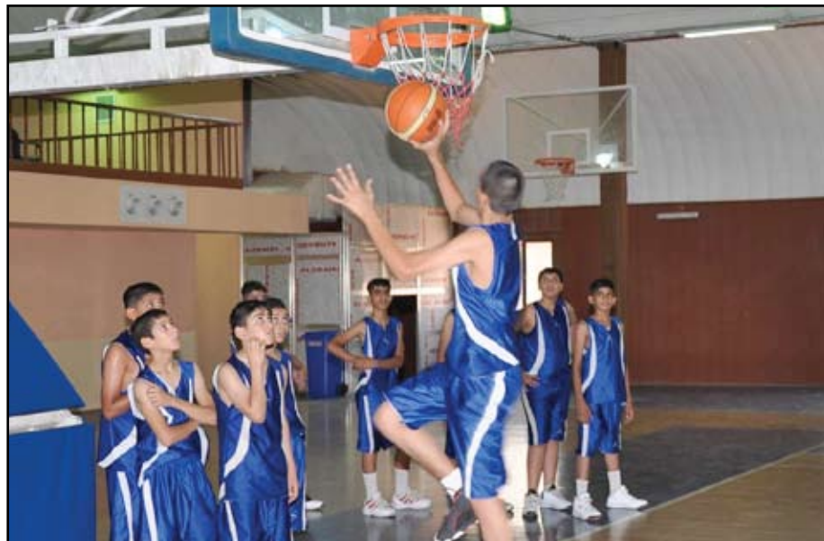
جانب من تمارين لحد الفرق المدرسية