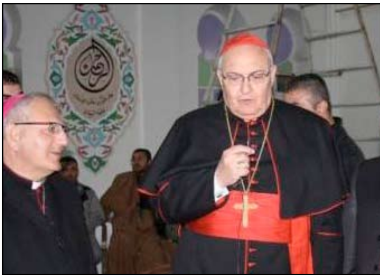
سفير الفاتيكان للشرق الأوسط ومبعوث البابا بندكتوس السادس عشر إلى كركوك ليوناردو ساندرى

وسلام وتدعو للحوار وتقبل الآخر والعيش المشترك بين جميع العراقيين". يشار إلى أن المسيحيين في العراق يتعرضون منذ العام 2003 إلى أعمال عنف واستهداف في العاصمة وفي عدد من المحافظات العراقية مثل الموصل وكركوك والبصرة، كان أعنفها حين اقتحم مسلحون كنيسة سيدة النجاة، في 31 تشرين الأول 2010، واحتجزوا عشرات الرهائن من المصلين الذين كانوا يقيمون قداس الأحد، وأسفر الاعتماد عن مقتل وإصابة ما لا يقل عن 125 شخصاً، وتبني تنظيم ما يعرف بـ "دولة العراق الإسلامية" التابع لتنظيم القاعدة، الهجوم في وقت لاحق، مهدداً باستهداف المسيحيين في العراق مؤسسات وأفراداً. وفي آذار عام 2008، خطف المطران الكلداني الكاثوليكي بولص فرج وعر وعثر عليه مقتولاً في وقت لاحق،