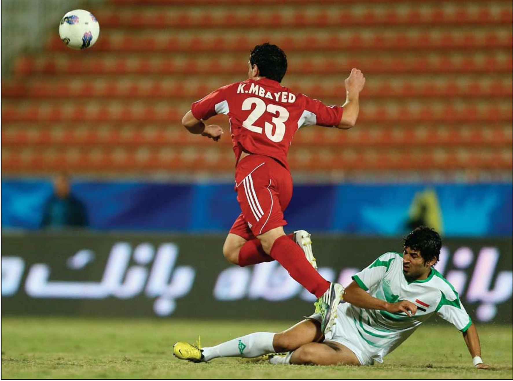
منتخبنا يطمح بلوغ الدور النهائي لغرب آسيا