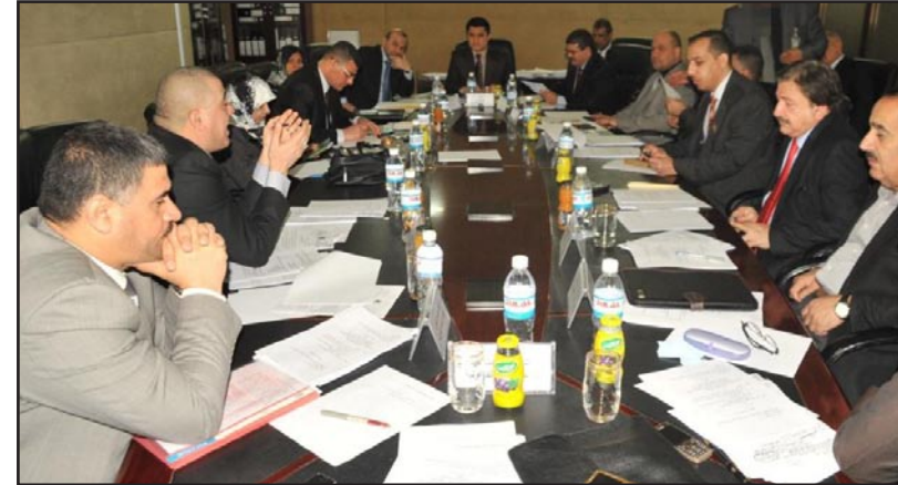
اللجنة القانونية البرلمانية ... اشراف

وتنص المادة الثالثة / ثالثا - خامسا، على ان مجلس القضاء الاعلى يتولى: ترشيح رئيس ونواب ورئيس واعضاء محكمة التمييز