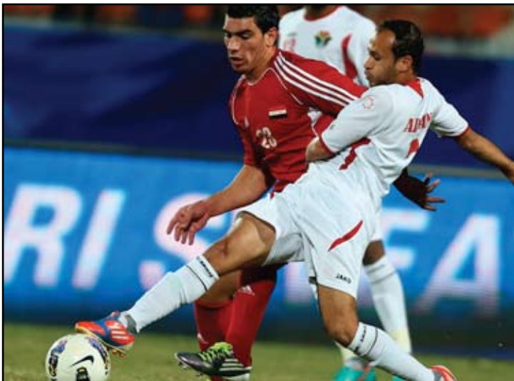
الاردن خارج حسابات التأهل بهزيمته الموجة

المسابقة منذ انطلاقتها عام ٢٠٠٠. ومع بداية الشوط الثاني، بدأ منتخب سوريا بصورة مغايرة تماما، كما كانت عليه الحال امام العراق عندما قدم شوياً