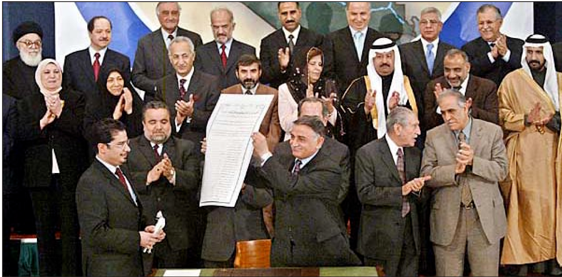
صورة أرشيفية لمجلس الحكم السابق.

على الدستور والديمقراطية المستندة عليه مما يتطلب عملا عراقيا بامتياز وفي بيئة قانونية، لكن التعبير عن هذه الإرادة مجسدة في حكومة، أغلبية كانت او شرًاكة، تحتاج الى ضمانات تحفظ للقواعد نفسها ولحريات افرادها وحقوقهم الديمقراطية، وتحول دون طغيان السلطان، شيعيا كان او سنيا، عربيا او تركمانيا او كرديا، على اراذلتهم ومصالحهم ومستقبل بلادهم.