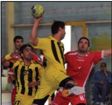
النجف يصمم مباراته مع كربلاء بكرة اليد

وإرسال أسماء الوفد من الإداريين واللاعبين وتحضير تأشيرات السفر، مبيّنا أنه تم تخصيص معسكر داخلي للفريق في المركز الوطني للصارعة ويضم خمسة عشر لاعبا سيتم اختيار أفضل عشرة إذ يجري اللاعبين تمارين مكثفة بواقع وحدتين تدريبيتين صباحا ومساءً بهدف رفع المستوى البدني والفني للاعبين وإيصال جاهزيتهم إلى مستوى قوي يمكنهم من منافسة