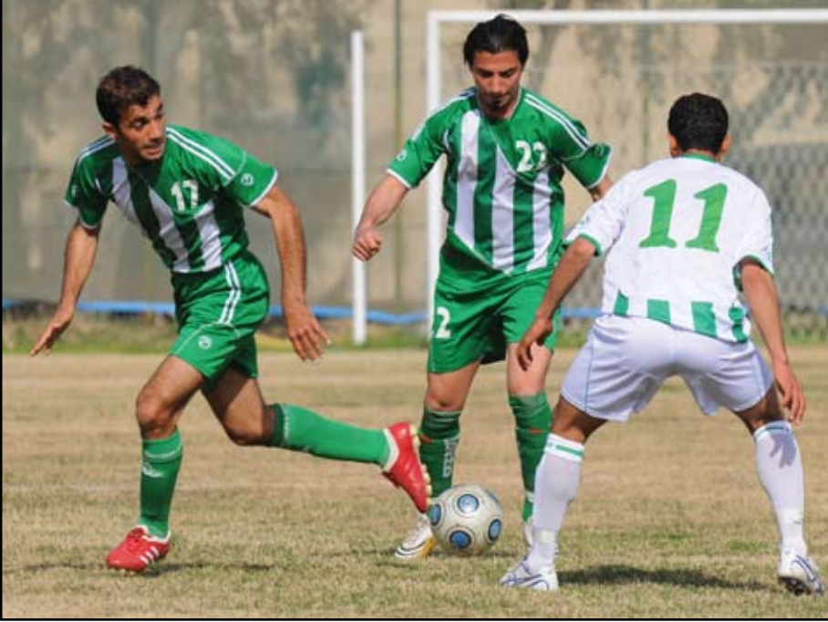
النفط انتزع نقطة ثمينة من الشرطة