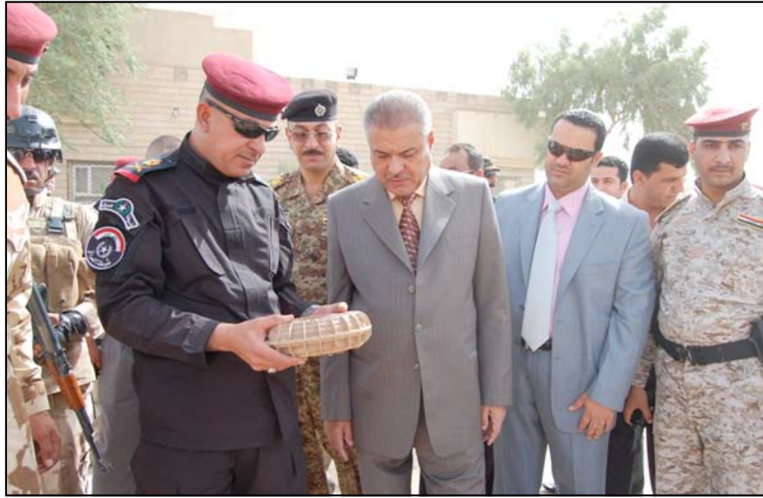
قوة أمنية في ذي قار تعانين لغماً مضاداً للمدركات.. أرشيف

وكانت مديرية بيئة ذي قار قد أعلنت في الرابع من تشرين الثاني الماضي، عن انطلاق العمل ببرنامج إحصاء ضحايا الألغام والمخلفات الحربية في المحافظة. وأوضح مدير دائرة شؤون الألغام في وزارة البيئة، أن "العمل ببرنامج مسح الضحايا مدد لغاية الأول من آذار 2013 المقبل، لافتاً إلى أن "الدائرة تبنت برنامجاً يتضمن دعم مراكز إعادة تأهيل المعاقين ومراكز الأطراف الاصطناعية بمواد أولية ذات تقنية عالية فضلاً عن التدريب التقني والطبي". وتابع الفياض، أن "دور دائرة شؤون الألغام لا يقتصر على تطهير المواقع