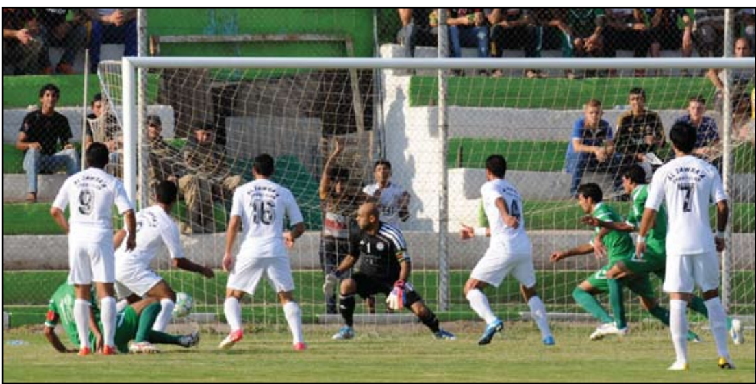
الزوراء يستعيد استقراره وتوازنه في النخبة

حتى تكون حالة الانسجام واضحة بين خطوط الفريق، لذلك فإن قلة الانسجام في بداية الدوري هي التي أدت إلى حصول بعض الهفوات، لكن في المباريات الأخيرة بدأ الانسجام يفرض نفسه بين كل خطوط الفريق، ما أدى إلى تحسّن المستوى العام وكذلك النتائج وكلما يتقدم الدوري تكون صورة الزوراء أفضل.