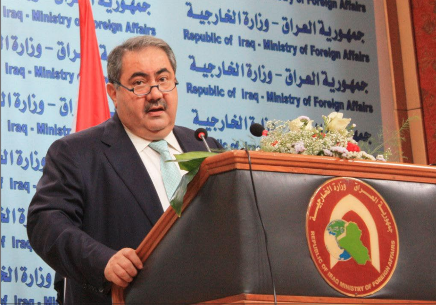
زيباري في مؤتمر صحفي سابق.. (أرشيف)

يذكر أن سوريا منذ (١٥ آذار ٢٠١١)، شهدت حركة احتجاج شعبية واسعة بدأت برفع مطالب الإصلاح والديمقراطية وانتهت بالمطالبة بإسقاط النظام بعدما ووجهت بعنف دموي لا سابق له من قبيل قوات الأمن السورية وما يعرف بـ "الشبيحة"، أسفر حتى اليوم عن سقوط ما يزيد على ٤٢ ألف قتيل بحسب المرصد السوري لحقوق الإنسان، في حين فاق عدد المعتقلين في السجون السورية على خليفة الاحتجاجات اله ٢٥ ألف معتقل بحسب المرصد، فضلاً عن مئات آلاف اللاجئين والمهجّرين والمفقودين، فيما تتهم السلطات السورية بمجموعات "إرهابية" بالوقوف وراء أعمال العنف.