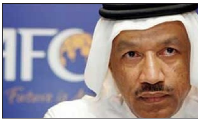
القطري محمد بن همام

القيم، في مقابلة نشرتها صحيفة "فرانكفورتر ألغينيه تسايتونغ" الألمانية: ليس هناك اسمان أو ثلاثة أسماء فقط.. سنشاهد مزيداً من العمليات في هذا المجال، نريد أن نبرهن على أن لجنة القيم ترغب في اتخاذ القرارات التي تضمن تضالاً اتهامات الفساد الموجهة ضد الفيفا بمرور الوقت". وأعلن بن همام قبل يومين استقالته رسمياً من منصبه كرئيس للاتحاد الآسيوي وعضوية اللجنة التنفيذية