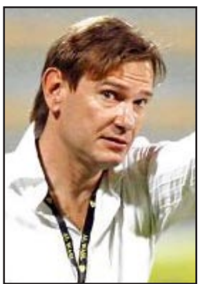
مدرب أربيل الجديد