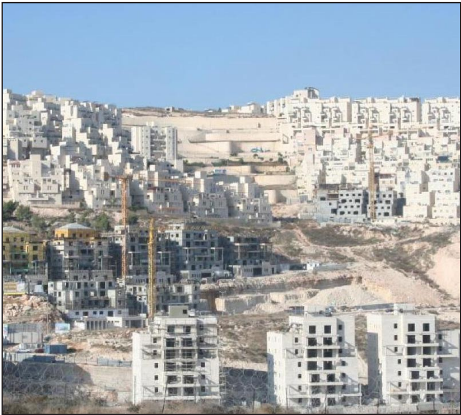
الاستيطان الاسرائيلي على الاراضي الفلسطينية..

موسيخ بوري، البيانات الأربعة المنفصلة التي أدلى بها الأعضاء الثمانية في المجلس من حركة عدم الانحياز وأربع دول أوروبية وكل من