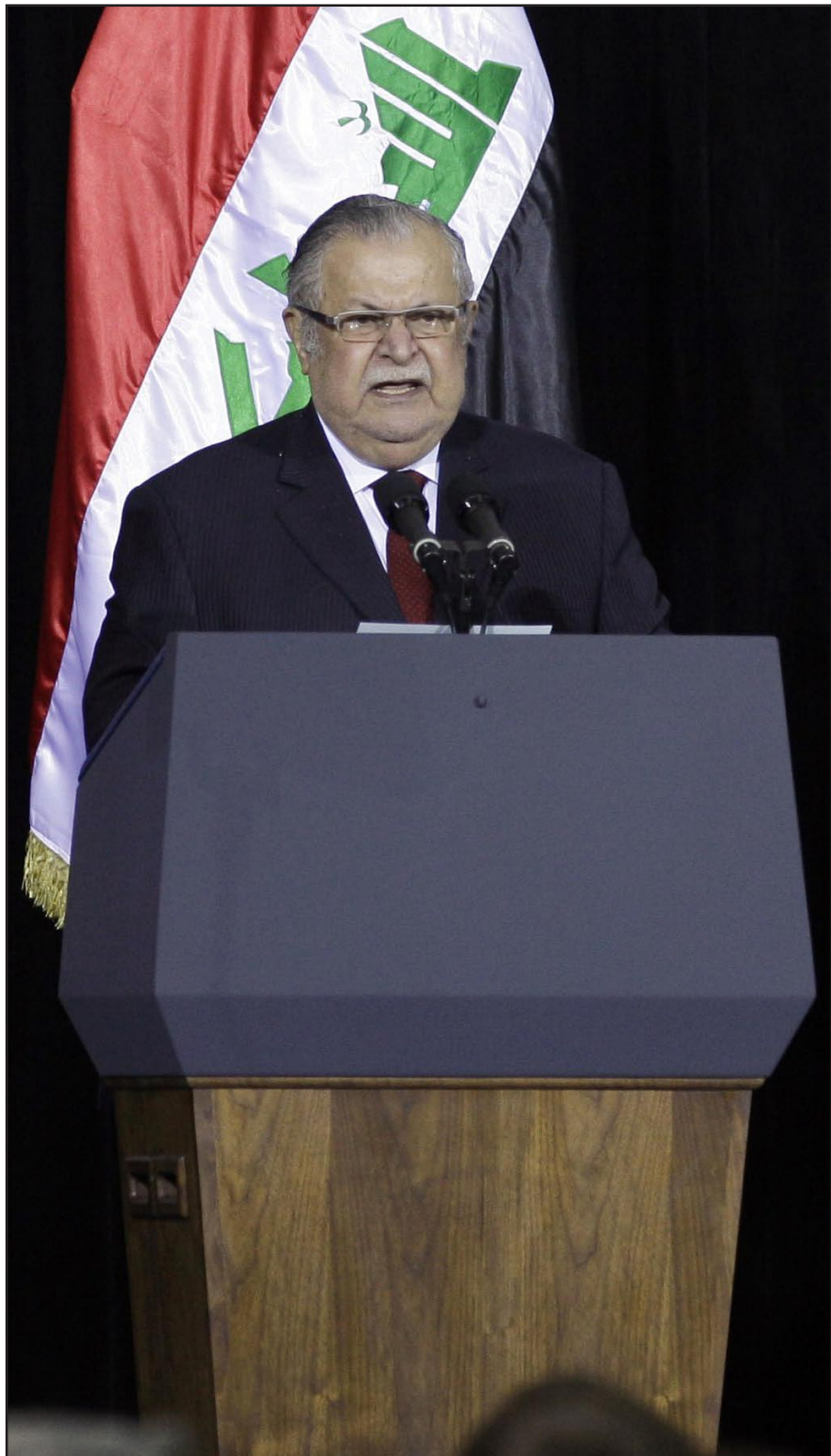
طالباني يصل برلين لتلقي العلاج..

إلى ألمانيا لتلقي العلاج اثر إصابة بعدد من الجلطات الدماغية". وأضاف المصدر انه "من المرجح أن تجري الزيارة في الأيام الأولى من الأسبوع المقبل". وكان مصدر مطلع أفاد، الخميس، بأن الرئيس الإيراني احمدي نجاد سيصل العاصمة بغداد في زيارة رسمية يلتقي فيها عدداً من المسؤولين العراقيين في مقدمتهم