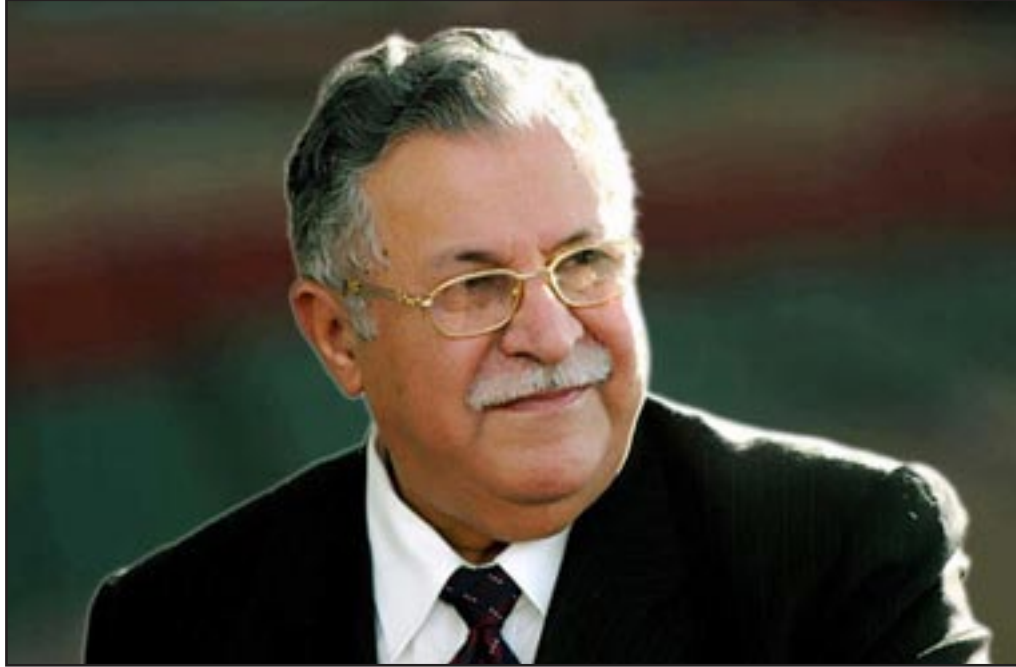
بغداد / المدى - المدى برس

وكانت رئاسة الجمهورية العراقية أعلنت في بيان لها، أمس الخميس، أن الرئيس جلال طالباني غادر