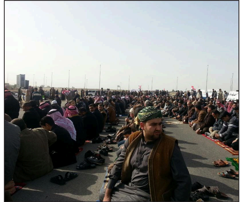
مصلون بقطر الطريق الدولي.. (أرشيف)

وأضاف "أن الأوضاع التي استجدت في المناطق الكردستانية خارج الإقليم حدثت بطرق غير دستورية وأنه لا يمكن قبولها بأي شكل من الأشكال، مشيراً إلى أن "باب الحوار مفتوح للوصول إلى معالجة جذرية لجميع المشاكل بعيداً عن حشد القوات العسكرية". وأكد التزام إقليم كردستان بالعراق الدائم داعياً الحكومة الاتحادية إلى الالتزام بالمادة ١٤٠ منه المتعلقة بكروك والمناطق المتنازع عليها. ومن جانبه أكد السفير الأميركي أن "تغيير الواقع الحالي للمناطق الكردستانية خارج الإقليم يجب أن يكون بالاتفاق مع الحكومة المركزية معرباً عن امتعاضه على ما يدور الآن من أحداث في الساحة السياسية"، في إشارة إلى الأزمة بين المالكي والعيساوي من جهة وبين بغداد وأربيل من جهة أخرى. وأعرب عن أمله "في معالجة هذه الأزمات عن طريق تقريب وجهات النظر بين الأطراف السياسية والعمل المشترك". وقد تم خلال الاجتماع بحث التطورات على الساحة العراقية ومن أهمها العلاقات بين إقليم كردستان والحكومة الاتحادية والأزمة التي حدثت بسبب استقدام القوات العسكرية من قبل