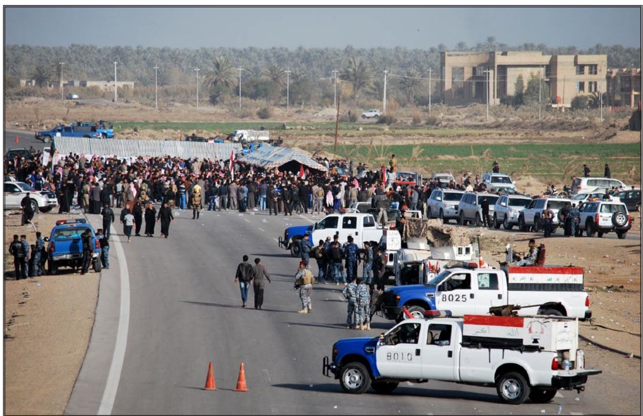
متظاهرين يقطعون الطريق الدولي

وأضاف الأسدي أن الكتلة تهيئ بأهالي الأنبار "ألا يساوموا