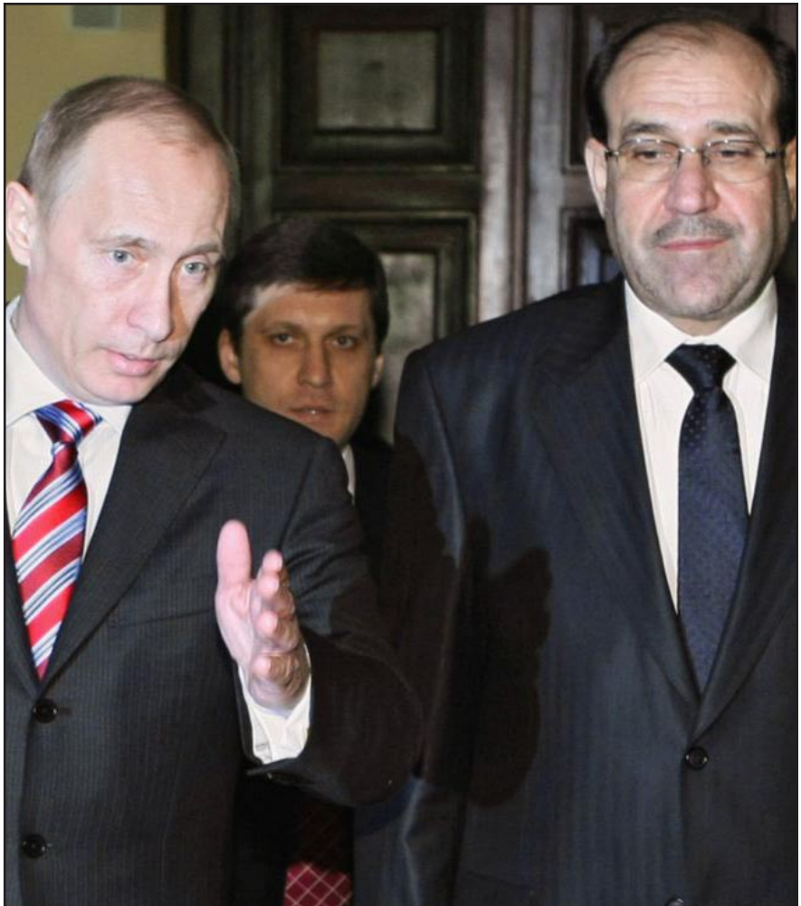
المالكي مع بوتين

يشار إلى أن المستشار الإعلامي لرئيس الحكومة علي الموسوي، في (١٠ تشرين الثاني الماضي)، أن الأخير ألغى صفقة السلاح الروسية التي تفوق قيمتها أربعة مليارات دولار، بعد عودته من موسكو إثر شبهات بالفساد، لكنه يعترض إعادة التفاوض بشأنها، فيما نفى وزير الدفاع وكالة سعدون الديلمي إلغاء الصفقة، مؤكداً أنه يتحمل المسؤولية أمام العراقيين عن أي شبهة فساد. يذكر أن هذه القضية لاقت سلسلة ردود فعل من قبل كتلة الأحرار التابعة للتيار الصدري التي اعتبرت أن اتهام مقرب من مكتب رئيس الحكومة نوري المالكي بتلقي عمولات من الجانب الروسي لترميم صفقة الأسلحة، لا يكره تمريره مرور الكرام"، داعية المالكي إلى الكشف عن المتورطين ومنع المشتبه بهم من السفر.