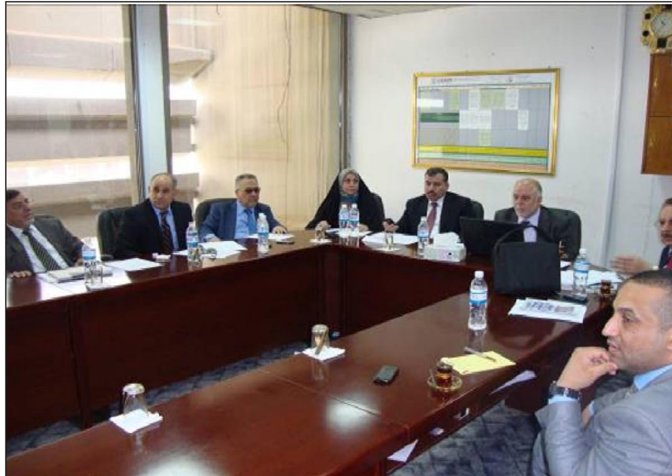
المالية النيابية..