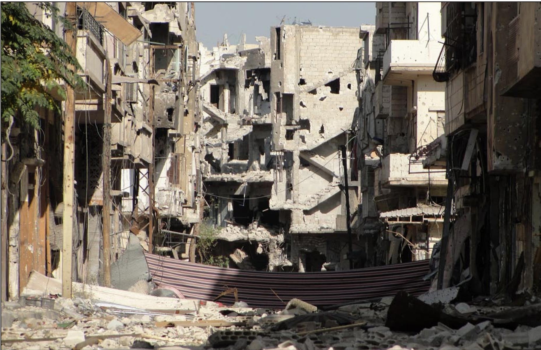
آثار القصف في مدينة حمص..... وكالات