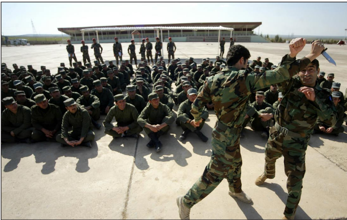
قوات البيشمركة.. (أرشيف)

كشفت مصادر مسؤول في وزارة البيشمركة، مساء الأربعاء، أن الوفد الكردي المفاوض طرح ١٧ نقطة تمثل مبادئ عمل مشترك خلال الاجتماع الوزاري الأخير الذي جرى في بغداد بحضور وزير الدفاع سعدون الدليمي، فيما أكد أن وزارة الدفاع العراقية استقبلت هذه النقاط بشكل إيجابي. وقال المصدر في حديث إلى (المدى برس)، إن "المفاوضات التي تجري حالياً بين الوفد الكردي ووزارة الدفاع العراقية تضمنت طرح الكرد ١٧ نقطة كمبادئ عمل مشتركة لحل الأزمة في المناطق المتنازع عليها"، مبيّناً أن "تلك النقاط كانت محل قبول من جانب وزارة الدفاع".