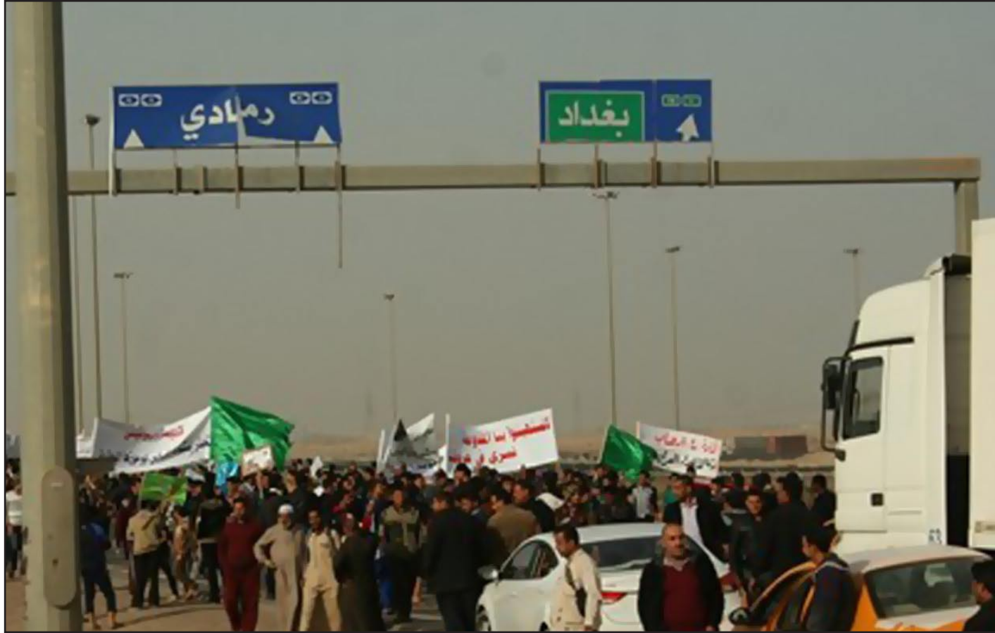
تظاهرات الفلوجة.. (أرشيف)