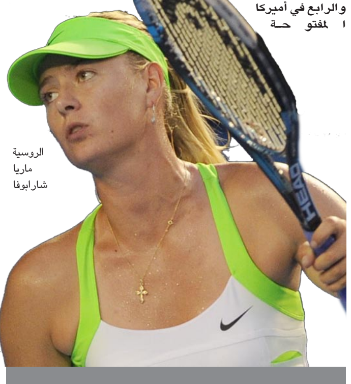
الروسية ماريا شارابوفا

كما انسحبت وليامز التي نالت في ٢٠١٢ لقبها الخامس في بطولة ويمبلدون والرابع في أميركا المفتوحة.