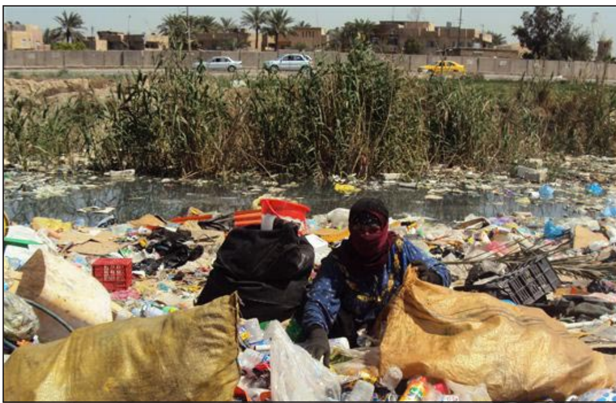
تبحث عن رزقها داخل مكب