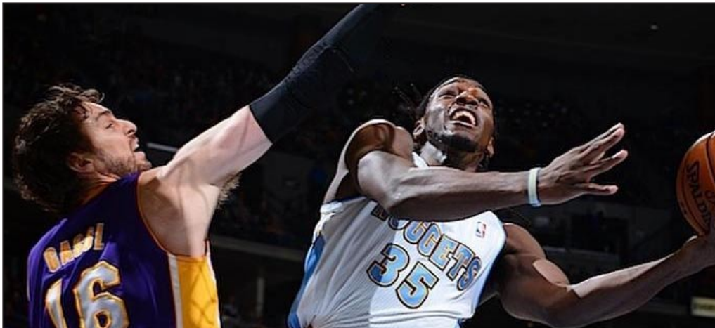
ليكرز يتعرض لخسارة جديدة