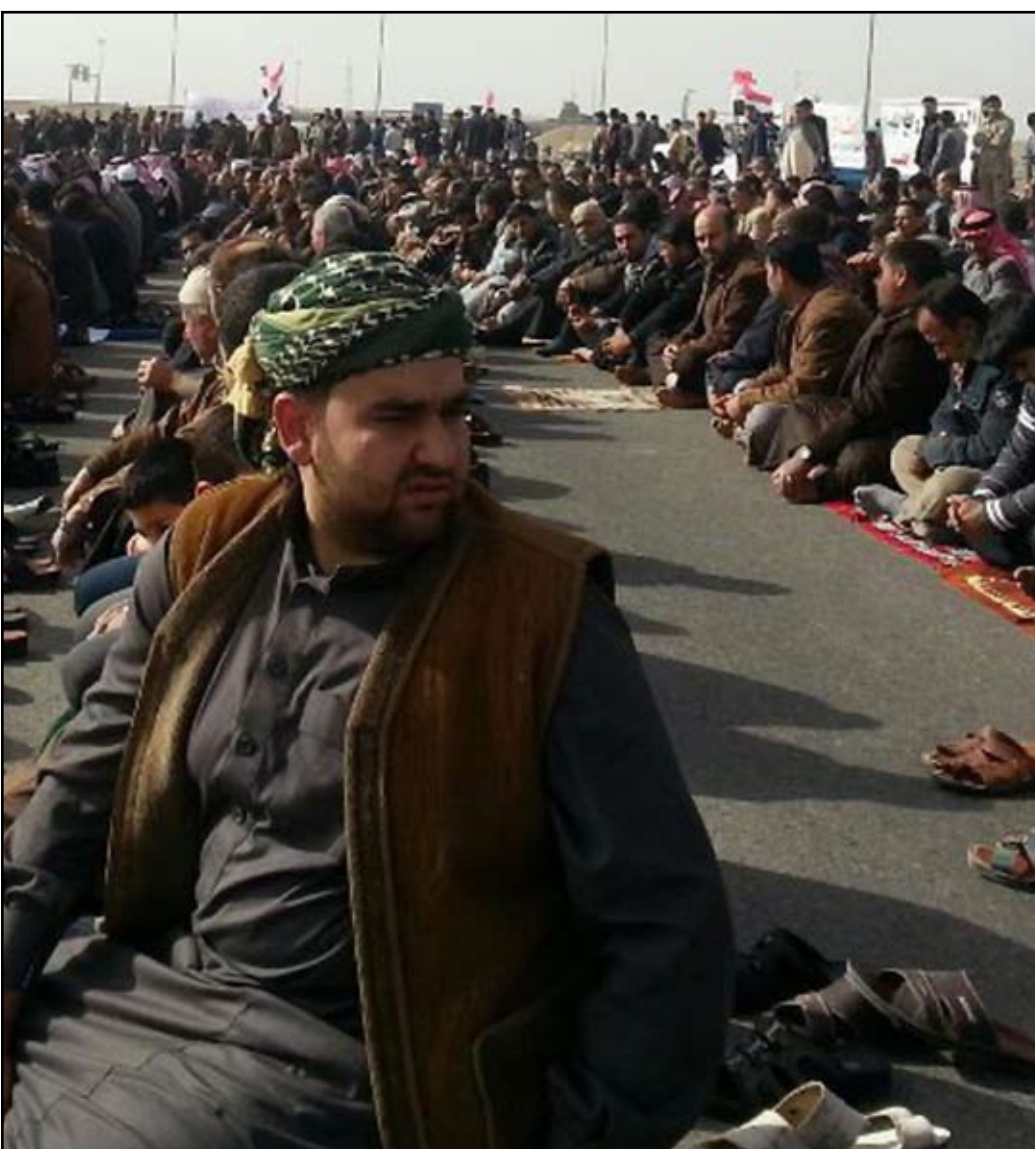
مصلون يقطوع الطريق الدولي.. (أرشيف)

المدى والمدى برس / بغداد والموصل والرمادي