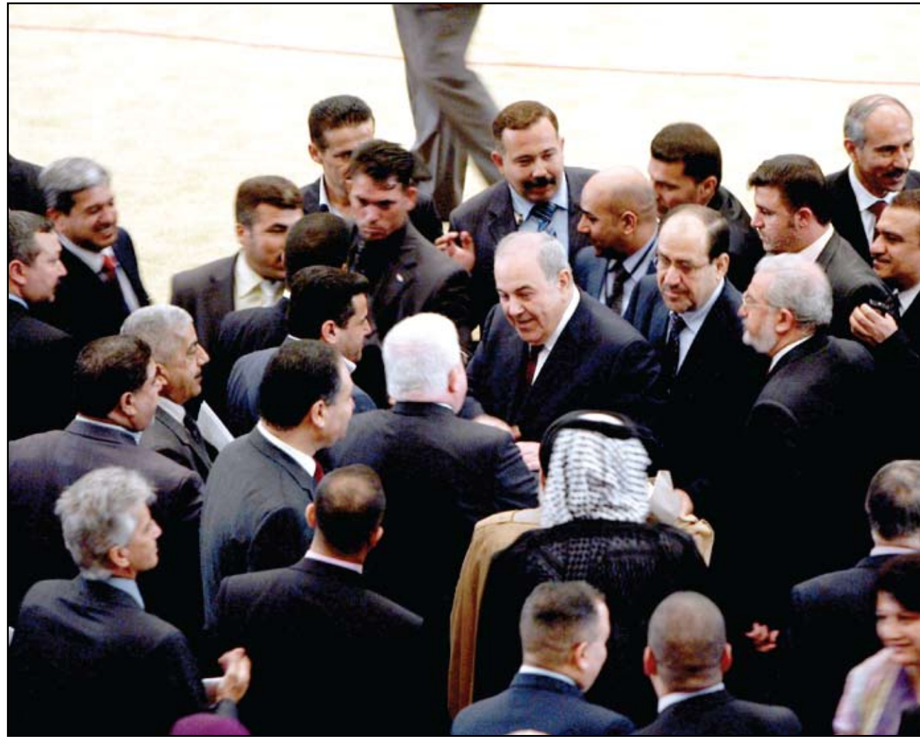
الفرقاء السياسيين.. (أرشيف)

وقال المالكي إن "المشاكل والصراعات السياسية عرقلت وعطلت كل شيء في العراق"، مشيرا إلى أن "قانون البنى التحتية لم يقر الى الآن بسبب الخلافات بين الفرقاء السياسيين".