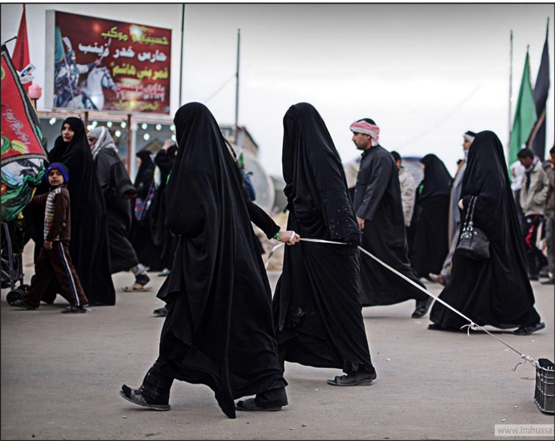
زوار في طريقهم إلى كربلاء