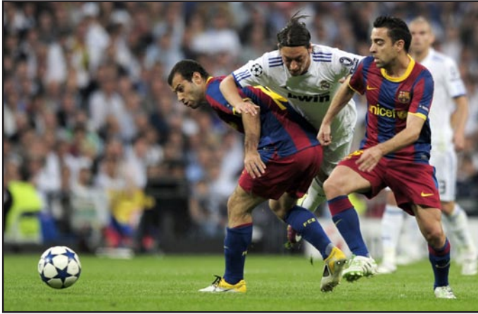
عملاقا إسبانيا يكتسحان الترفلية الأفضل

واندريس انيستا إضافة إلى النجم الأرجنتيني ليونيل ميسي. وضمت التشكيلة قائد المنتخب الألماني ولاعب بايرن ميونخ فيليب لام، إضافة إلى البلجيكي فينست كومباني قائد مانشستر سيتي الإنكليزي، وجاء اللاعب الأخير البرازيلي راميريز نجم وسط تشيلسي الإنكليزي بطل أبطال أوروبا.