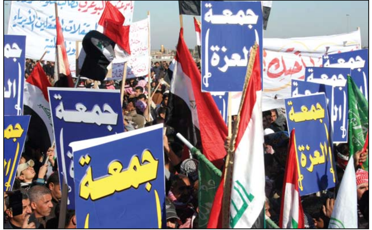
جانب من مظاهرات الرمادي التي عرفت بجمعة العزة أمس..