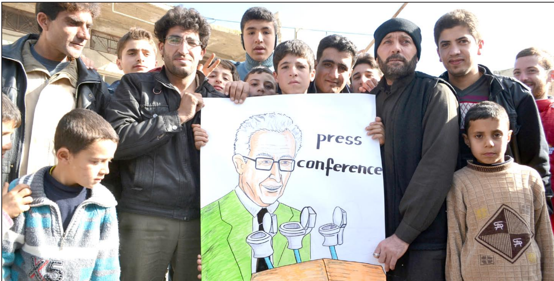
سوريون معارضون يحملون لافتة للمبعوث الدولي للسلام الأخضر الإبراهيمي في أثناء مظاهرة ضد الرئيس بشار الأسد