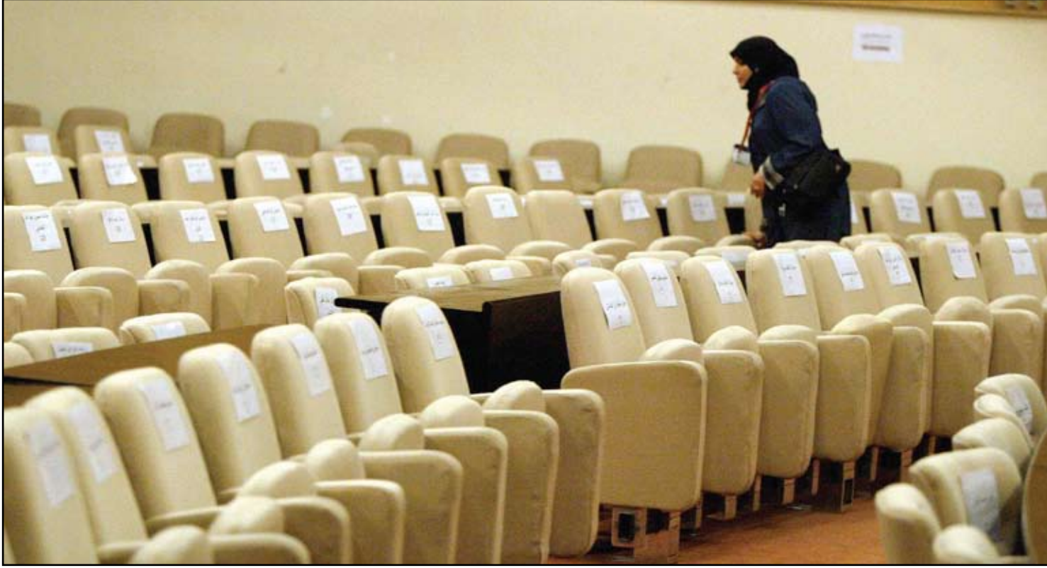
مجلس النواب.. (أرشيف)

وتابع ان "قضية حل البرلمان والتوجه الى انتخابات مبكرة امر غير ممكن لان