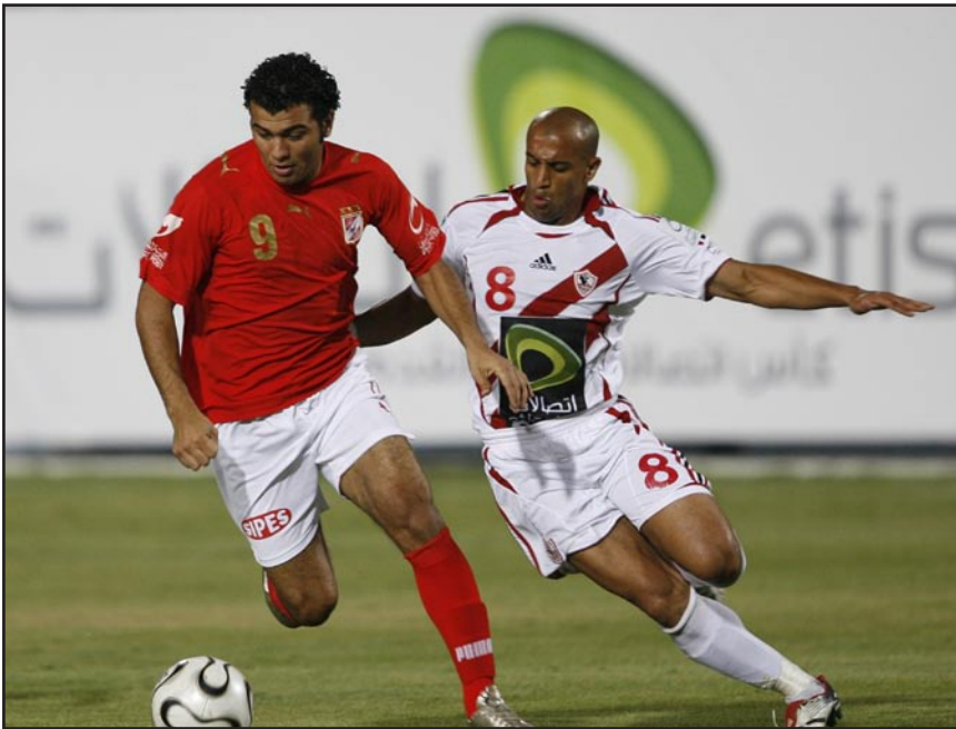
دوري الكرة المصري يتربط انطلاقاً

وأشار إلى أن الاتحاد المصري لكرة القدم أرسل خطاباً إلى جميع أندية الدوري المصري لإخطارها بعدم تلقي اتحاد الكرة أي موافقات أمنية سوى للنادي الإسماعيلي بالموافقة على اللعب بلعب السويس، عدا مباريات الأهلي والزمالك مع الإسماعيلي.