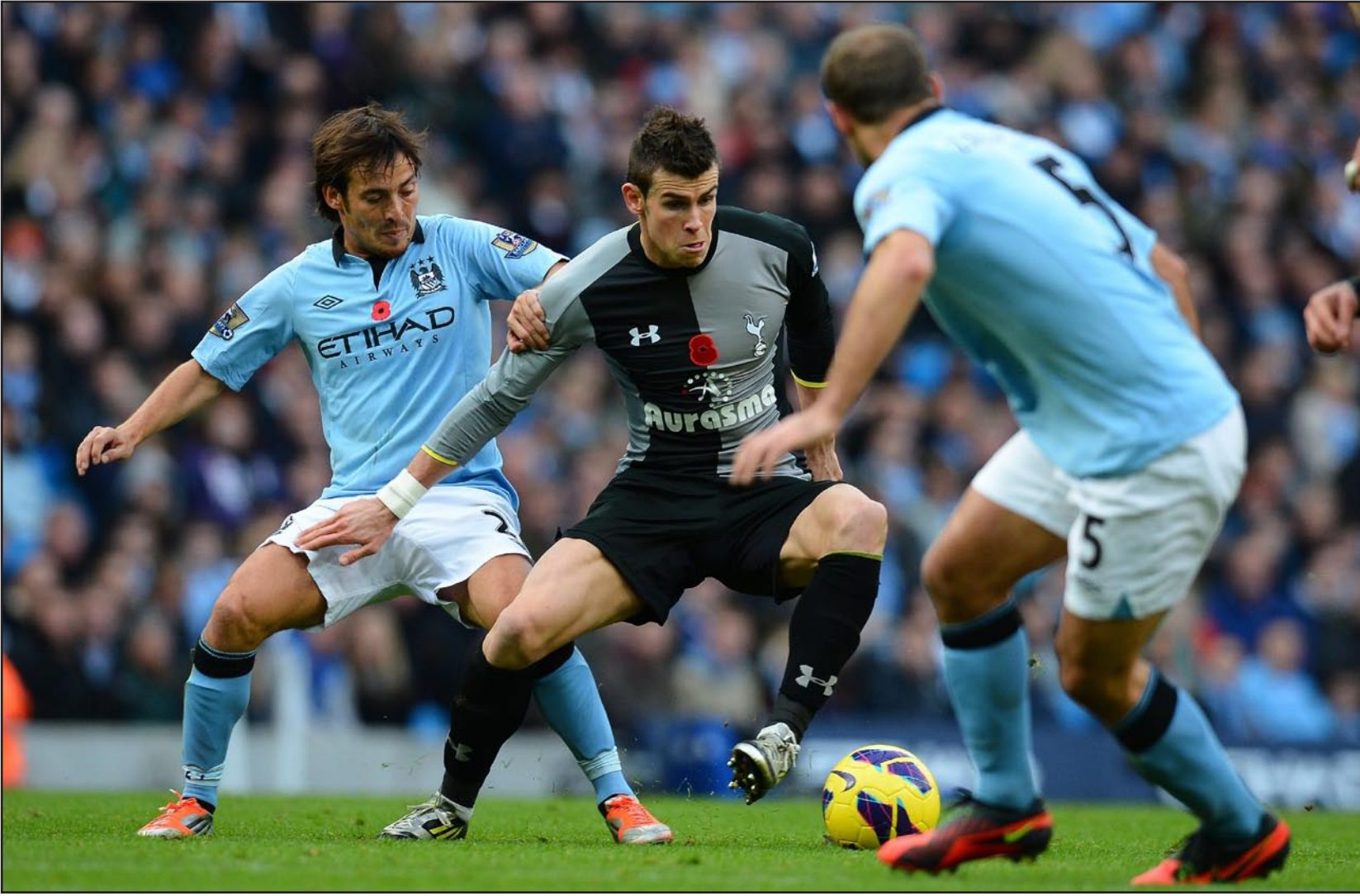
نكته الكرة الإسبانية تلغى على دوري الكرة الإنكليزي

يعرف الدانماركي ميكائيل لودروب مدرب فريق سوانسي الإنكليزي طينة اللاعبين الإسبان جيداً فقد خبرهم لاعباً ومدرباً وفي عصرين مختلفين. لذلك لم يحتج مدرب ريال مايوركا السابق لكثير من التفكير حين استقدم معه من الليغا ميتشو، فالأخير ظهرت موهبته بشكل واضح