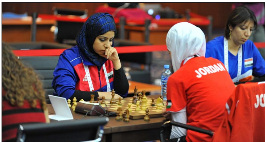
اتحاد الشطرنج يسعى لقاعدة متينة لوامه اللعبة