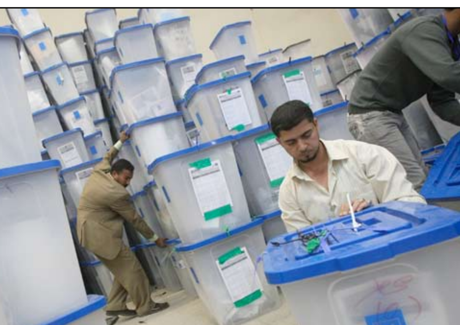
الانتخابات السابقة.. (أرشيف)