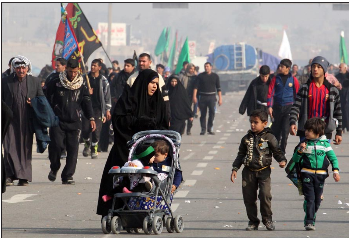
ملايين الزوار في أربعينية الإمام الحسين (عليه السلام)..... أ.ب.

قالت الشرطة المحلية في بابل، الخميس، إن عدداً من القتلى والمصابين سقط في هجوم بسيارة ملغومة استهدف زواراً شمالي المحافظة. وكان الزوار عائدتين من مدينة كربلاء حيث أكملوا زيارة أربعينية الإمام الحسين وسط إجراءات أمنية مشددة وبدعم جوي. وقال ضابط في الشرطة "سقط العديد من الشهداء والجرحى بفعل تفجير إرهابي بسيارة مفخخة في قضاء المسبب شمالي بابل. وأضاف الضابط الذي طلب عدم نشر اسمه "التفجير استهدف موكباً كان عائداً من كربلاء المقدسة. الزوار كانوا عائدتين لبيوتهم".