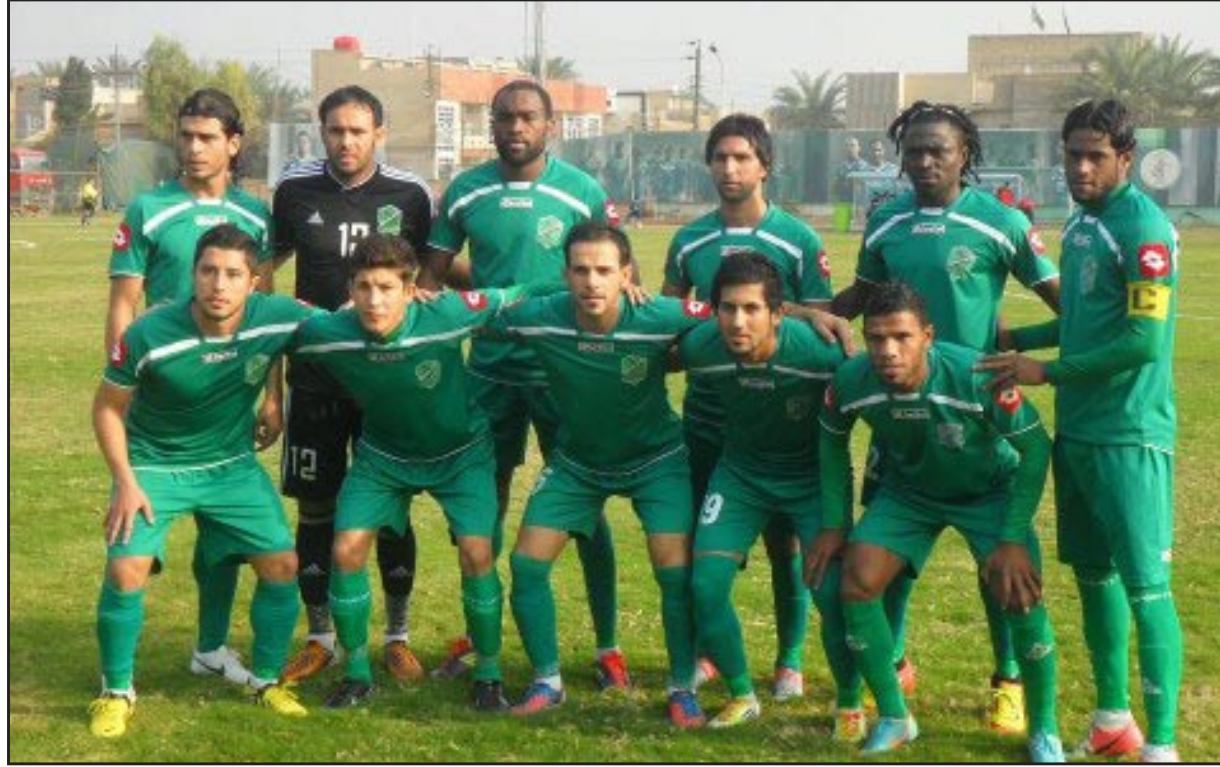
فريق الشرطة .. اصرار على خطف اللقب

الكروات وتمويل المهاجمين بها بأسلوب فني رائع يخلق الفرصة في اي وقت ، ولا يخفى ايضا ان خط دفاع الشرطة لهذا الموسم يتواجد فيه لاعبين ذوي مستوى عال يتزعمهم الفرنسي فليكس ، اما في حراسة المرمى فهناك مجموعة من الحراس الدوليين الذين اشاد بهم جميع النقاد والمحليين على مستوى العراق . وقال كريم: ان ادارة النادي جادة في مساعها