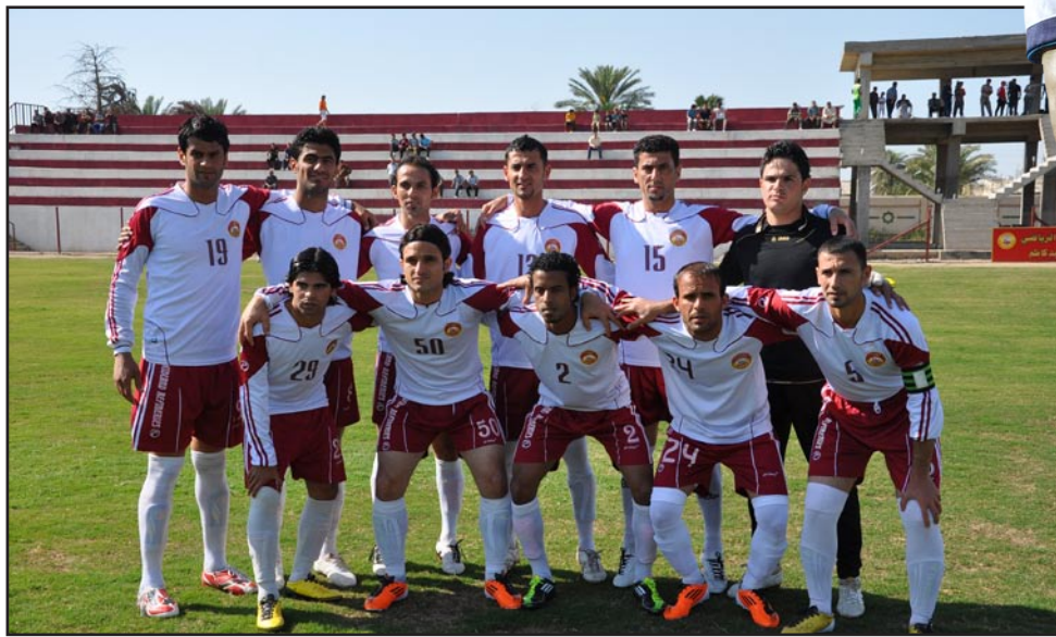
فريق المصافي التطلع للتواجد بقوة هذا الموسم

منافسات خليجي ٢١ ، مشدداً على ان فرقه سيكون رقماً صعباً خلال منافسات الموسم الحالي . وقال محمد ل(المدى) اننا نسعى جاهدين من اجل مواصلة المشوار بنجاح بعد ان تمكن فريقنا من احتلال المركز السادس برصيد ١٤ نقطة وبفارق ضئيل عن فرق المقدمة بكل جدارة بفضل القيادة النموذجية للمدرب الفدير حمزة داود الذي أكد علو كعبه في مجال التدريب بعد ان