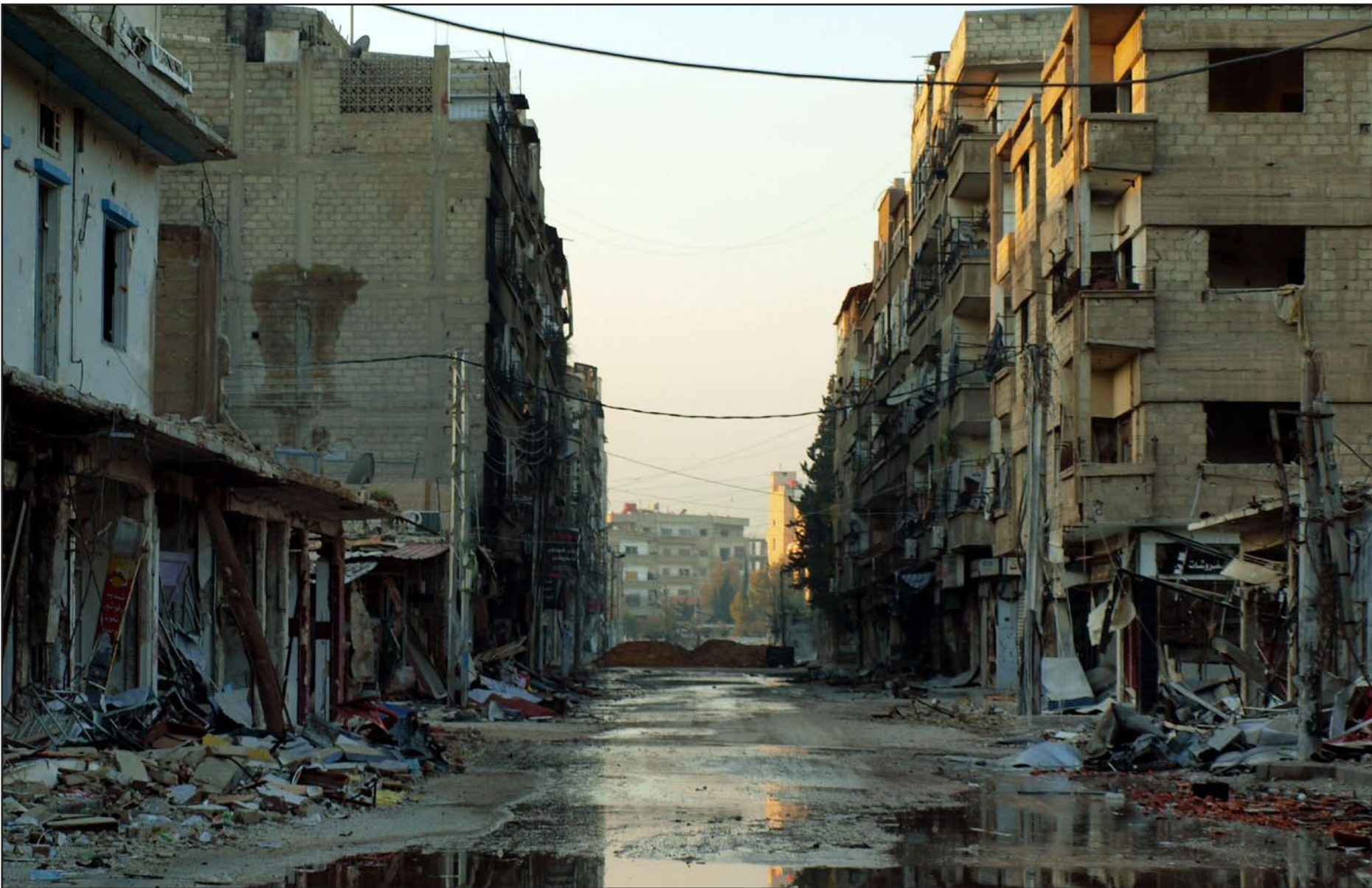
آثار الخراب والدمار في المدن السورية (ا ف ب)

وأطلقت الطائرة بواسطة اليد ثم دفعها محرك كهربائي، ويمكنها أن تحلق بسرعة تصل إلى ٩٥ كم في الساعة طوال ٨٠ دقيقة في شعاع عملائي من عشرة كيلومترات، وأدى الأميرال رستيغاري بهذا الإعلان في ختام مناورات بحرية في منطقة الخليج ومضيق هرمز وبحر عُمان استمرت ستة أيام.