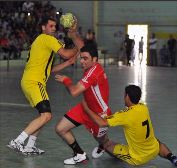
لقطة من دوري كرة اليد الممتاز

افتتح الموسم الموصل وكربلاء على قاعة نادي الموصل ، في الوقت الذي يضيف فيه فريق نفط الجنوب فريق الشرطة على قاعة البصرة .