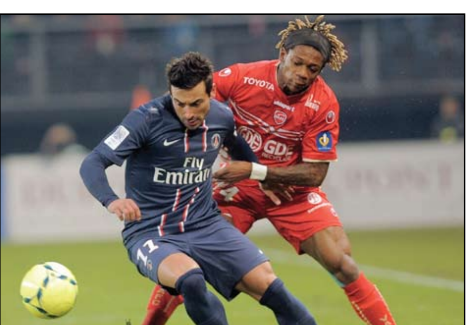
سان جيرمان يسحق تولوز بالاربعية

إكمال اللقاء بعشرة لاعبين منذ الدقيقة ٤٠ بعد حصول السنغالي شيخ مبينتي على إنذار ثان. واصل سان جيرمان أداءه الرائع خلال الفترة الثانية فأسدرك الهدف الثالث عبر رأسية ساكو بعد كرة عرضية أخرى من فان دير فيل (٧٠)، ثم سرعان ما أضاف الضيوف الهدف الرابع عبر الهولندي، الذي دون أول أهدافه مع الفريق العاصمي بعد استفادته من مجهود فردي مميز لإبراهيموفيتش (٧٢). وقدم زملاء السويدي إبراهيم مبرودا مميّزا في هذه المواجهة مؤكدين إصرارهم بالهضي قدما نحو لقب الدوري الفرنسي.