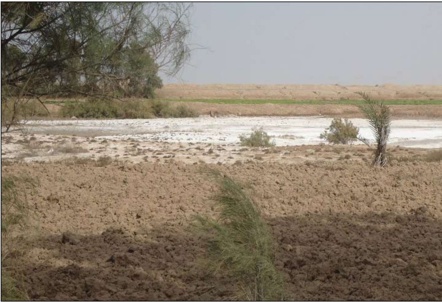
اراضي البصرة تملؤها الأملاح

وأخيراً وليس أخراً المشكلة التي فجرتها لنا ذي قار حين غسلت مياه أهوارها لتطلق لنا كميات هائلة من (الغسالة) المالحة لتغمر أهوار البصرة، ولتصل إلى شط العرب وتحرق لنا مساحات كبيرة في مناطق شمال المحافظة هذه المرة.