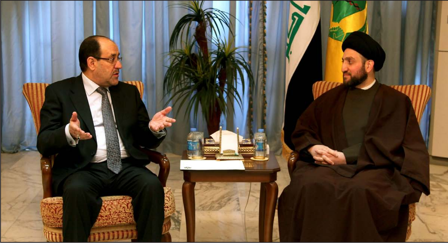
المالكي مع الحكيم في لقاء سابق..

أكد رئيس الحكومة نوري المالكي أن تطور الأحداث بشكل "غير إيجابي لا يخدم أحداً"، داعياً الجميع إلى الحوار لحل الأزمة الحالية، فيما دعا رئيس المجلس الأعلى الإسلامي عمار الحكيم كتلة العراقية إلى "العودة لمجلس النواب لتلبية مطالب المتظاهرين"، وأشار إلى أن المالكي أبدى استعدادة لحل "المشاكل" مع إقليم كردستان.