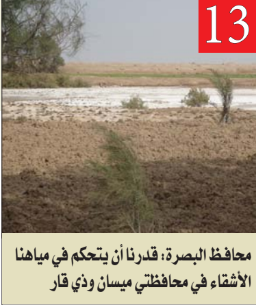
محافظ البصرة: قدرنا أن يتحكم في مياها الأشياء في محافظتي ميسان وذي قار