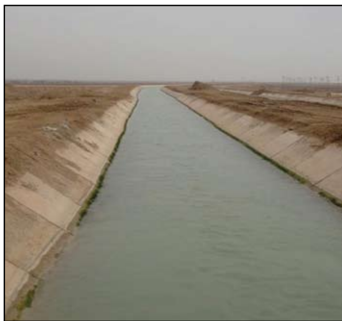
خزانات مياه في البصرة