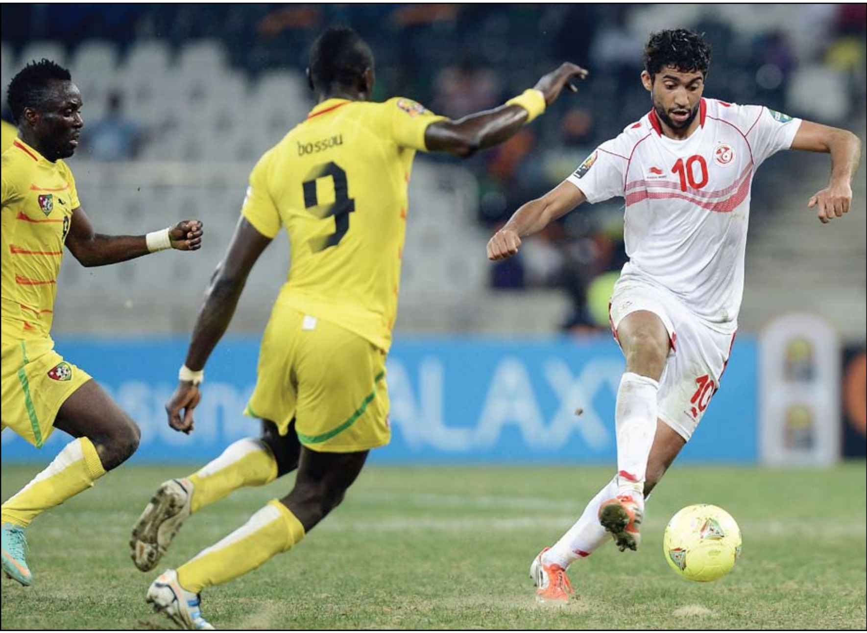
تونس خيبت آمال العرب أمام توغو

استدعى مدرب المنتخب الإسباني فيسنتي دل بوسكي تشكيلة من ٢١ لاعبا لمواجهة الأوروغواي وديا في السادس من الشهر الحالي، وضمت للمرة الأولى إسمي نجم ملقا فرانسيسكو إيسكو ومدافع تشيلسي الإنجليزي سيزار أسبيليكويتا، إلا أن أبطال العالم وأوروبا سيخوضون مواجهتهم المقررة في العاصمة القطرية الدوحة مع أبطال كوبا أميركا لعام ٢٠١١ بغياب مهاجم تشيلسي فرناندو توريس، الذي استبعده دل بوسكي عن التشكيلة. في المقابل، سيسجل إيسكو (٢٠ عاما) بدايته مع "لا فوريا روخا" بفضل الأداء المميز الذي يقدمه مع ملقا هذا الموسم، فيما استدعى الظهير الأيسر أسبيليكويتا بعد أن فرض نفسه من العناصر الأساسية