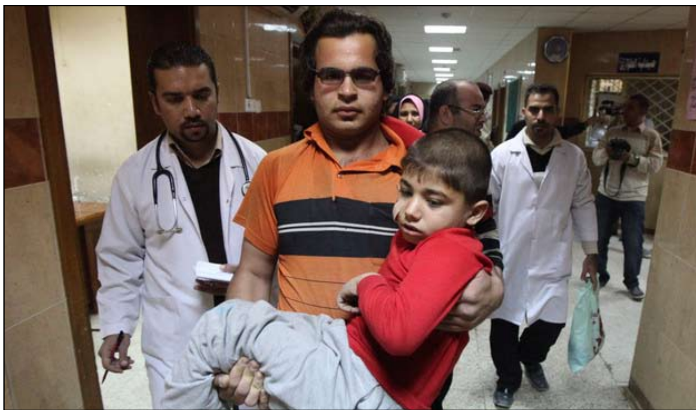
شاب يحمل اخاه في ردهة طوارئ مستشفى مدينة الصدر

فيما أكدت حركة أهل الحق (عصائب أهل الحق)، الثلاثاء (٢٩ كانون الثاني ٢٠١٢)، أن المجموعة المسلحة التي هاجمت مستشفى الإمام علي في مدينة الصدر لا تنتمي إليها، وتشدت على أي جهة التي قامت بهذه الحادثة "معروفة للجميع من دون إيضاح، لالاقية إلى أنها شكلت وقد الزيارة المستشفى وتبرئة موقفها . فيما أكدت حركة أهل الحق (عصائب أهل الحق)، "المنشق" فاضل الوافي تهديده للمستشفى كما تقول مصادر طبية تعمل فيه، وتؤكد المصادر أن "ورقة بدون توقيع وصلت إلى المستشفى تحمل كلمة (راجعيكم)، أثارَت الرعب بين صفوف الكادر ، الذي يبدو أنه يصارع وحيدا .