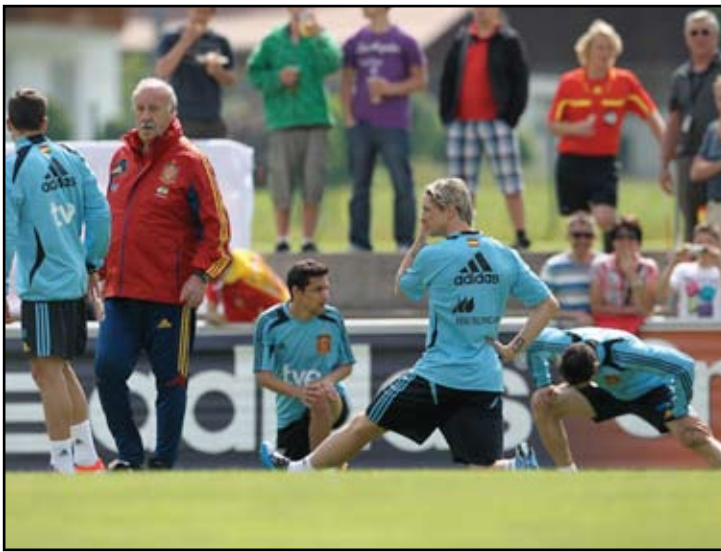
تورييس خارج توليفة دل بوسكي

في تشكيلة الـ "بلوز". وعاد إلى التشكيلة قائد ومدافع برشلونة كارليس بويول بعد أن حرّمته إصابة في كتفه من المشاركة في المباراة الأخيرة لمنتخب بلاده في ٢٠١٢، وبالتالي سيتمكن من خوض مباراته الـ ١٠٠ بقميص أبطال العالم. كما ضمت التشكيلة ناتشو مونريال الذي استدعى إلى المنتخب بعد يوم على انتقاله من ملقا إلى أرسنال الإنجليزي. ولن يكون تورييس الغائب الوحيد عن التشكيلة، إذ استبعد دل بوسكي مهاجم فالنسيا روبرتو سولدادو، فيما يغيب الحارس والقائد إيكر كاسياس بسبب الإصابة. وستكون المباراة الودية ضد الأوروغواي ضمن تحضيرات إسبانيا لمباراتي الشهر المقبل ضد فنلندا وفرنسا في تصفيات مونديال البرازيل ٢٠١٤.