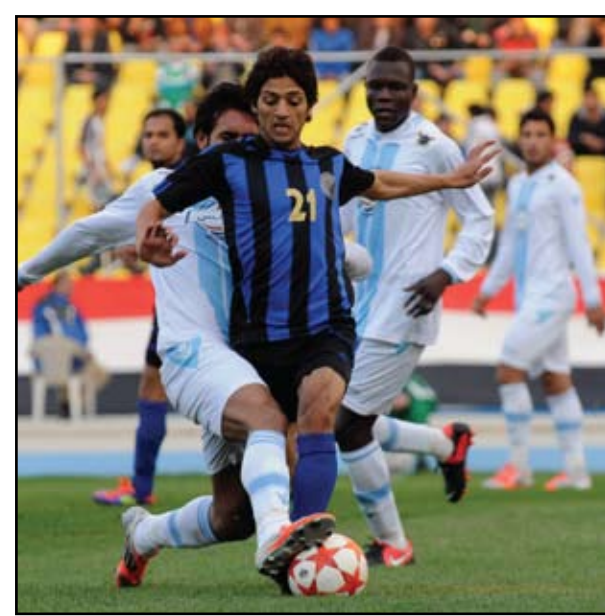
الطلبة يخفق في اجتياز الجوية