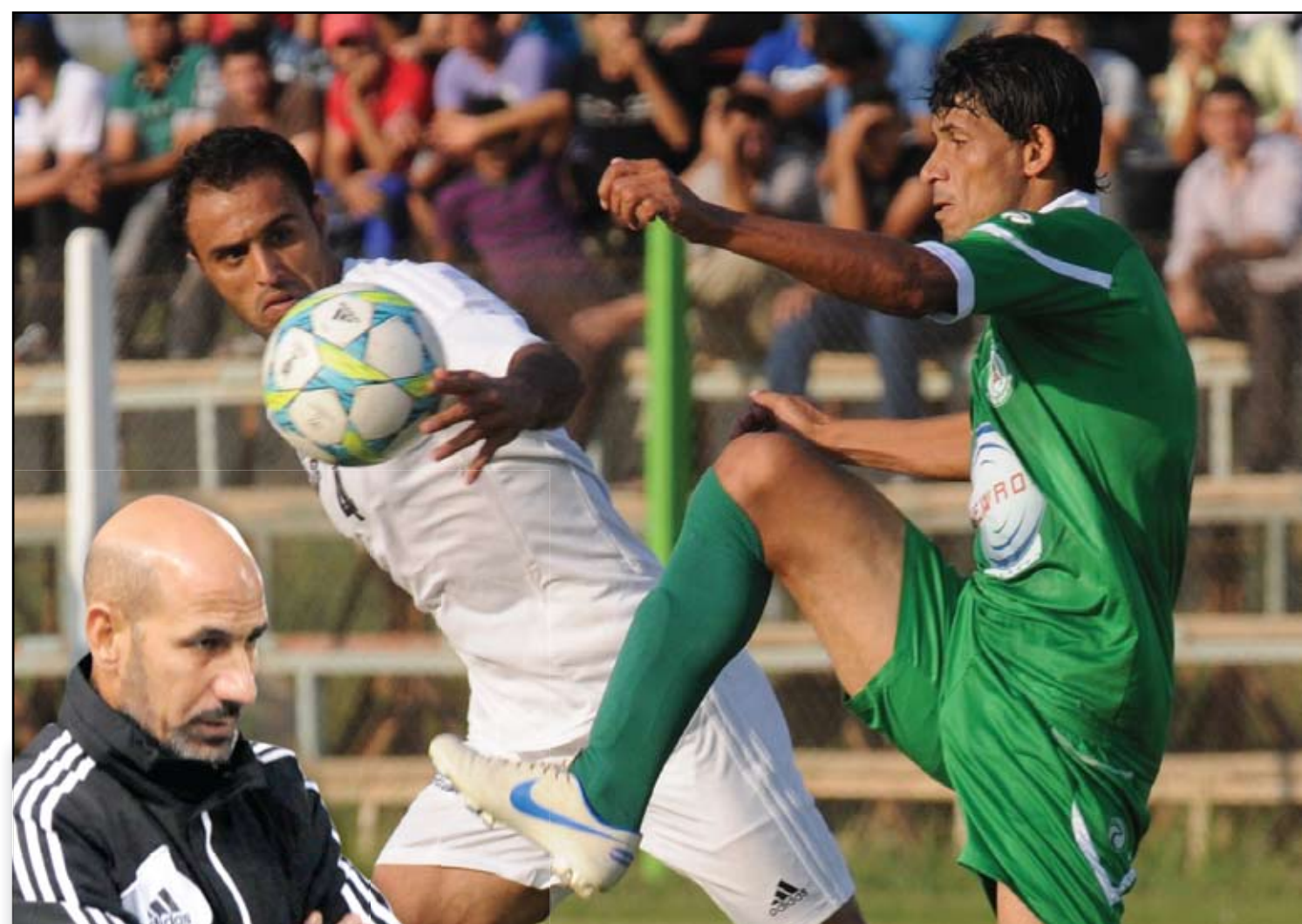
الزوراء يعد بمستوى أفضل في المرحلة الثانية

الزوراء يعد بمستوى أفضل في المرحلة الثانية المرحتين الأولى والثانية سنحتاج بعض اللاعبين لتعزيز صفوف الفريق، حيث سنكون بحاجة من ثلاثة إلى أربعة لاعبين حتى نستطيع أن نظهر بصورة مختلفة في المرحلة الثانية عن الصورة التي ظهرنا بها في المرحلة الأولى، برغم أننا في الأدوار الأخيرة لسنا تطوراً ملحوظاً في مستوى ونتائج الفريق.