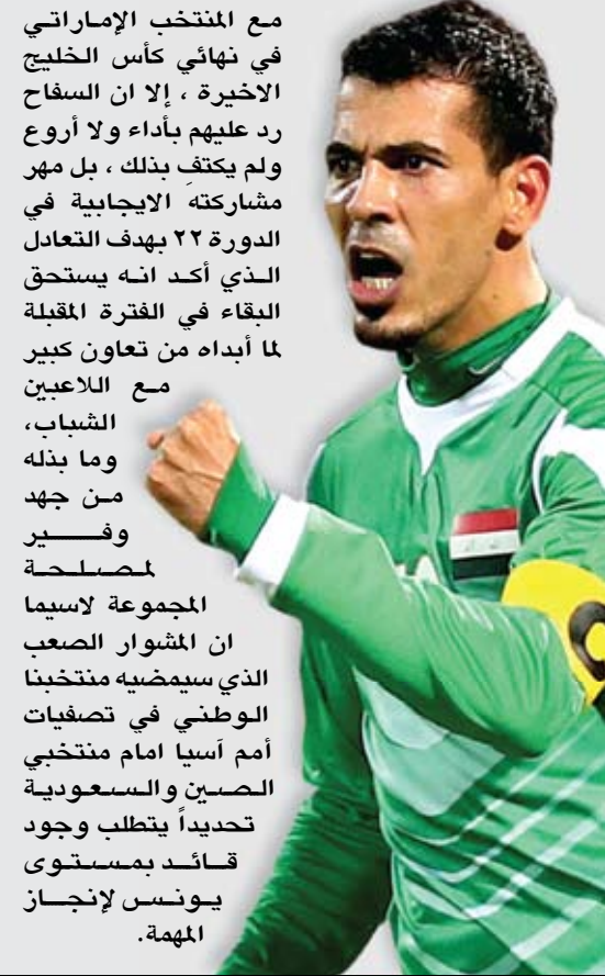
السفاح يُخرس منتقديه

بالرغم من الحملات الشعواء التي قادها بعض الصحفيين