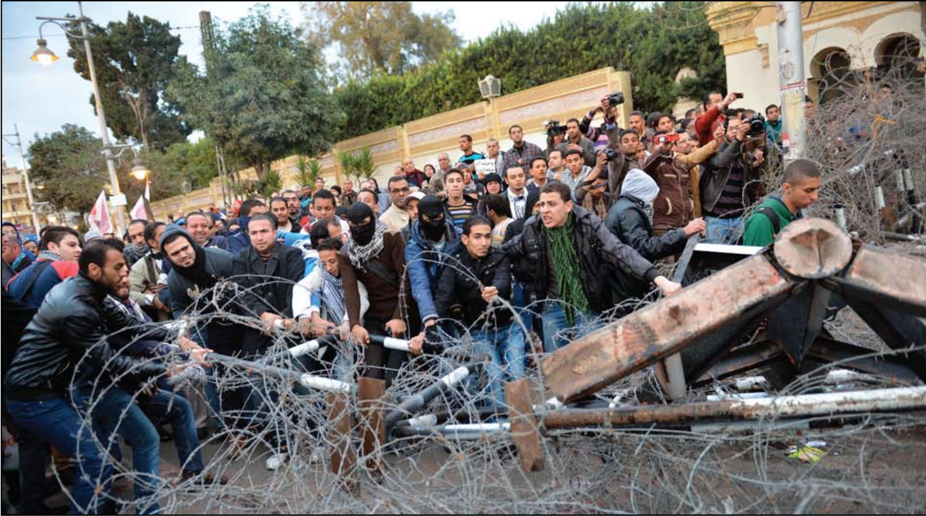
المتحجون المصريون يحاولون إزالة الأسلاك الشائكة أثناء مظاهرة أمس قرب قصر الرئاسة