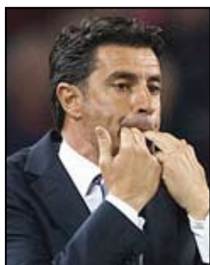
خوسيه ميغيل جونايس

■ سيقتقد أرسنال الانكليزي خدمات مدافعه كيران غيبس بين اربعة وستة اسابيع بسبب اصابة في فخذه، وذلك بحسب ما أعلن مدربه الفرنسي أرسين فينغر. وأصيب غيبس خلال مباراة امام ليفربول (٢-٢) في الدوري المحلي، وسيتمكن ارسنال من سد فراغه بعد ان تعاهد مع الاسباني ناتشو مونريال من ملقا لكن ليس بإمكان فريق "المدفعية" الاعتماد على لاعبه الجديد في مسابقة دوري ابطال أوروبا بسبب مشاركته فيها هذا الموسم مع فريقه السابق.