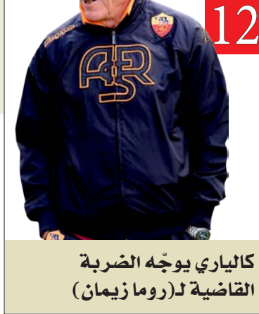
كالياري يوجّه الضربة القاضية لـ(روما زيمان)