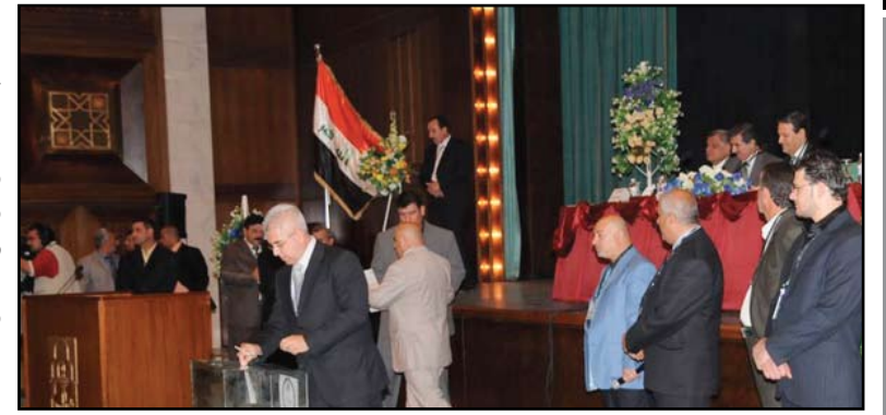
جانب من المؤتمر الانتخابي السابق

قررت اللجنة الاولمبية العراقية إجراء انتخابات مكتبها التنفيذي في ٢٨ آذار المقبل وفق اللوائح والانظمة التي يحددها المجلس الاولمبي الآسيوي واللجنة الاولمبية الدولية. وقال رئيس اللجنة الاولمبية العراقية رعد حمودي ان "انتخابات المكتب التنفيذي ستجري في ٢٨ آذار المقبل وفق اللوائح والانظمة التي يقرها المجلس الاولمبي الآسيوي واللجنة الاولمبية الدولية". و اضاف حمودي "تفرض اي تدخل في