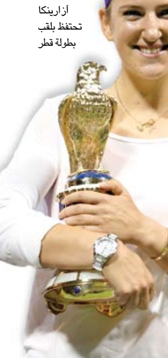
أزاريكا احتفظ بلقب بطولة قطر

وعبّر مدرب بورتو فيتور بيريرا عن رضاه على أداء فريقه : كان فوزاً مطمئناً، سجلنا هدفين وكنا قادرين على إضافة هدفين من دون أن نسمع للخصم بأية فرصة، وهذا اللقاء الأول بين الفريقين على الصعيد القاري.