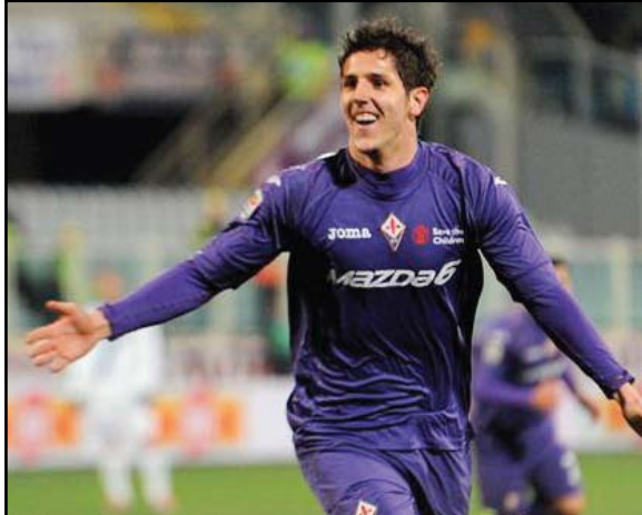
هزيمة مذلّة ميلان أمام فيورنتينا

وفاز جنوى على ضيفه أودينيزي بهدف نظيف سجله يوراي كوشكا في الدقيقة ٣٣، ورفع جنوى رصيده إلى ٢٥ نقطة في المركز السابع عشر بينما تجدد رصيده أودينيزي عند ٣٦ نقطة