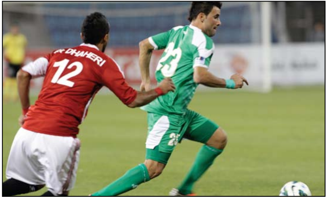
المنتخب الوطني في أزمق الشباب وشاكر

الأحداث المتلاحقة والمتصلة بقضية تسمية مدرب جديد لمنتخبنا الوطني خلفاً للمدرب حكيم شاكر الذي كما يبدو تبلورت لديه قناعات عدة بضرورة العودة الى منتخبه الشبابي ومواصله ما حققه معه بالوصول الى مونديال تركيا. هذه الأحداث جعلت قضية المدرب الجديد تقفز الى الواجهة مع اقتراب موعد مبارياتنا الثانية في تصفيات آسيا ٢٠١٥. وإذا كان هناك نجاح قد تحقّق للاعبين الشباب مع المنتخب الأول سواء في بطولة غرب آسيا أو خليجي ٢١ فإن أحد مقومات ذلك النجاح تعود الى التفرد الكامل الذي مرّ به المنتخب الشبابي بعد نهائيات آسيا في الإمارات وحصولنا على المركز الثاني والحال ذاته بالنسبة للجهاز التدريبي بقيادة المدرب حكيم شاكر الذي وجد نفسه أيضاً متمكناً من انجاز المهمة بعد ان كلّف من قبل الاتحاد العراقي لأنه كان متفرغاً أيضاً مع منتخبه الشبابي وسارت الامور مع الطرفين بشكل جيد لاعبين ومدرب