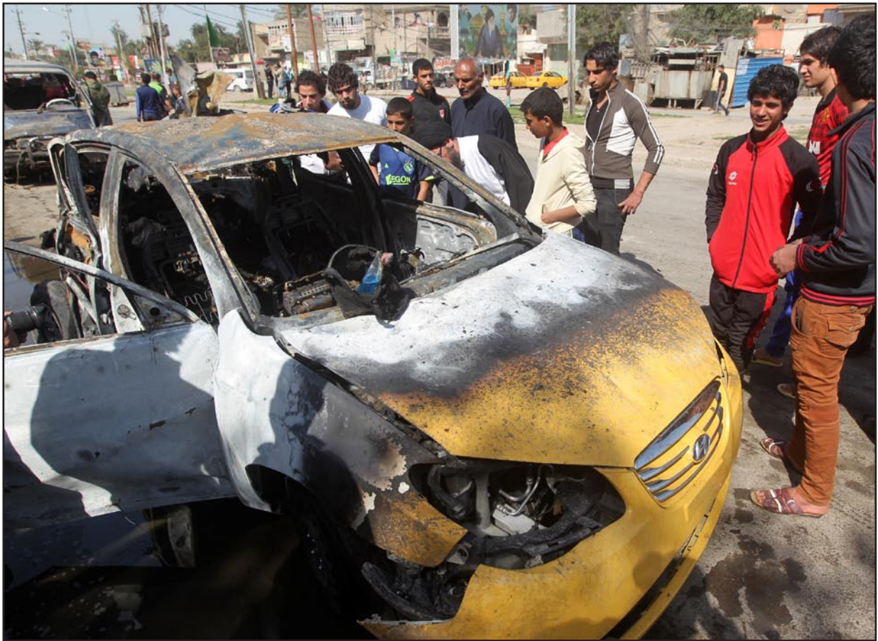
أحد التفجيرات التي ضربت بغداد أمس الأول..

وأضاف أن وتيرة التهديدات بين القوى الكبيرة تتصاعد إلى درجة باتت تهدد وحدة العراق وأمن أبنائه وأمانهم، وما التفجيرات