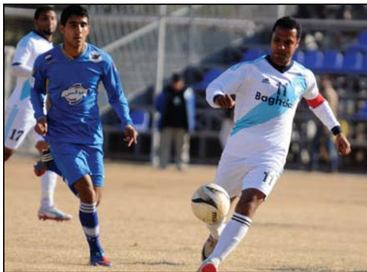
جولة صعبة للشرطة امام بغداد المتأثر

ويحاول المدرب نادر احمد ان يستغل غياب زاخو عن هذه الجولة لتأجيل لقائه مع الجوية الى جانب خسارة كربلاء الاخيرة