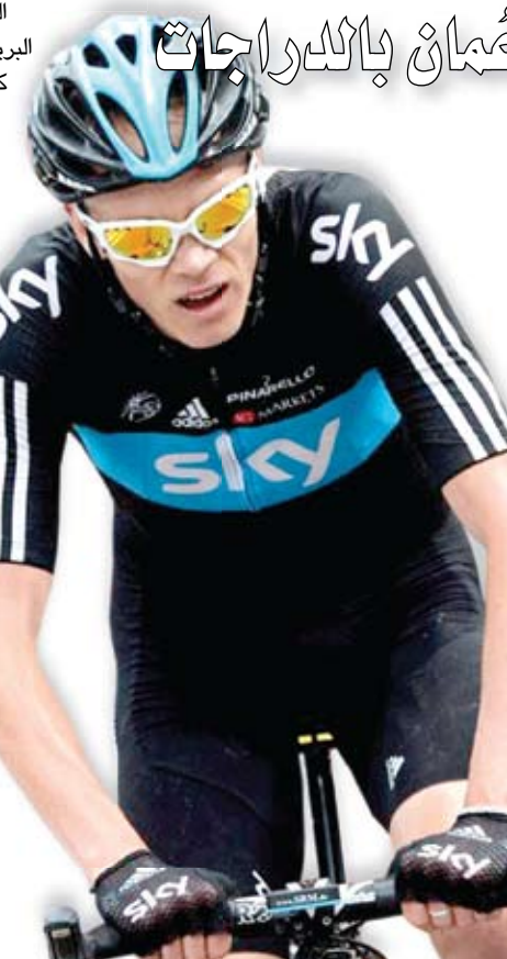
الدرج البريطاني كريس فروم