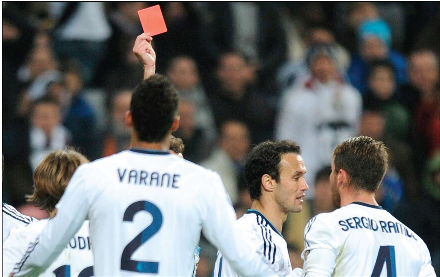
راموس ثال اندارين خلال دقيقتين وخرج من المباراة

ومع بداية الشوط الثاني بدأ ريال مدريد مهاجماً يرغم الحارس العددي الأخير من الشوط الأول بعدما أطلق كذيفة صاروخية مرت بالكاد من فوق العارضة، ولم يحدث أي جديد في الشوط الأول ليخرج ريال مدريد متقدماً بهدفين نظيفين.