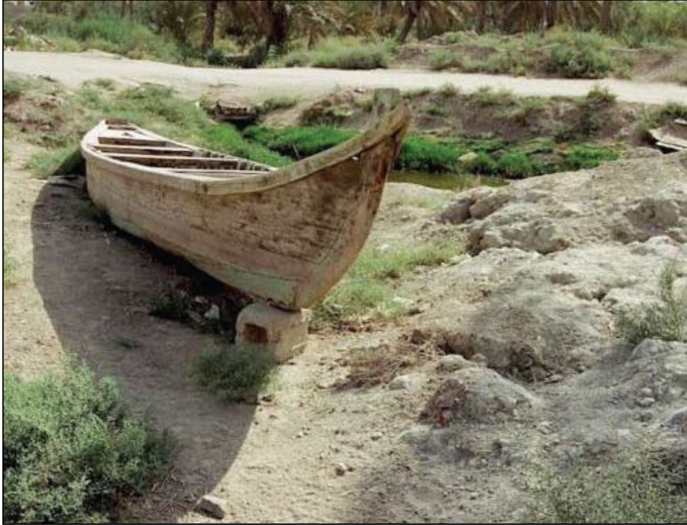
قارب على نهر تعرض للجفاف