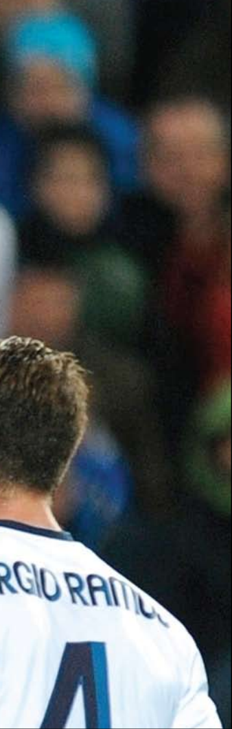
راموس ثال اندارين خلال دقيقتين وخرج من المباراة

المباراة أي جديد ليحصد ريال مدريد أرضية ملعب سانتياغو برنابيو. وأهدر كاكّا فرصة هدف محقق لريال مدريد في الدقيقة ٧٣ بعدما انفرد تماماً بمرمي روين مارتنيز ولكنه فشل في التسجيل وهو على بعد سنتيمترات من المرمى الخالي.