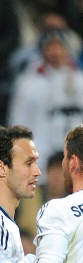
راموس ثال اندارين خلال دقيقتين وخرج من المباراة

المباراة أي جديد ليحصد ريال مدريد أرضية ملعب سانتياغو برنابيو. وأهدر كاكّا فرصة هدف محقق لريال مدريد في الدقيقة ٧٣ بعدما انفرد تماماً بمرمي روين مارتنيز ولكنه فشل في التسجيل وهو على بعد سنتيمترات من المرمى الخالي.