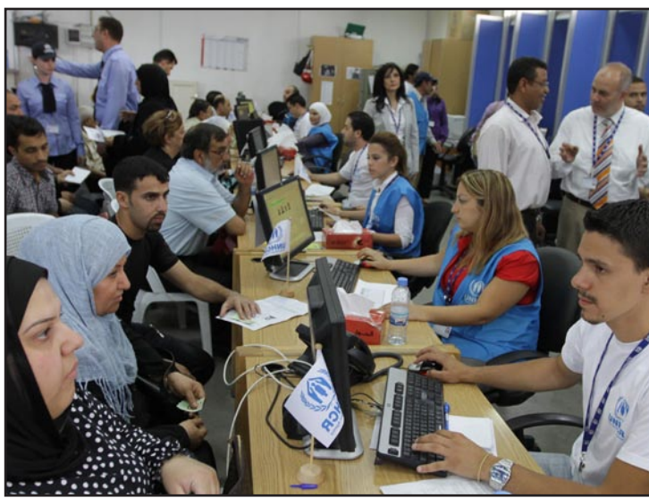
اللاجئون العراقيون في الخارج... (أرشيف)

ابلغت وكيل وزارة الخارجية الهولندية رينيه جونز بوس، البرلمان أمس عزم حكومتها إعادة ١٥ الف عراقي من طالبي اللجوء لديها إلى العراق، وكشفت عن وجود ما يقارب من ٥٠ الف لاجئ عراقي في بلادها.