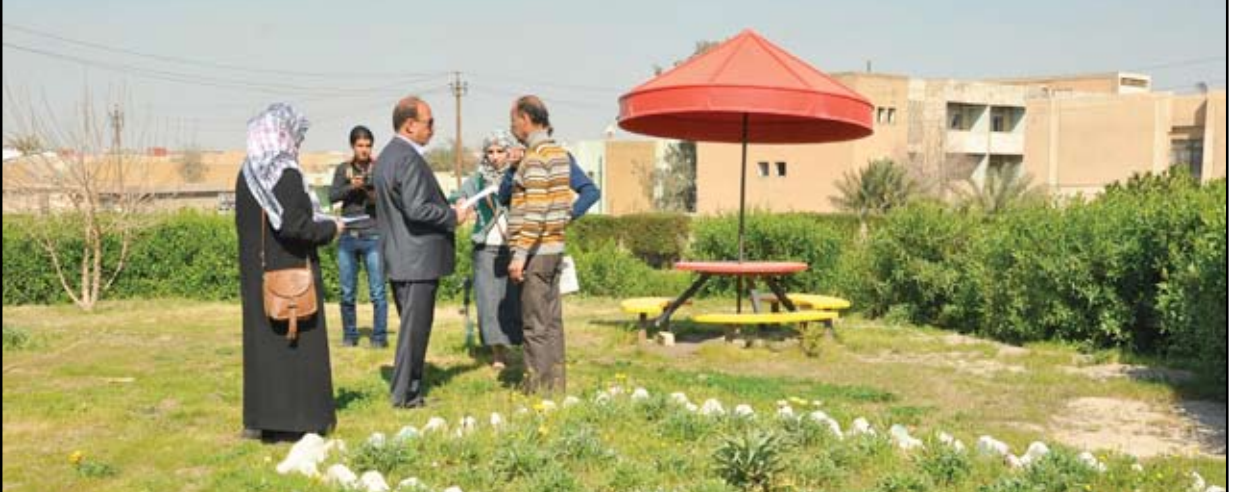
حدايق وخضرة تحيط بالمعلم التراثي

لم يكن بناء سور للمدينة المدورة – بغداد – فكرة جديدة على العراقيين الذين عرفوا أسوار بابل وأسور والحصن، لكن العباسيين الذين بنوا هذا