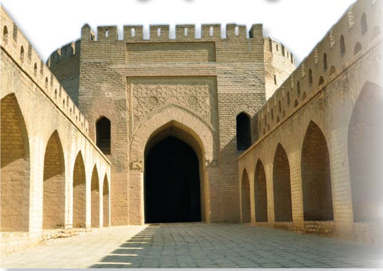
الباب الوسطاني يعيد الف عام من تاريخ بغداد

ينتهي بهم السباق إلى ساحة قريبة من باب المعظم، ويتكون باب المعظم من برج كبير عال اسطواني الشكل تقريبا بني كله من الأجر. عُرض الباب نحو ثلاثة أمتار، يعلوه عقد مدبب منفرج الزاوية، ارتفاعه أربعة أمتار، يقوم العقد المدبب فوق دعاملتين مندمجتين في الجدار، وفي كل جانب من جانبي العقد هناك أسد صغير منحوت من قطع الأجر بشكل بارز، وأشكال هندسية مترابطة بارزة قوامها شريطان، كل منهما مقسوم إلى قسمين يتقاطعان ويكوّنان شكلاً سداسياً منتظماً الأضلاع، فيها عناصر زخرفية هندسية ونباتية، منها أغصان نباتية وفروع نباتية ذات أوراق بشكل أنصاف المراوح النخيلية الثلاثية الفصوص، وتؤلف زخارف التوريق العربي المعروفة بالأرابيسك، أما الأشكال الهندسية المنتظمة فداخل كل منها زهرة الروزيت، وقوام الأشكال الهندسية الخطوط المتداخلة وهي تتشكل طبقاً نجمية ذات اثني عشر رأساً ونجوماً صغيرة ذات أربعة رؤوس تحصر في داخلها نجوماً ذات ثمانية رؤوس، إلى جانب ذلك هناك زخارف دقيقة في داخل النجوم والأشكال الهندسية.