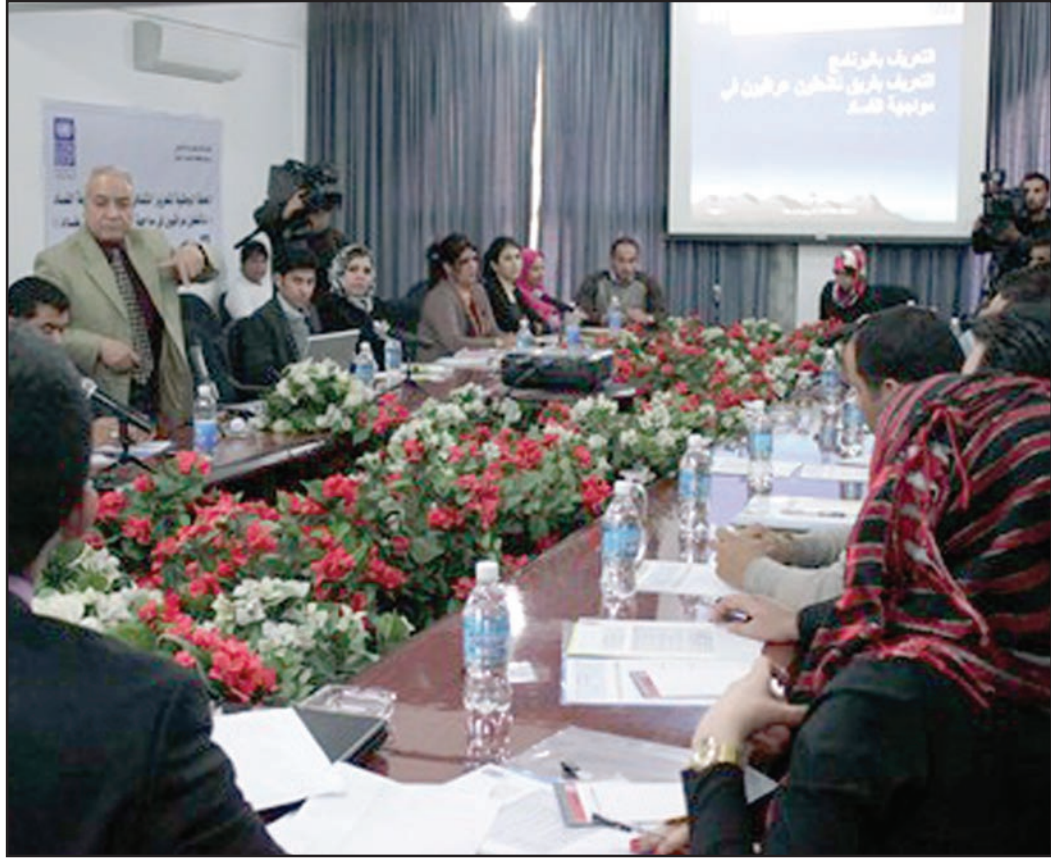
ناشطون مدنيون يناقشون أسباب الفساد في بغداد امس...