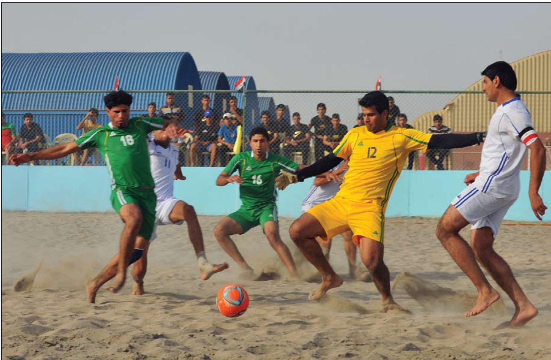
منتخب الشاطئية بعهدته مدرب جديد استعداداً للآسيوية