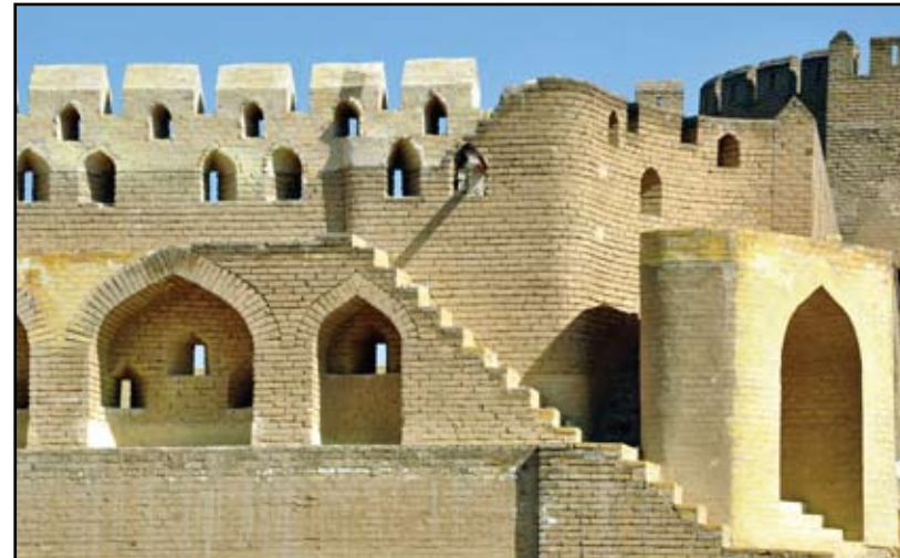
عملية إعادة اعمار