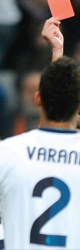
راموس ثال اندارين خلال دقيقتين وخرج من المباراة

وأهدر روبيرتو تراشوراس فرصة هدف محقق لرايو فايكانو في الدقيقة الأخيرة من الشوط الأول بعدما أطلق كذيفة صاروخية مرت بالكاد من فوق العارضة، ولم يحدث أي جديد في الشوط الأول ليخرج ريال مدريد متقدماً بهدفين نظيفين.