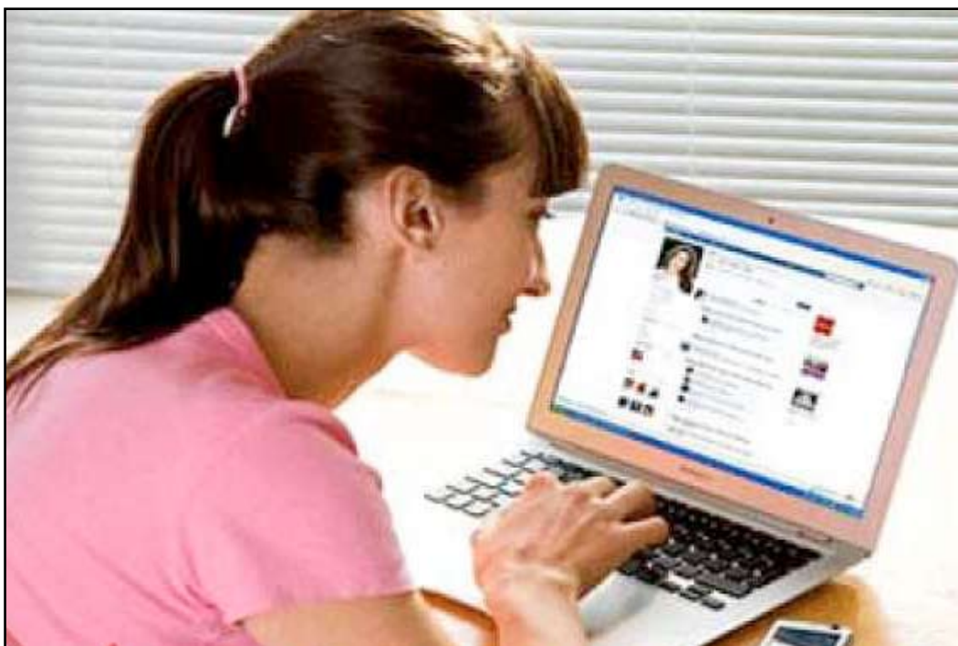
البداية من الدردشة

تعاني بعض الحالات الزوجية نوعاً من الانكسارات العاطفية وعدم الانسجام