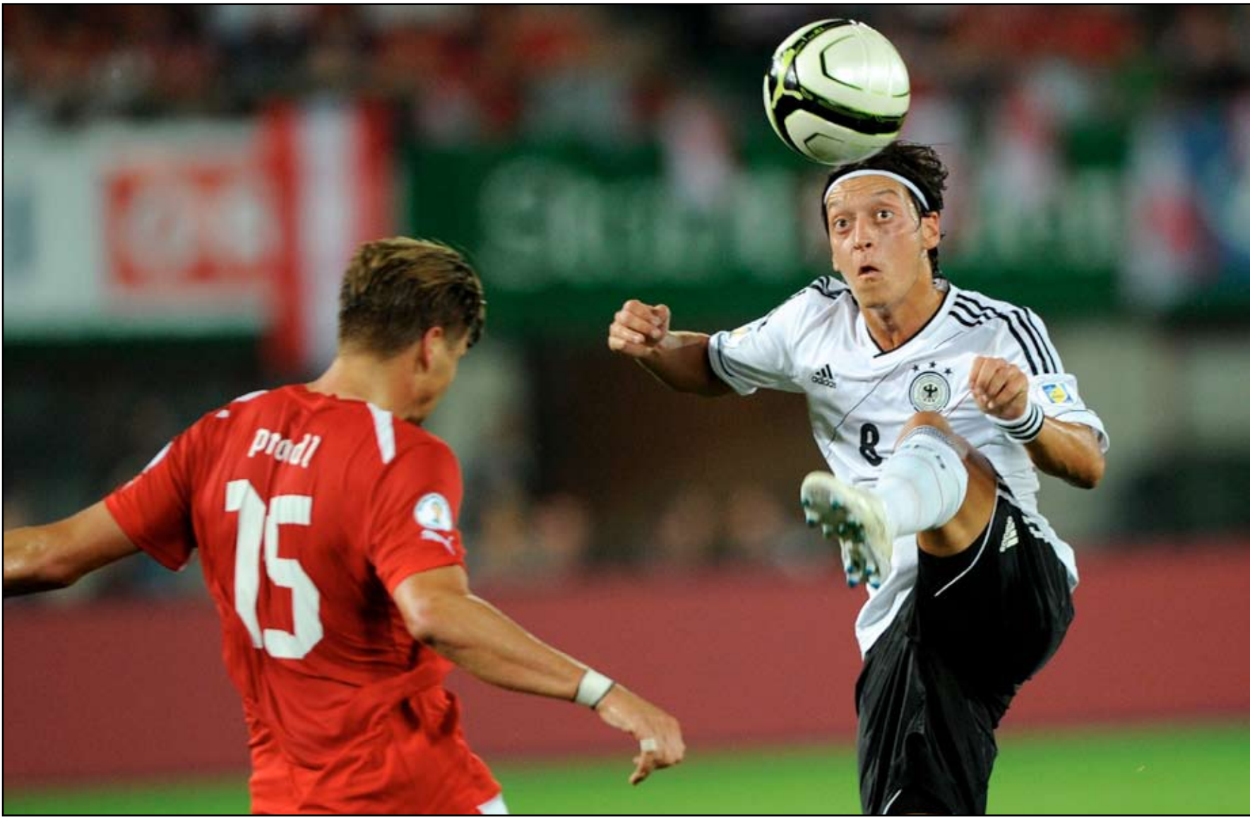
احدى مباريات المنتخب الالمانى

لدينا أربع مباريات سنخوضها ويجب أن نواصل كفأحنا. ما زالت أمامنا العديد من النقاط لننافس عليها".