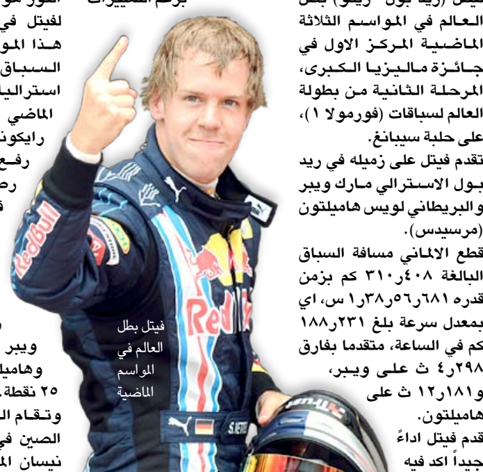
فيتل بطل العالم في الموسم الماضي

كوالالمبور/ أف ب تفوقه كما حصل في التجارب الرسمية فانطلق من المركز الاول وحافظ على تركيزه برغم التغييرات التي شهدتها السباق بسبب تبديل الاطارات الى ان خرج بالمركز الاول. الفوز هو السابع والعشرون لفيتل في مسيرته، والاول هذا الموسم بعد ان ذهب السباق الاول في جائزة استراليا الكبرى الاسبوع الماضي الى الفنلندي كيمي رايكونن. رفع السائق الألماني رصيده الى ٤٠ نقطة في صدارة الترتيب بعد ان كان قد حل ثالثاً في السباق الاول من الموسم، بفارق ٩ نقاط عن رايكونن، ويأتي ويبر ثالثاً وله ٢٦ نقطة، وهاميلتون رابعا برصيد ٢٥ نقطة. وتقام الجولة الثالثة في الصين في الرابع عشر من نيسان المقبل.