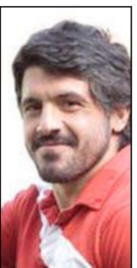
النجم الإيطالي غاتوزو

بهذا المستوى. وعبر غاتوزو (٣٥ سنة) عن رغبته في العودة يوما ما لسان سيريو لكن مدربا لفريق ميلان وأضاف: لو عدت هنا سيعني ذلك أنني قمت بعمل جيد كمدرّب رفقة فريق، لكن في الوقت الحالي لا أعتقد أنني في وضع يسمح لي بتدريب ميلان.