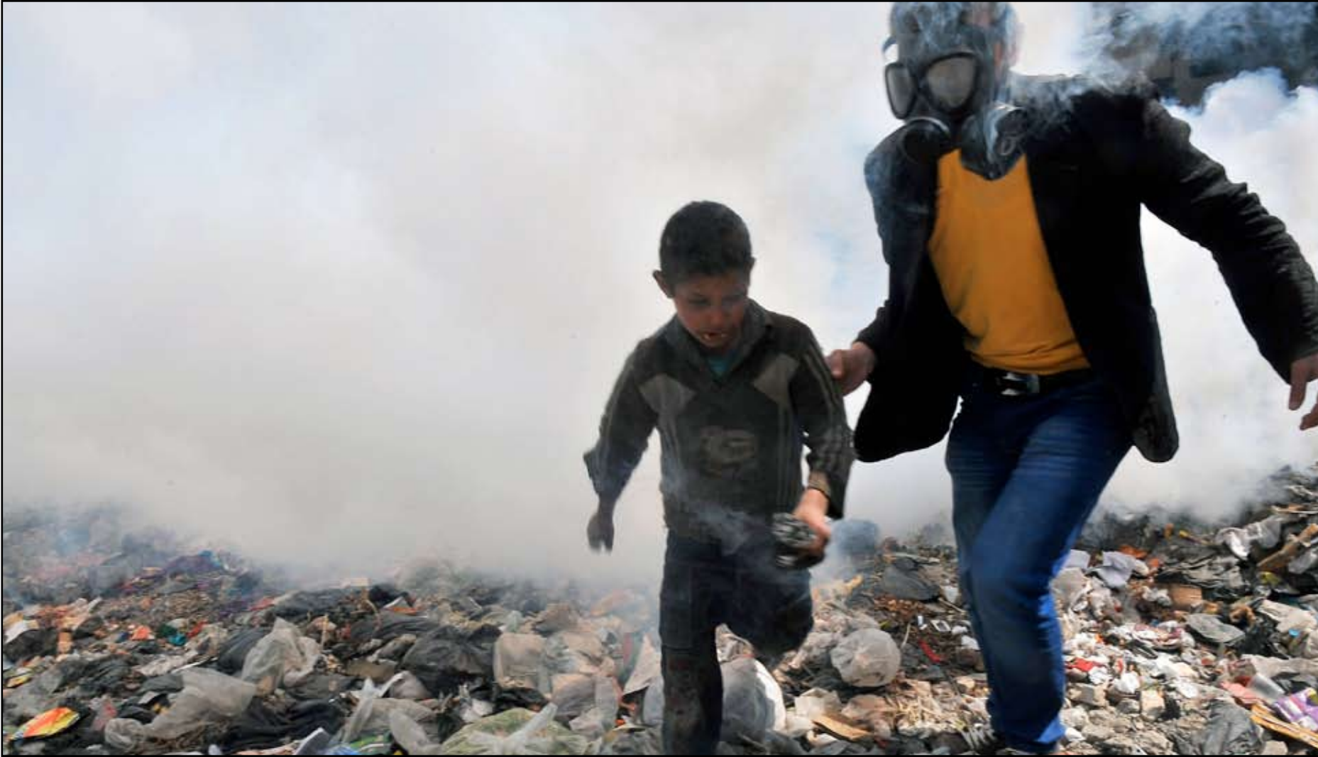
رجل انقاذ يرافق صبياً بعيداً عن الأذخنة في مدينة حلب الشمالية