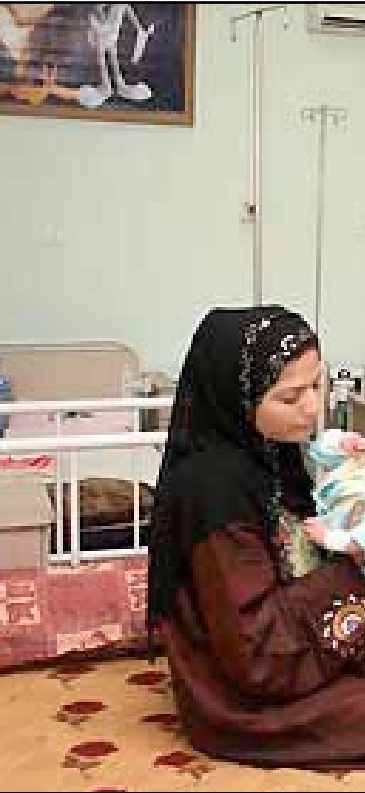
مرضى في أحد مشغقات نيوى.. أرفيف

وكان تنظيم القاعدة في العراق أعلن، في ٢٣ من آذار ٢٠١٣ ، مسؤوليته عن ٧٢ عملية مسلحة وتفجير نفذت في مناطق متفرقة من محافظة صلاح الدين وشمال بغداد خلال شهر واحد