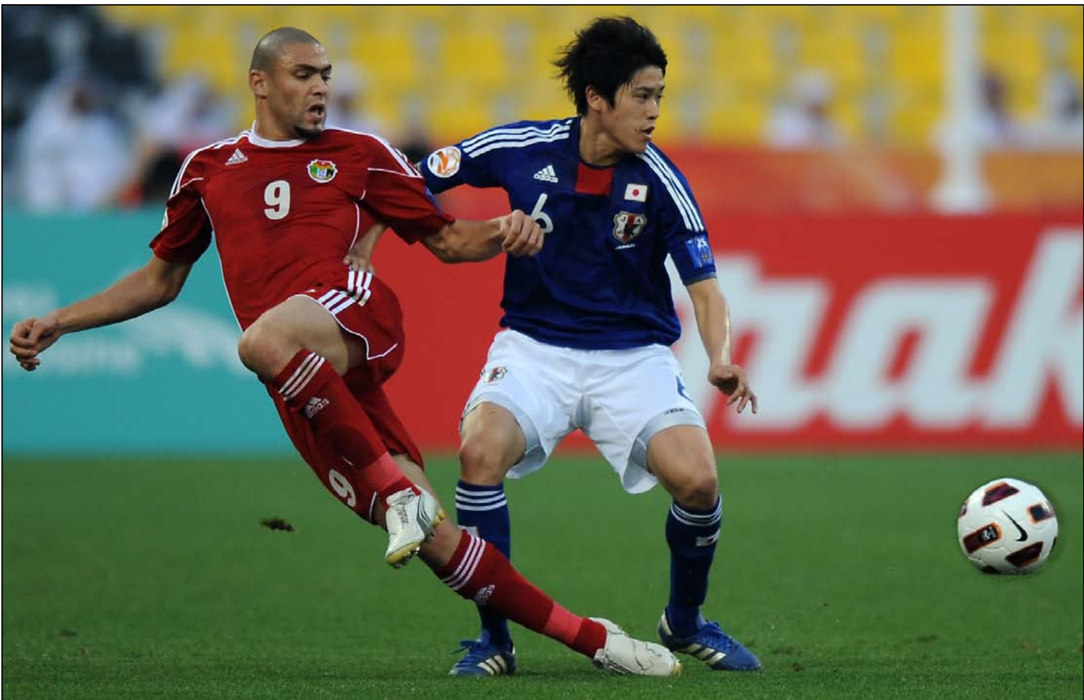
الأردن يسعى لرد اعتباره أمام اليابان