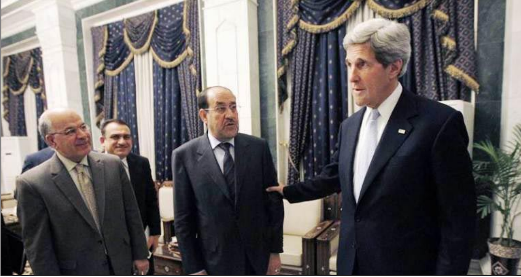
□ بغداد / محمد صباح

كشف نواب عن القائمة العراقية والتحالف الكرديستاني، امس الاثنين، ان وزير الخارجية الاميركي جون كيري اقترح خلال لقائه رئيس مجلس النواب اسامة النجيفي الذهاب الى انتخابات برلمانية مبكرة للخروج من ازمة البلاد، لكن الاخير اشترط حكومة تكنوقراط بعد حل حكومة رئيس الوزراء نوري المالكي.