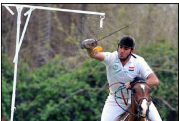
أحد فرساننا لحظة إنهاء فعاليته بنجاح