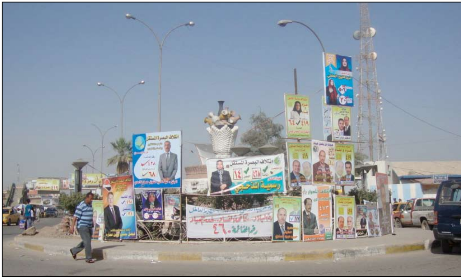
اعلانات الانتخابات في البصرة