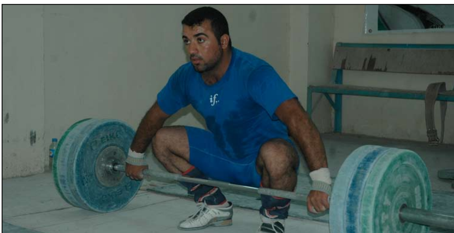
جانب من بطولة القوة البدنية في واسط