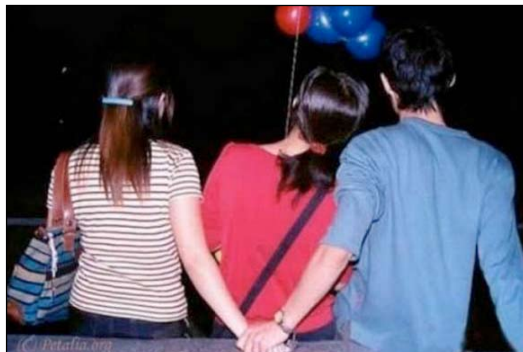
تلاقي الايادي دون علم الزوجة