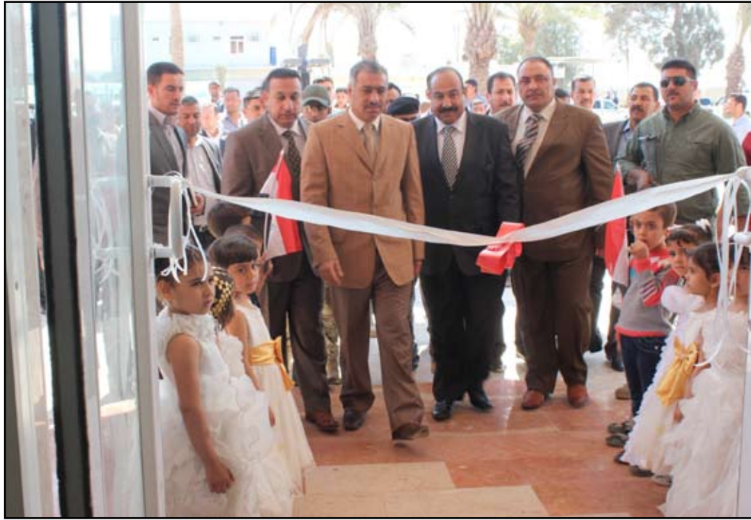
وكيل وزارة الصحة يفتتح مستشفى فلوجة النسائي.. عسدة المدى برس

أعلنت وزارة الصحة، افتتاح مستشفى الفلوجة للنسائية والأطفال غربي الفلوجة، في محافظة الأنبار، بعد الانتهاء من إعادة ترميمها وتأهيلها لفترة استمرت نحو أربع سنوات بمنحة يابانية قدرها ١٧ مليون دولار، فيما أكدت أن الأمم المتحدة هي من تولى مسؤولية صرف الأموال والإشراف على تأهيل المستشفى الذي سيحوي جناحاً خاصاً للتشوهات الخلقية التي انتشرت بشكل كبير في مدينة الفلوجة بسبب "التلوث البيئي" كما تؤكد الوزارة. وقال وكيل وزارة الصحة خميس السعد في حديثه لـ(المدى برس)، خلال مراسم الافتتاح التي حضرها جمع من مسؤولي المدينة ووجهاؤها، أمس الإثنين، أن هذا المستشفى متكامل بكافة احتياجاته من صالات العمليات ودهات خاصة بالأطفال ودهات خاصة بالنساء وسوف يقدم خدمات أهالي الفلوجة والمناطق المحيطة بالمدينة وكذلك المناطق القريبة على مدينة الرمادي والمناطق التابعة إلى صلاح الدين والممتدة على نزار دجلة".