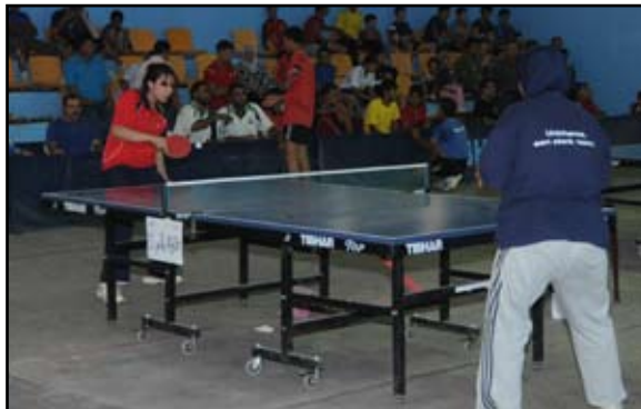
اتحاد الطاولة يناقش واقع اللعبة

تُجرى يوم الجمعة المقبل انتخابات الاتحاد العراقي للرياضة الجامعية على قاعة كلية التربية الرياضية في الجادرية بحضور ممثلي الهيئة العامة للاتحاد لاختيار هيئة ادارية جديدة للاتحاد الرياضية الجامعية تقود الاتحاد في المرحلة المقبلة . ويمثل الهيئة العامة للاتحاد كل من عمداء كليات التربية الرياضية ومدراء اقسام ووحدات التربية الرياضية في الجامعات العراقية وممثلين اثنين عن وزارة التعليم العالي والبحث العلمي .