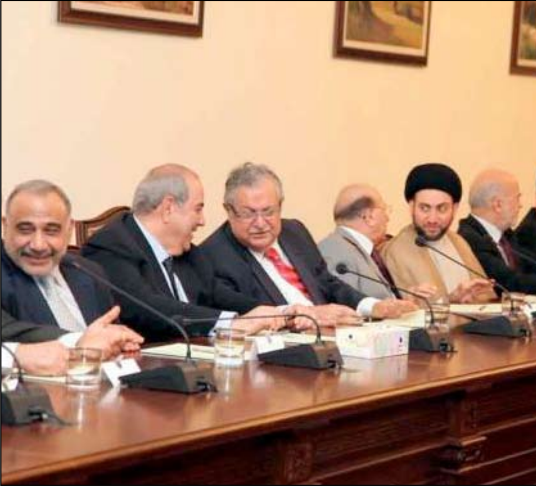
اجتماعات أربيل.. (أرشيف)

وكان رئيس الحكومة العراقية نوري المالكي اعتبر، أول من أمس أنه لولا ائتلاف دولة القانون لانهار العراق، وأنه لولا تماسك الائتلاف في إطار التحالف الوطني لكان العراق في وضع آخر.