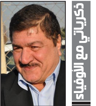
ذكرياتي مع الوفياء