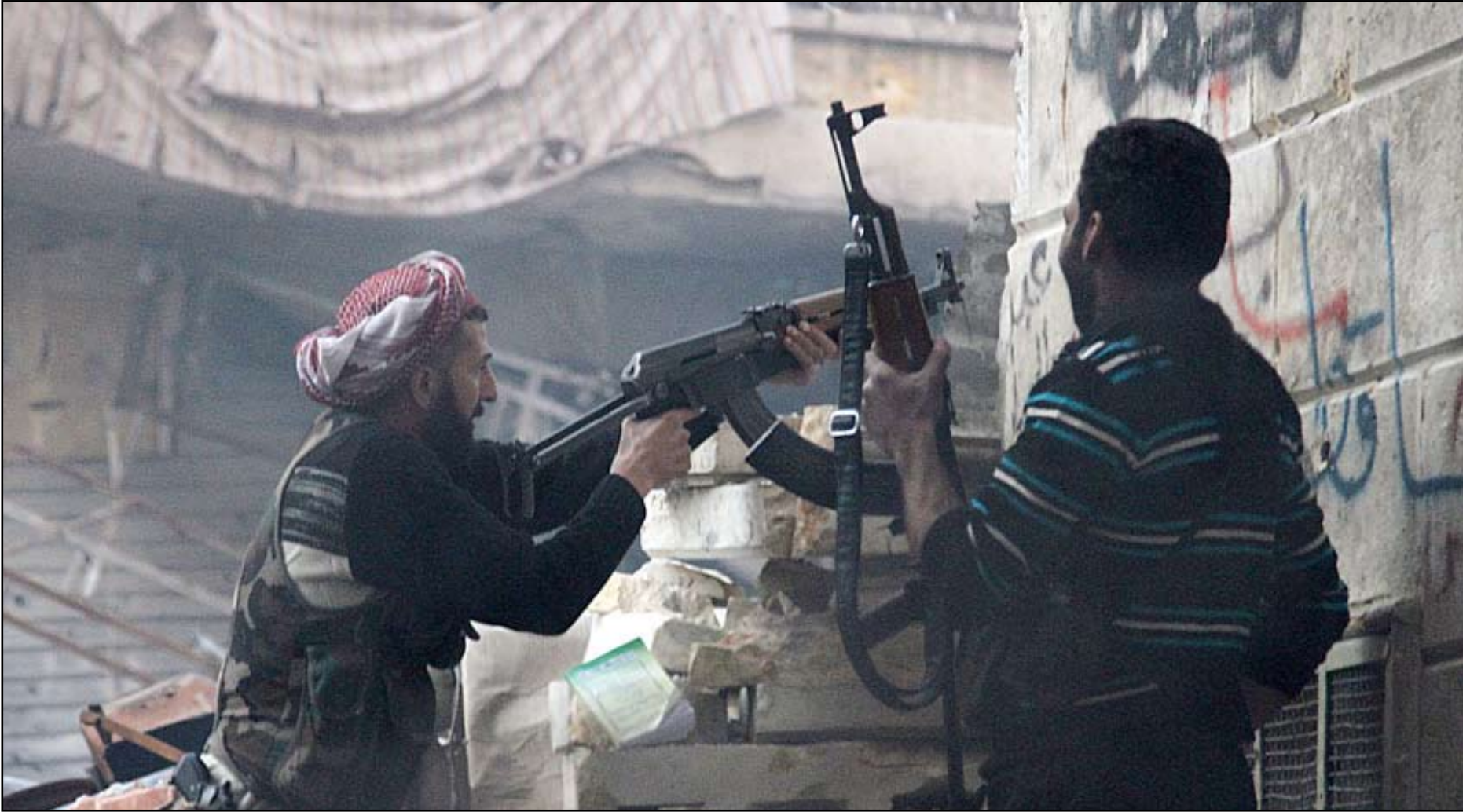
مقاتلون لجانبا ضمن صفوف الجيش الحر السوري ( ا.ف.ب)