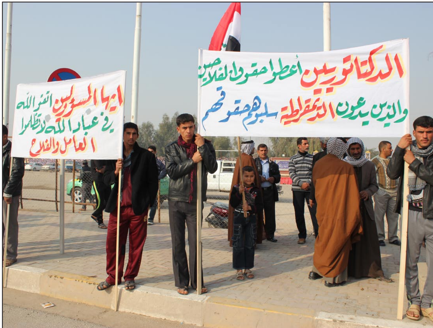
فلاحو كربلاء، يتظاهرون ضد سلب حقوق أراضيهم...