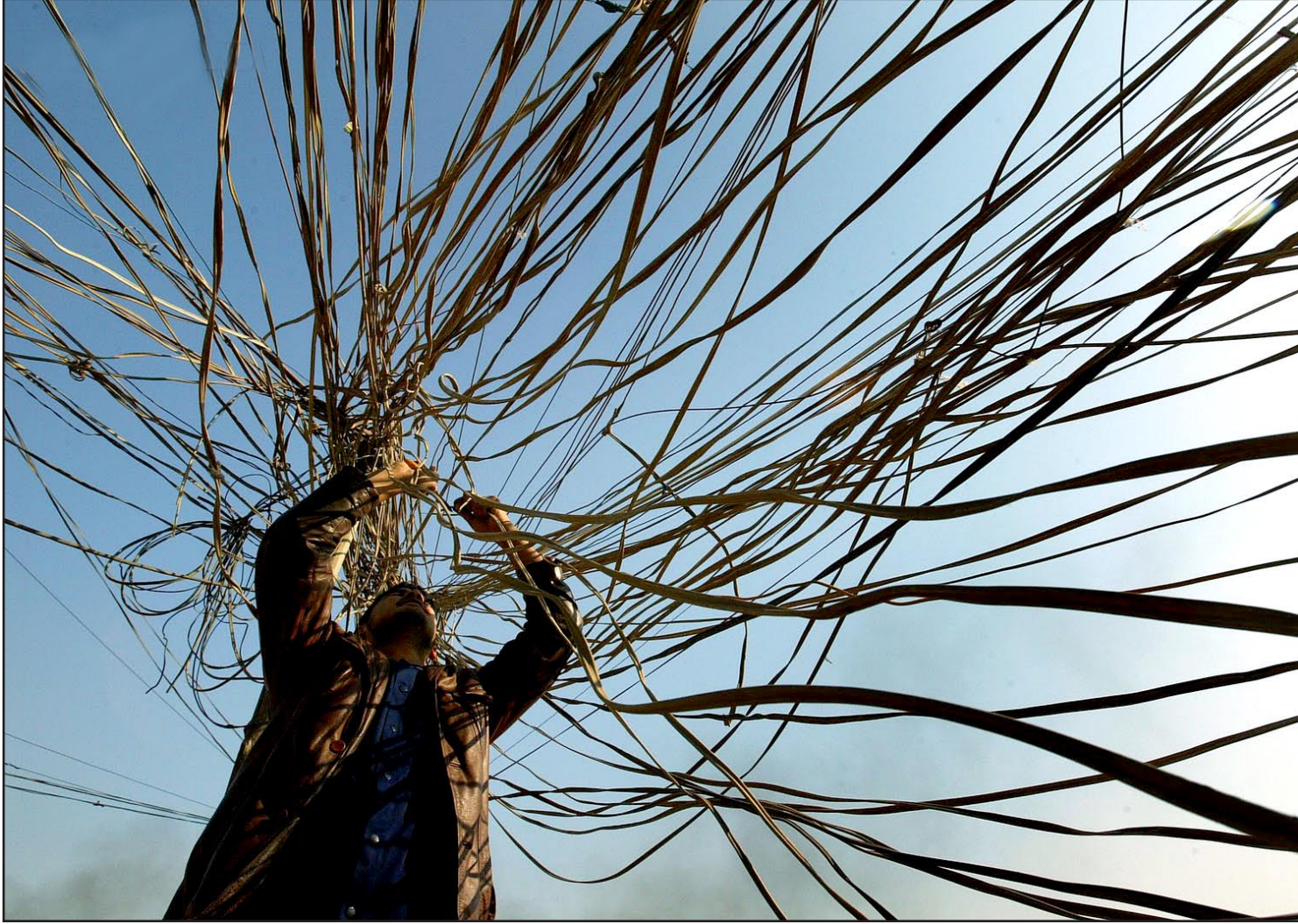
صاحب مولدة اهلية أثناء صيانة أسلاك توصيل الكهرباء...

المعنية لطلب إرفاق براءة الذمة، نظراً لتراكم الديون بسبب عزوف عدد كبير من مستهلكي الطاقة الكهربائية عن دفع الديون التي يذمتهم.