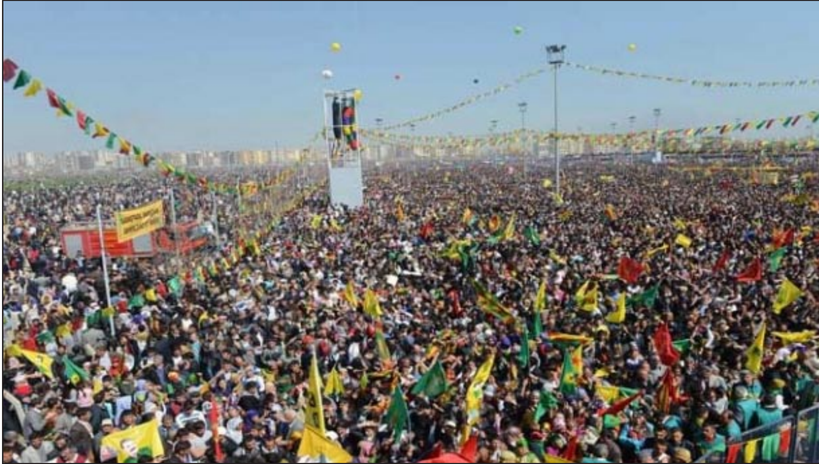
تجمع نوروز في ديار بكر

حتى إشعار آخر تحت قيادة رجلين، واحد في السرايا وآخر في السجن: رجب طيب أردوغان وعبدالله أوجلان. ويات بالتالي باستطاعة كل منهما أن "يفاوض" بعد الآن باسم تركيا المعاصرة التي تحولها الشحنة المعنوية العميقة لخطاب وتظاهرة ديار بكر إلى دولة ذات ثنائية قومية تركية وكردية.