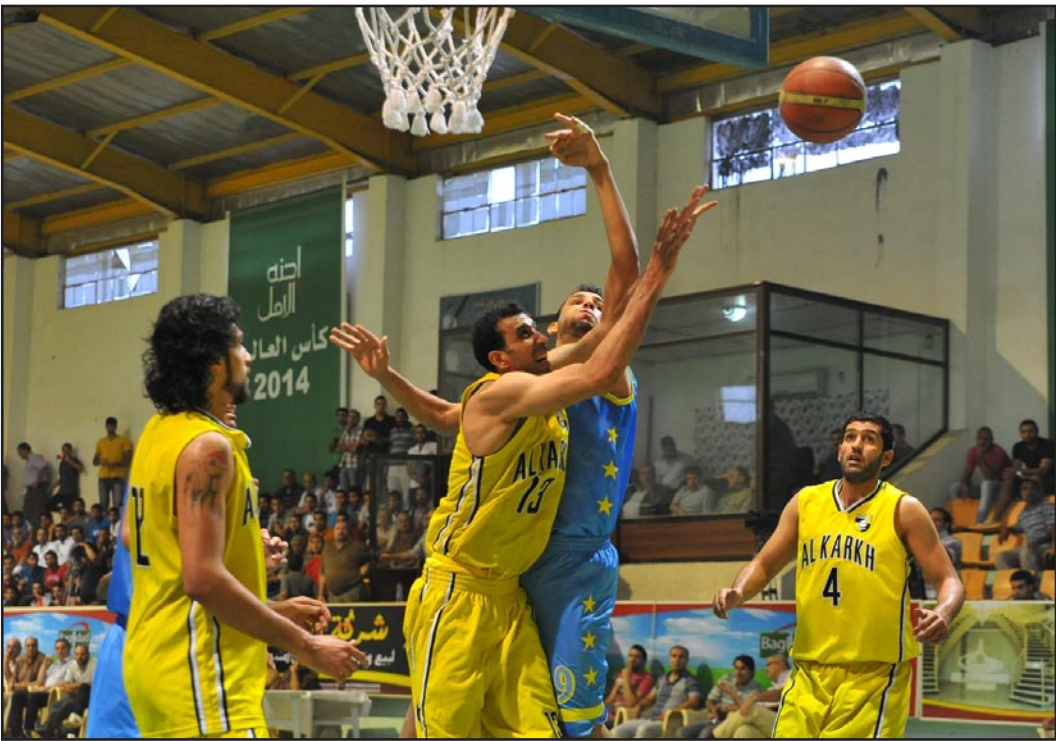
سلة الكرخ في مهمه صعبة امام الشرطة

يذكر ان جميع المباريات تجري في توقيت واحد الساعة الرابعة عصراً.