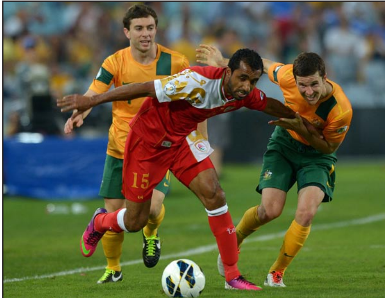
لقاء أستراليا و عُمان صعب مهمة الأسود

المرشحين للفوز بالبطاقتين المخصصتين لهذه المجموعة ومنتخب عُمان الذي يعد منافسا حقيقياً لمنتخبنا ومنتخب النشامى على البطاقة الثالثة التي ستمنح الفائز بها فرصة اللعب في الملحق الآسيوي والملحق الأمريكي الجنوبي، ولذلك اعتقد ان فرصة منتخبنا للتأهل قد اصبحت اقوى من السابق بالرغم من فوز المنتخب الأردني