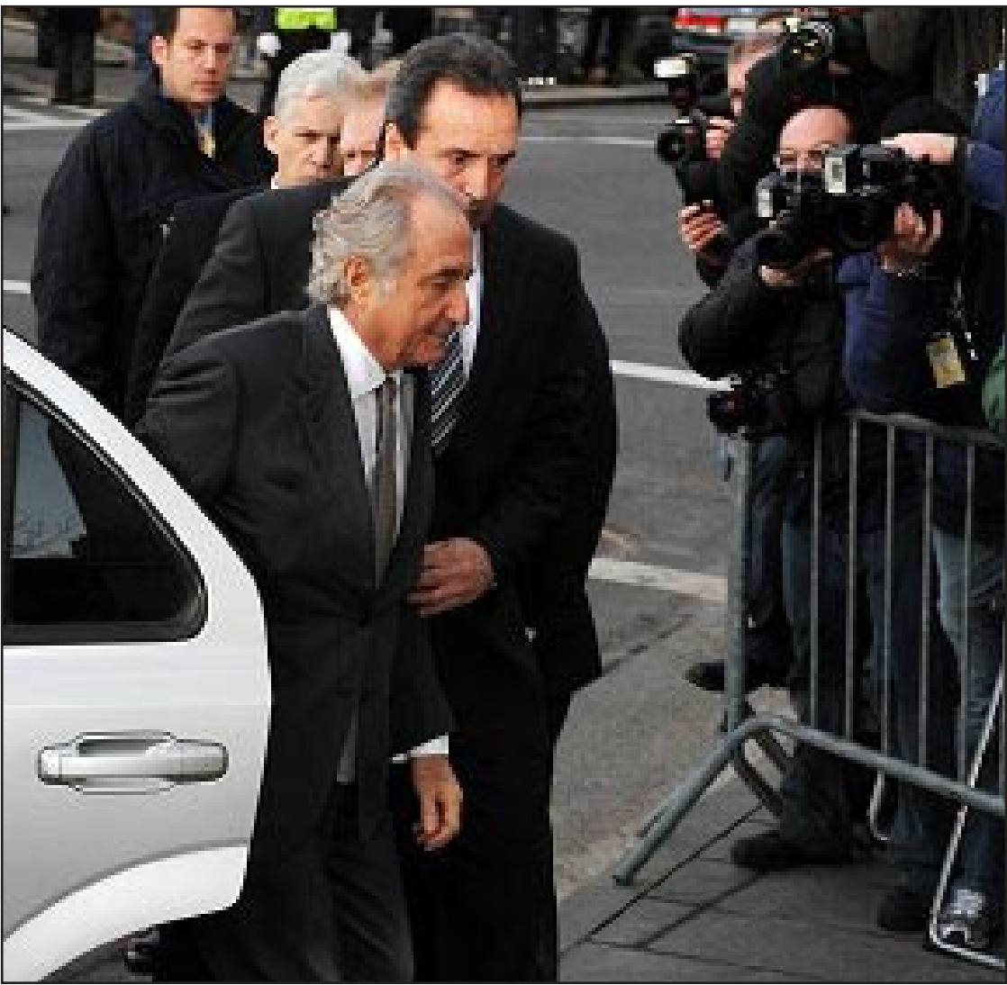
مادوف في طريقه الى المحكمة

في إدارة الشركة ثم انضم الى إدارتها العليا وولداه اندرو ومارك وارتنبتت الشركة بأقارب مادوف ونفذهو الشخصي وعلاقاته السياسية التي ضمنت وضع ستار كثيف للتعطية على تجاوزاته القانونية .