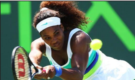
سيرينا وليامس تحرز لقب ميامي

أحرزت الامريكية سيرينا وليامس الصنفة اولى اللقب السادس في دورة ميامي الامريكية الدولية المختلطة لكرة التنس، ثاني دورات (الالف نقطة) والبالغة جوائزها ٨،٥ مليون دولار، بفوزها على الروسية ماريا شارابوفا الثالثة النهائية. توجت سيرينا (٣١ عاماً) في ميامي ٥ مرات سابقة أعوام ٢٠٠٢ و ٢٠٠٣ و ٢٠٠٤ و ٢٠٠٧ و ٢٠٠٨، وحطمت بالتالي الرقم القياسي المسجل باسم الألمانية شتيفي غراف، علماً بأنها حلت وصيفة مرتين عامي ١٩٩٩ و ٢٠٠٩. وأضافت سيرينا اللقب رقم ٤٨ إلى