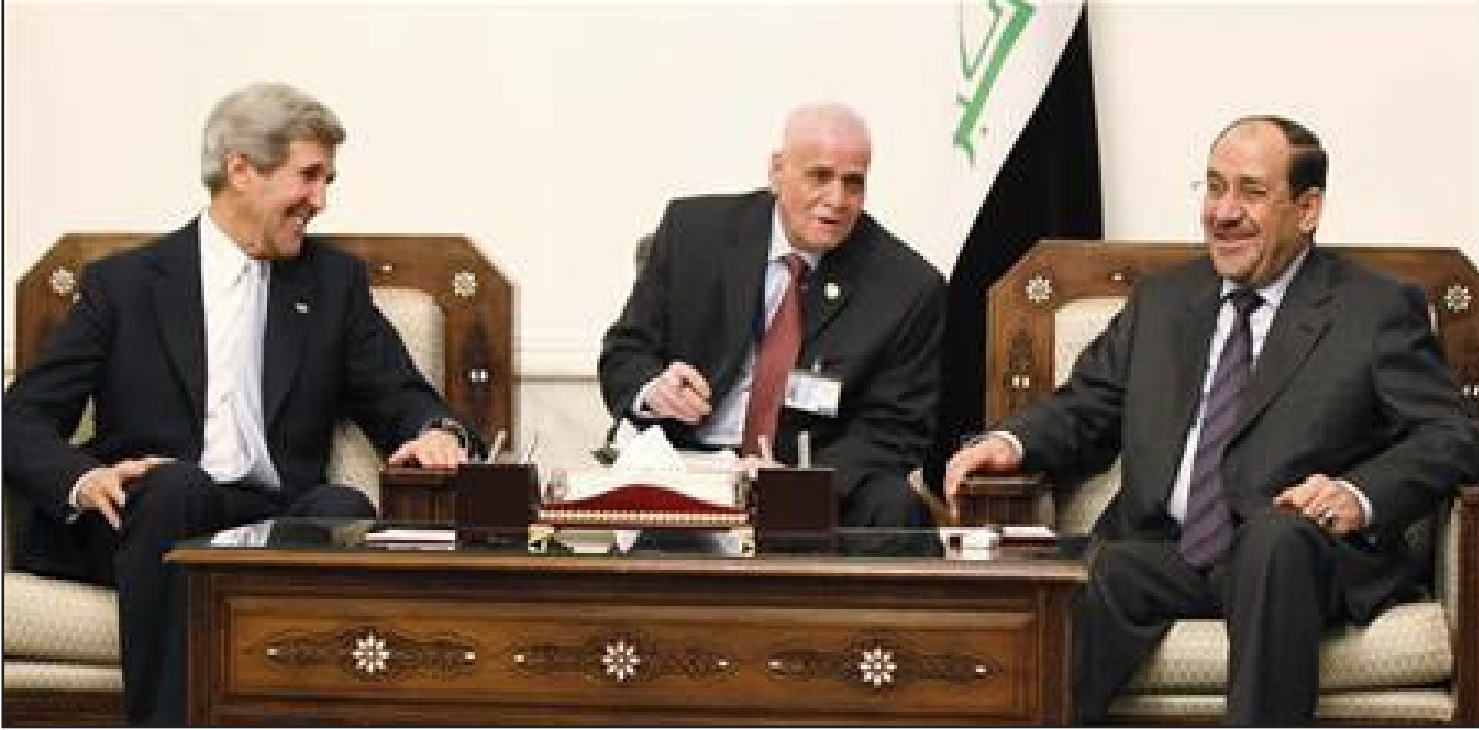
الملك وكيري... أرشيف

الأميركي عاد إلى العراق و تم انتخابه للبرلمان باسم جمال جعفر. و هرب من العراق مرة أخرى عندما عرف الأميركيان هويته الحقيقية، وفي ٢٠٠٩ وصفته وزارة الخزانة الأميركية بأنه تهديد لأمن العراق . لكنه عاد إلى العراق بعد الانسحاب الأميركي.