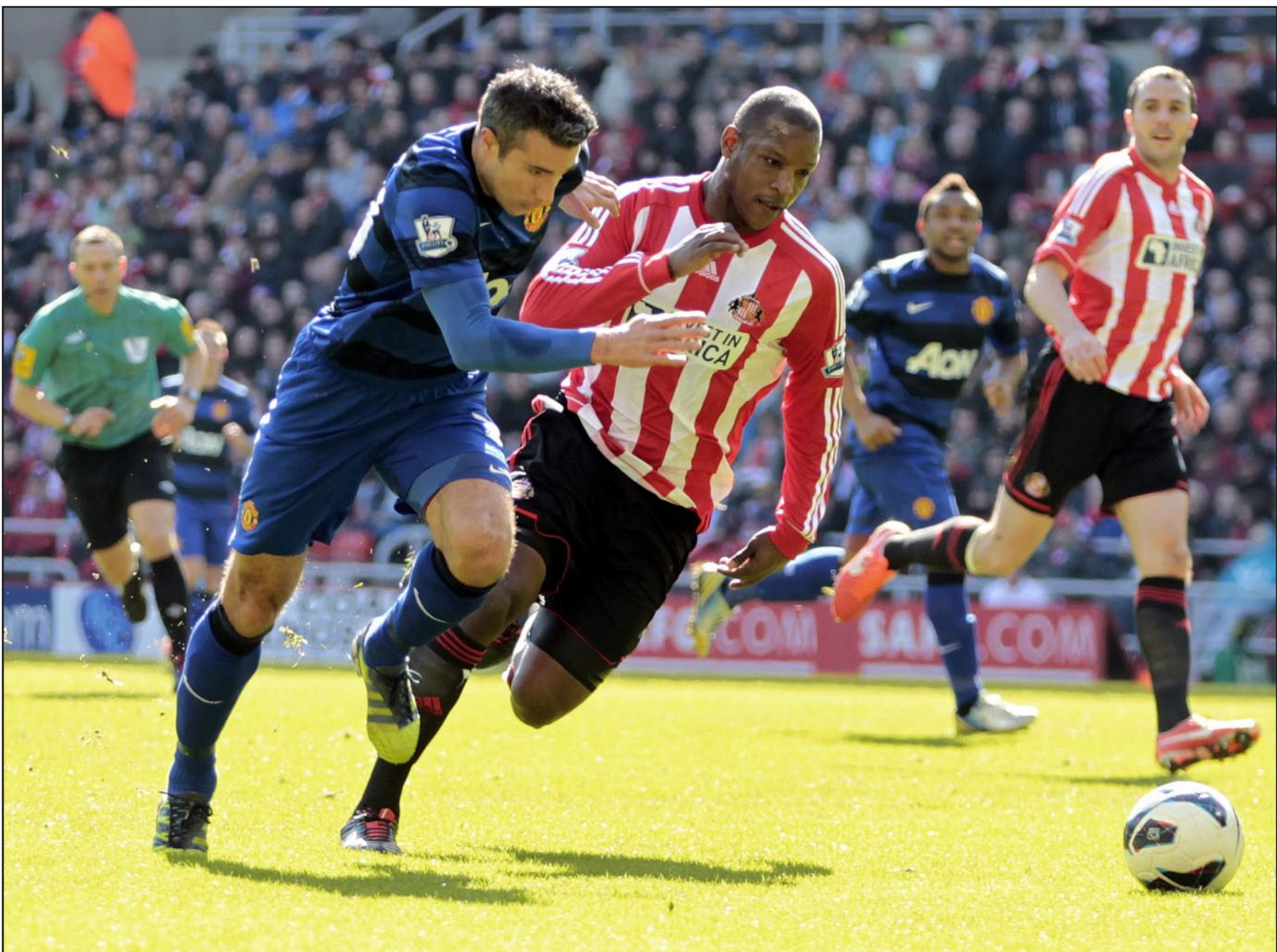
فان بيرسي يواصل تألقه مع المان

وتغلب وست هام على ضيفه وست بروميتش البيون بثلاثة أهداف لأندي كارول (١٦ و ٨٠) وغاري أونيل (٢٨) مقابل هدف لغراهام دورانز (٨٨ من ركلة جزاء). وفاز ويغان على نوريتش سيتي بهدف للمعاجي أرونا كونييه (٨١).