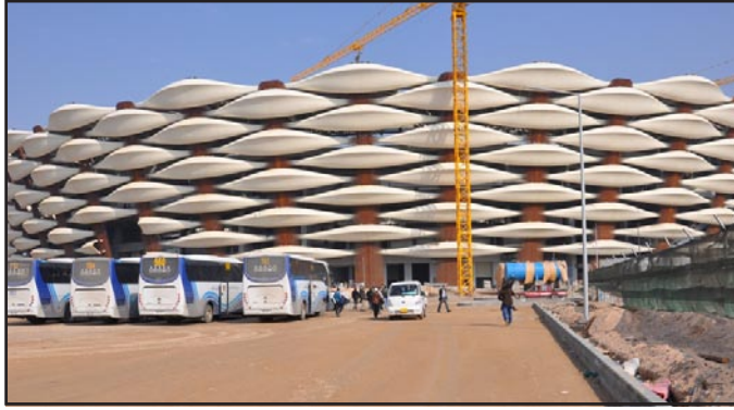
ملعب المدينة الرياضية في البصرة