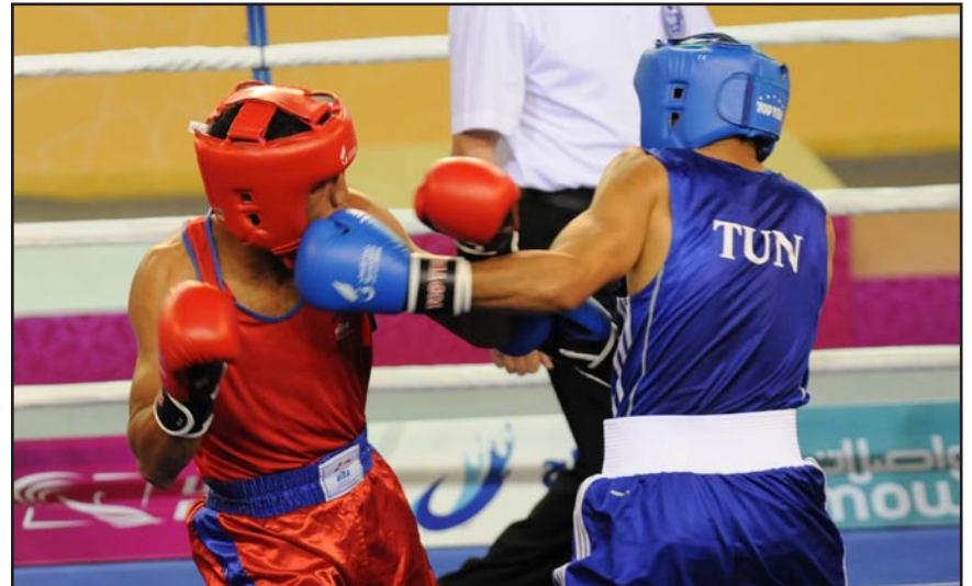
جانب من إحدى البطولات المحلية للملاكمة