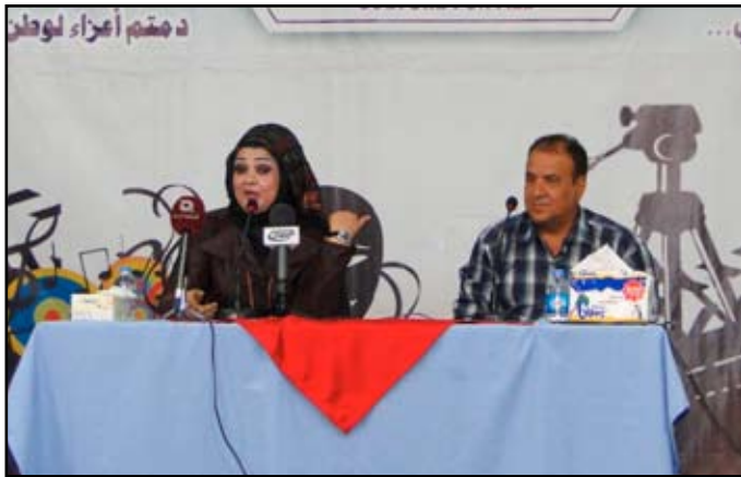
دمش أمراء لوطان