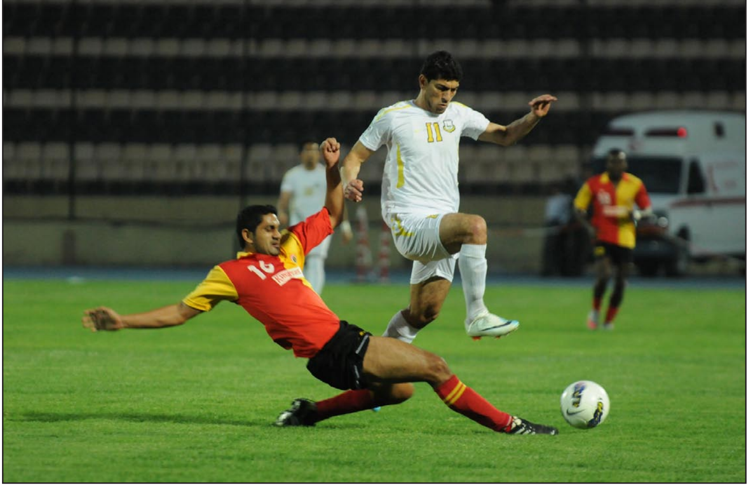
أربيل يسعى لثلاث نقاط جديدة في لقاء فنجالء العماني