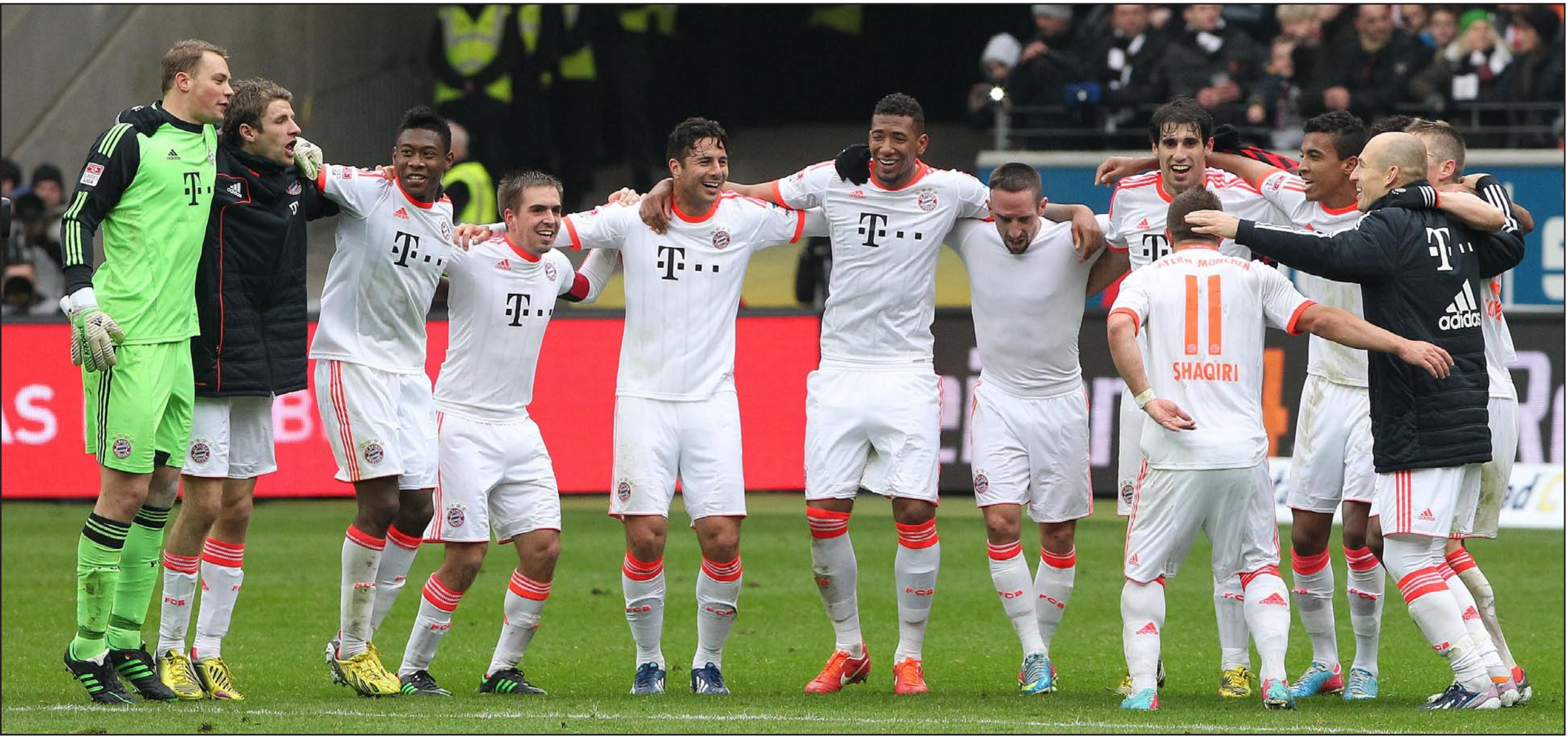
فرحة بايرن ميونيخ باللقب الثالث والعشرين في تاريخه

١٠٠ و ٢٠٠ و ١٠٠ متر، حاليا في ميونيخ لتلقي العلاج على يد طبيب بايرن ميونيخ، هانز ويلهيلم مولر فولفارت، كما التقى العداء المولع بكرة القدم مع بعض اللاعبين من بينهم باسيتيان شفاينشتايجر.