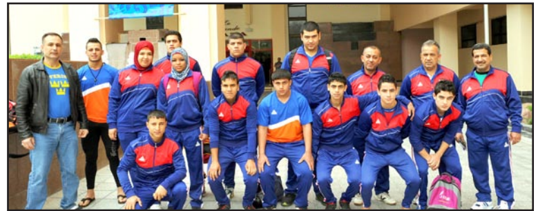
وفد الناشئين في بطولة العالم لرفع الأثقال