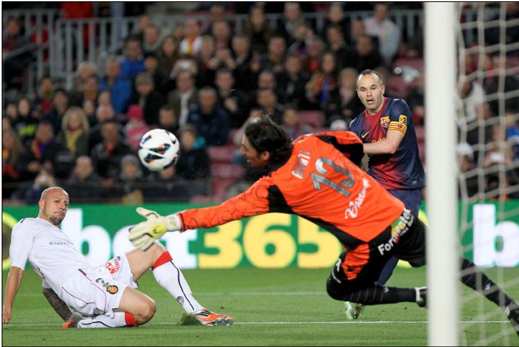
خماسية ساحقة لبرشلونة تعزز خطواته نحو اللقب

فأصاب الشبكية من الخارج (٤٧)، وأصبحت الكرواتي لوكا مودريتش بقذيفة جانبت القائم الأيسر (٤٨)، وسدد رونالدو بدوره وأبعد مونوا كرتة بقبضتي يديه (٥٢). ونقل مارسيلو الكرة إلى هيغواين في الجهة اليسرى عكسها الأخير إلى نقطة الجزاء لتجد رونالدو، الذي تابعها "طائرة" في قلب المرمى (٨٥) رافعاً