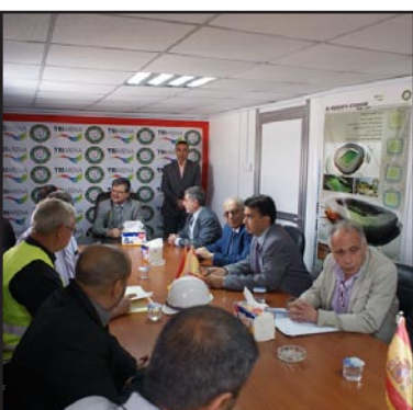
جانب من اجتماع جعفر في بابل

من الارقام القياسية بعدما تقرر ان تكون المشاركة في المنافسات مفتوحة ، وأُشترك فيها ستة عشر ناديا وبمعدل وصل الى سبعين لاعبا تنافسوا بثمانية اوزان هي (١٠٥ ، ٧٦ ، ٨٥ ، ٩٤ ، ١٠٥ ، ١٠٥+ ) كغم، وسيتم في ضوء نتائجها اختيار اللاعبين الافضل تحضيراً للمشاركة في بطولتي العرب وأسيا الى جانب دورة التضامن الإسلامية المقررة اقامتها في اندونيسيا حيزران المقبل.