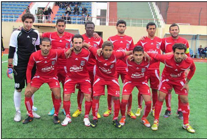
التضامن يهز الأنصار في كأس لبنان