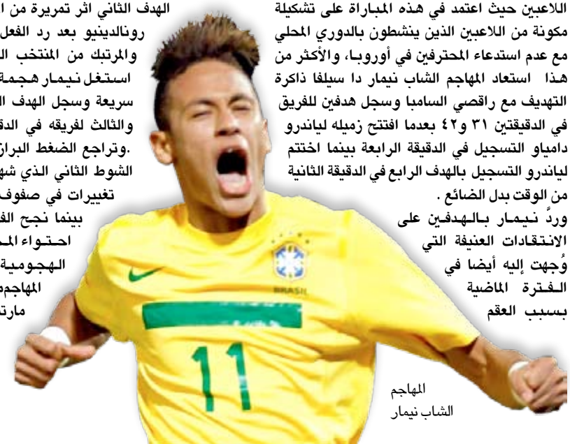
المهاجم الشاب نيمار

ورد نيمار بالهدفين على الانتقادات العنيفة التي وجهت إليه أيضاً في الفترة الماضية بسبب العقم