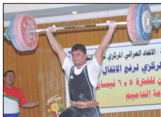
الشرطة بطل اندية العراق بالانقال

■ توج فريق الشرطة بلقب بطولة اندية العراق للمتقدمين لرفع الأثقال التي ضيفتها قاعة التأميم على مدى يومين بعدما جمع ٦٣١ نقطة، فيما جاء فريق بغداد وصيفاً بعد جمعه ٥٧٧ نقطة، وحل الجيش ثالثاً بعدما حصد ٥٠٨ نقطة فيما جاء فريق بكرة رابعا بجمعه ٤٦٤ نقطة. وقال المنسق الإعلامي للاتحاد العراقي المركزي لرفع الأثقال سيف المالكى ان البطولة شهدت تحقيق العديد