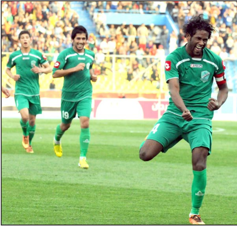
الشرطة يسر بخطف ثابتة نحو اللقب

ليحرز الهدف الثاني بتسديدة رأسية قوية تجاوزت الحارس وعانقت شبكاه ليستمر الضغط الشرطاوي بعد هذين الهدفين ثم استسلم الصناعة تماماً لرغبات القيثارة الخضراء ووقف مدافعا فقط على أمل ان تنتهي المباراة بهذه النتيجة لكن المحترف