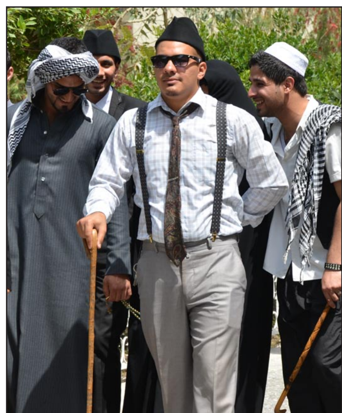
الرزي البغدادي حاضر بقوة