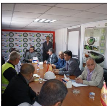
جانب من اجتماع جعفر في بابل

من الارقام القياسية بعدما تقرر ان تكون المشاركة في المنافسات مفتوحة ، وأُشترك فيها ستة عشر ناديا وبمعدل وصل الى سبعين لاعبا تنافسوا بثمانية اوزان هي (١٠٥ ،٥٦ ،٦٢ ،٦٩ ،٧٧ ،٨٥ ،٩٤ ،١٠٥ ) كغم، وسيتم في ضوء نتائجها اختيار اللاعبين الافضل تحضيراً للمشاركة في بطولتي العرب وأسيا الى جانب دورة التضامن الإسلامية المقررة اقامتها في اندونيسيا حزيران المقبل.