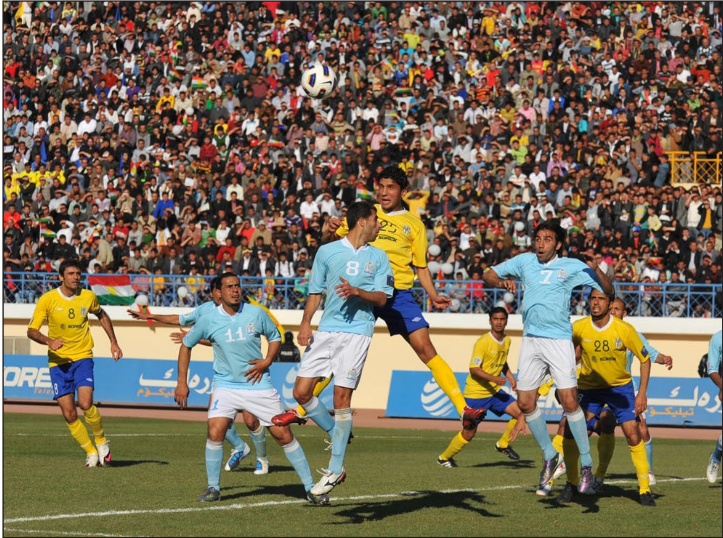
دهوك يواجه ظفار في ملعبه لتأكيد الجدارة

التدريبية سعياً الى رفع درجة الجاهزية استعداداً لخوض المباراة الحاسمة التي ستكون بوابة التأهل نحو الدور الثاني من البطولة الآسيوية. من جهة اخرى يخوض فريق أربيل مباراة مهمة مع فريق فنحاء العماني في الساعة السادسة والربع من مساء غد الثلاثاء على ملعب نادي السيب الرياضي ضمن الجولة الرابعة من الدور الاول للمجموعة الثانية لبطولة كأس الاتحاد الآسيوي ٢٠١٣.