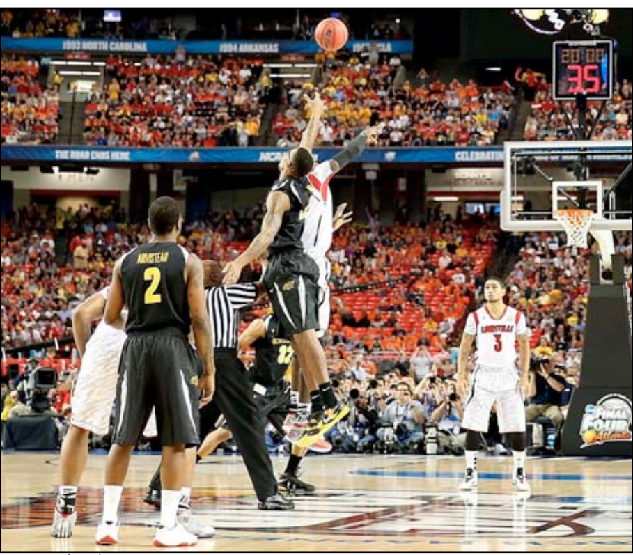
باكس يحقق فوزاً كبيراً على رايتورز

وحسم سان انطونيو سبيرز، الذي توج بلقب مجموعة الجنوب الغربي للعام الثالث على التوالي، فوزه قبل ثمانية من نهاية المباراة عندما كانت النتيجة متعادلة ٩٧-٩٧، فحصل