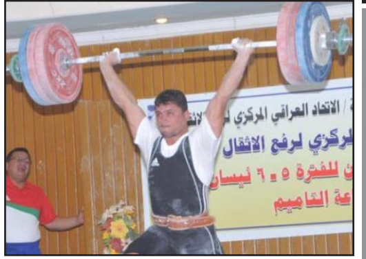
الشرطة بطل اندية العراق بالانقال

■ توج فريق الشرطة بلقب بطولة اندية العراق للمتقدمين لرفع الاثقال التي ضيفتها قاعة التأميم على مدى يومين بعدما جمع ٦٣١ نقطة، فيما جاء فريق بغداد وصيفاً بعد جمعه ٥٧٧ نقطة، وحل الجيش ثالثاً بعدما حصد ٥٠٨ نقطة فيما جاء فريق بكرة رابعا بجمعه ٤٦٤ نقطة. وقال المنسق الإعلامي للاتحاد العراقي المركزي لرفع الاثقال سيف المالكى ان البطولة شهدت تحقيق العديد