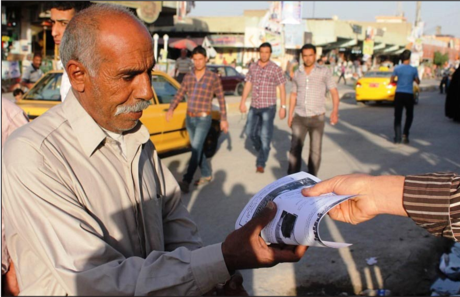
ناشطون يوزعون منشورات تحت اهلالي الديوانية على المشاركة في الانتخابات..

عناصر الأمن الذين سيشاركون في الانتخابات. يذكر أن المفوضية العليا المستقلة للانتخابات أعلنت يوم (٢٦ / ١١ / ٢٠١٢) عن إجمالي عدد المقاعد المخصصة للمحافظات في انتخابات مجالس المحافظات المقرر إجراؤها في (العشرين من نيسان ٢٠١٢)، مؤكدة أنها احتسبت تلك المقاعد وفقاً للبيانات المركزية للإحصاء في وزارة التخطيط. وبحسب المفوضية العليا للانتخابات فإن عدد الكيانات والأقليات التي ستشارك في الانتخابات المحلية المقبلة المقررة في العشرين من نيسان المقبل يبلغ ١٣٩ كياناً سياسياً فيما يبلغ عدد المرشحين للانتخابات المحلية ٨٢٧٥ مرشحاً.