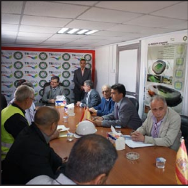
جانب من اجتماع جعفر في بابل

من الارقام القياسية بعدما تقرر ان تكون المشاركة في المنافسات مفتوحة ، وأُشترِك فيها ستة عشر ناديا وبمعدل وصل الى سبعين لاعبا تنافسوا فيمانيه اوزان هي (١٠٥ ،٦٢ ،٦٩ ،٧٧ ،٨٥ ،٩٤ ،١٠٥ ،١٠٥+ ) كغم، وسيتم في ضوء نتائجها اختيار اللاعبين الافضل تحضيراً للمشاركة في بطولتي العرب وأسيا الى جانب دورة التضامن الاسلاميه المقررة اقامتها في اندونيسيا حزيران المقبل.