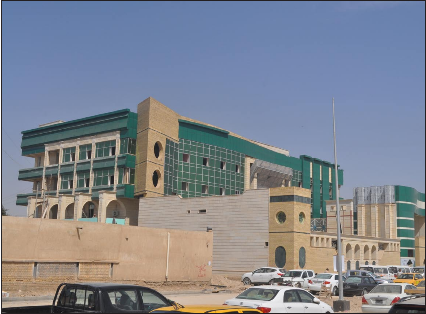
المبنى الجديد لمديرية بلدية الكوت

الجديدة لمدينة الكوت وضعت في غير محلها، وبالتالي ستكون لها تأثيرات أكبر في المستقبل ليس على السكان المجاورين فحسب، بل ستعكس على البلدية ذاتها حيث سيكون الوصول لها صعباً في ظل ازدياد أعداد المركبات وزيادة النمو السكاني وما يرافقه مع توسع في المراجعات اليومية للبلدية". يذكر أن مدينة الكوت، مركز محافظة الكوت، تضم أكثر من خمسين حياً سكنياً وتعاين أحياء مركز المدينة على وجه الخصوص من وجود معظم الدوائر والمؤسسات الحكومية المهمة فيها، في وقت شرعت دوائر أخرى بإنشاء بنايات جديدة لها خارج مركز المدينة كما هو الحال في البناية الجديدة لقيادة الشرطة وبناية مؤسسة الشهداء ودائرتي البيئة ومباني واسط وغيرها من الدوائر الأخرى.