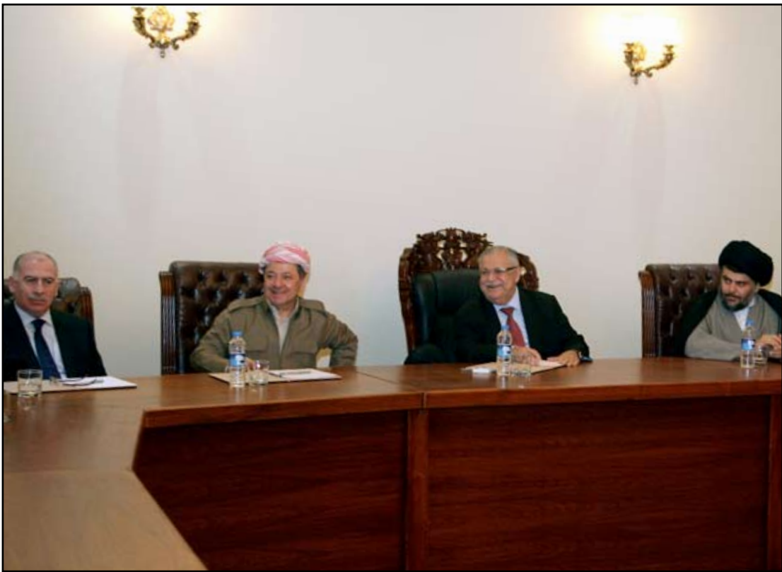
جانب من اجتماعات أربيل.. (أرشيف)

ونفى القيادي البارز في حزب الدعوة الإسلامية أن يكون رئيس الوزراء نوري المالكي اعتمد نسخة غير النسخة التي اتفق عليها في اتفاقية أربيل، والتي تحتوي على مواد كثيرة توزع فيها مهام وصلاحيات رئيس الحكومة نوابه ووزرائه، لافتاً إلى ان "النظام الداخلي ينص على ان يكون هناك ثلاثة نواب لرئيس مجلس الوزراء". ويشير السنيد إلى ان "التصويت على القوانين والقرارات يكون داخل مجلس الوزراء تكون ما نسبته ٥١% من الحضور".