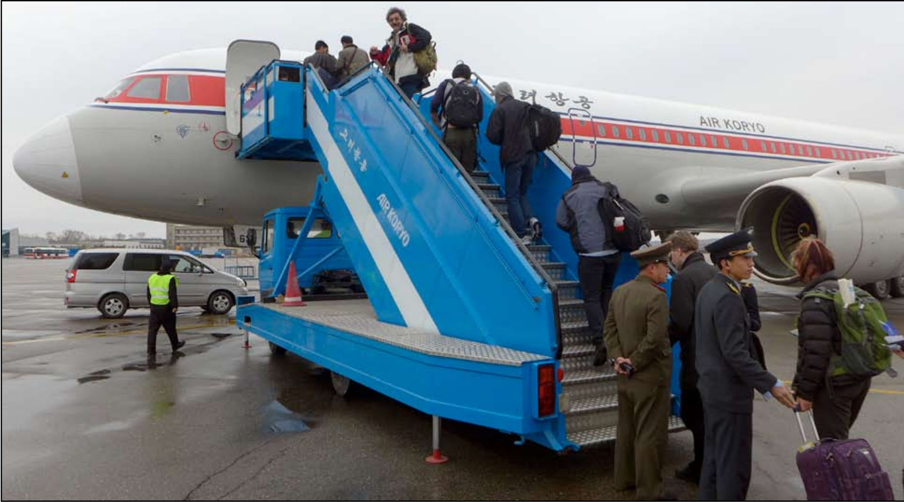
مسؤول كوري شمالي يتحقق جوازات سفر لمجموعة من الدبلوماسيين الأجانب الذين غادرو الى بكين...