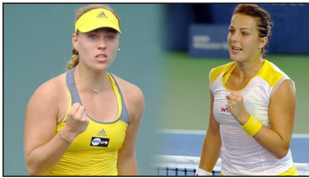
مواجهة صعبة بين كيربر وغريميتا بافليوتشكيفا

وباريس، في النهائي مع الروسية الأخرى اناساتازيا بافليوتشكيفا الخامسة التي تغلبت على الرومانية مونيكا نيكوليسكو ٣-٦ و ٦-٤ في ساعتين و ٩ دقائق.