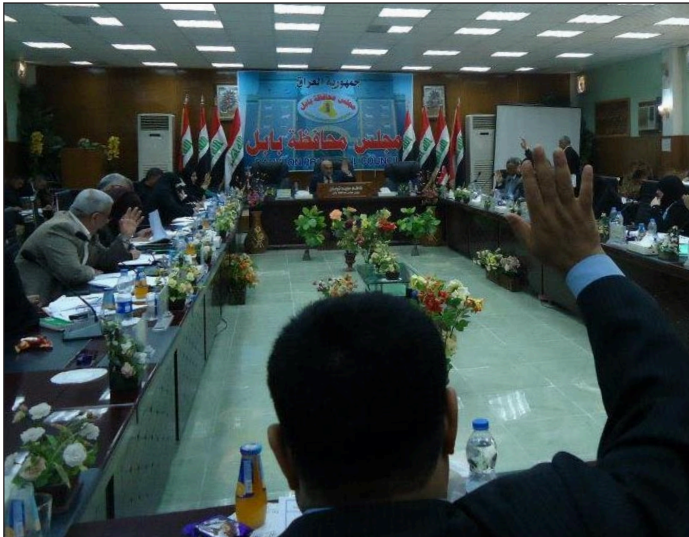
مجلس محافظة بابل

إلى مجالس المحافظات. في شأن بابلي أحر، انتقدت لجنة الطاقة في مجلس المحافظة، تصريحات المسؤولين في الحكومة الاتحادية بشأن أزمة الكهرباء في البلاد وأفاق حلها، عاداً أنها "غير دقيقة"، مؤكدة أن محطات التوليد إذا ما عملت بكامل طاقتها فإنها لن تسد سوى ٧٠ بالمئة من الطاقة دون أن تتمكن من سد النقص الذي تعانيه المحافظة في هذا المجال. وقال رئيس لجنة الطاقة في مجلس