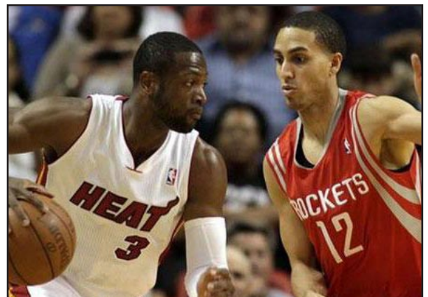
فوز جديد لسلة يوتا جاز في الدوري الأمريكي