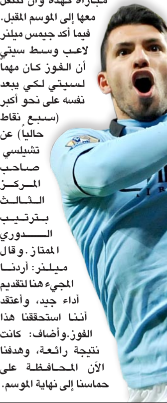
أغويرو بعد تسجيله هدف الفوز