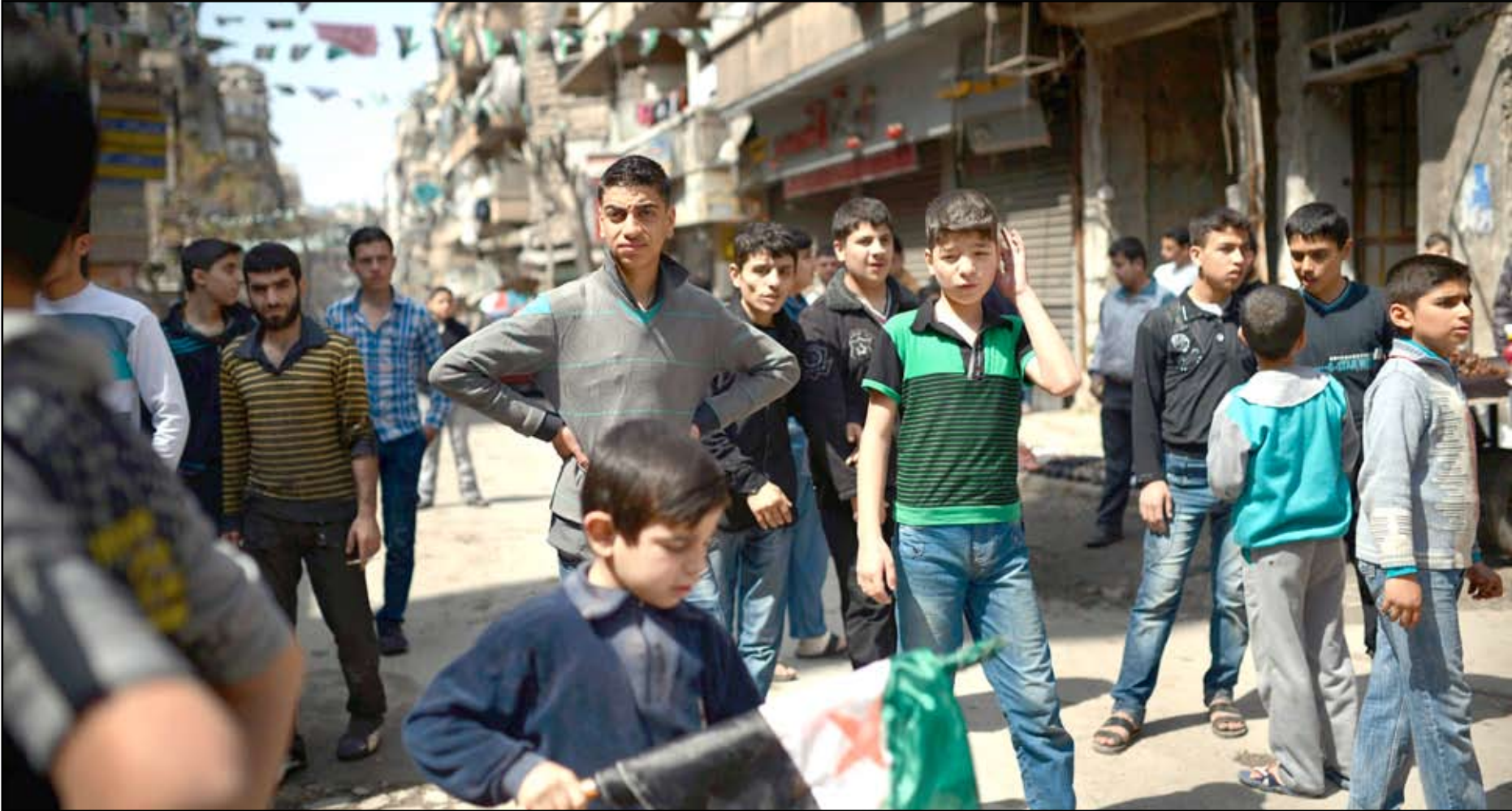
مظاهرة ممانهضة للنظام السوري في مدينة حلب