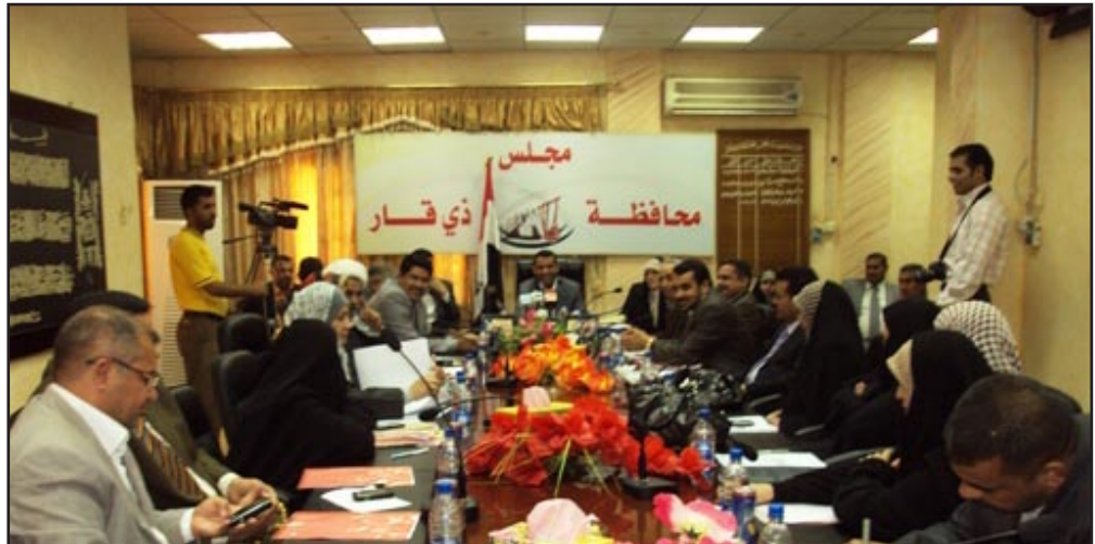
مجلس محافظة ذي قار

وكانت الأمم المتحدة، قد دعت العراق من قبل إلى تفعيل وسن القوانين التي تضمن حقوق ذوي الإعاقة وحقوق الإنسان أن العراق بشكل عام، في حين أكدت وزارة حقوق الإنسان أن الأوضاع الأمنية الصعبة وغير المستقرة "تؤثر سلباً على حقوق المواطنين عموماً". ورأت لجنة المرأة والطفل اللبنانية، في الرابع من كانون الأول ٢٠١٢ المنصرم، أن البرلمان "أخفق بتشريع قانون يوفر معيشة مقبولة للمليون ونصف المليون معاق في العراق يعيشون ظروفها قاسية، داعية إلى إقرار ما يوفر لهم "خلاً معقولاً يغطي حاجاتهم المعيشية". يذكر أن عدد المعاقين في العراق ارتفع كثيراً من جراء الحروب المتتالية التي شهدتها البلاد، قبل سقوط النظام السابق سنة ٢٠٠٣، ومن ثم العنف والعمليات العسكرية والألغام والمقذوفات الحربية غير المنفلقة، إذ يقدره بعض الإحصائيات بما يتجاوز مليونين ونصف المليون معاق، أي ما نسبة ١٢٪ من المجتمع العراقي.