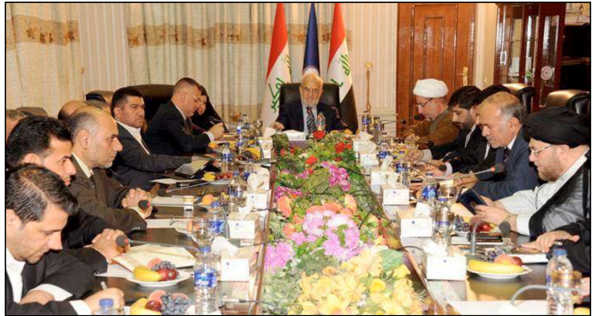
اجتماع سابق للتحالف الوطني..

وقال دولة القانون في بيان أمس إنه "انطلاقا من مبادئ الإنسانية وما يتعلق بالحقوق المعيشية لعائلات المشمولين بقانون المساءلة والعدالة رفض التحالف الوطني أي مطلب لإلغاء القانون"، مؤكدا أن "التحالف أصر على أن يكون عمل اللجنة الخماسية بالتعديل دون الإلغاء".