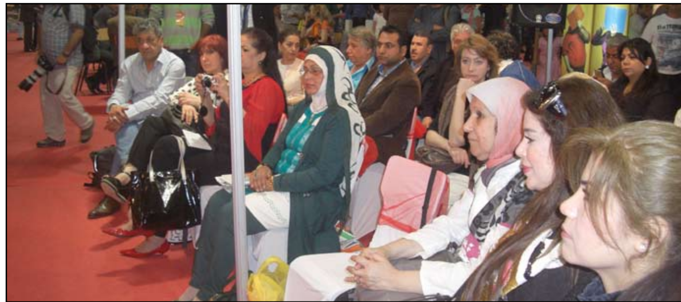
جانبا من الندوة

وبما أن المعرض هو تظاهرة ثقافية تقدم فيه جميع النشاطات الثقافية من شعر ومحاضرات فكرية وسياسية وموسيقى وغناء، وقد تم تقديم العديد من هذه الفعاليات، ولكن للأسف كان المسرح غائبا، وهنا أود أن أشير إلى مسألة مهمة وهي أن تخصص مساحة أوسع لتقديم هكذا فعاليات، وأن تكون هناك خشية مسرح لتقديم أكثر من عمل مسرحي طيلة فترة أيام المعرض، وأن تقدم الفعاليات ضمن أجواء من الهدوء النسبي، وبعيدا عن حركة الزائرين للمعرض.