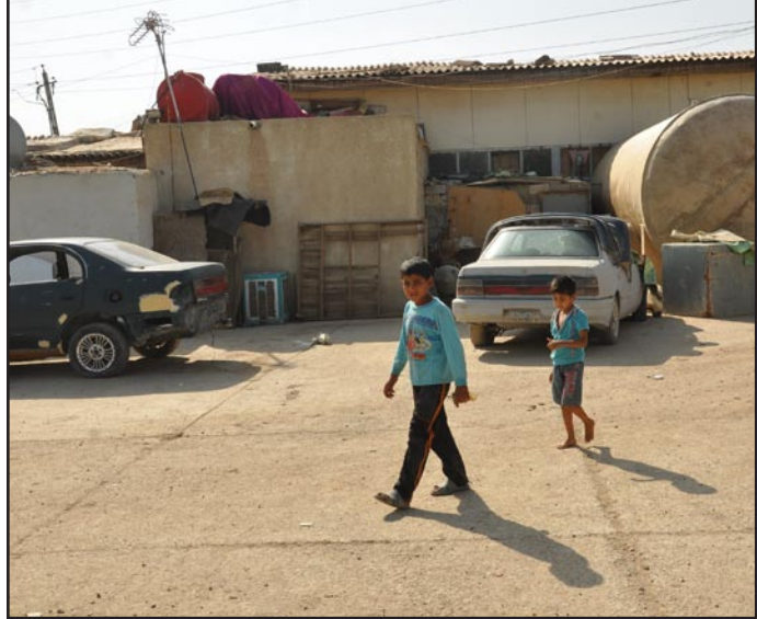
سكن في أملاك الدولة

تأمل أن لا يطرق علينا صاحب الدار الباب ليطلبنا بدفع الإيجار ولكن ما يجري بالسوق من ماراتون في ارتفاع الأسعار جعلنا نفقد الأمل ببناء مسكن يؤوي عوائلنا التي طال صبرها ولا احد يفكر بنا.