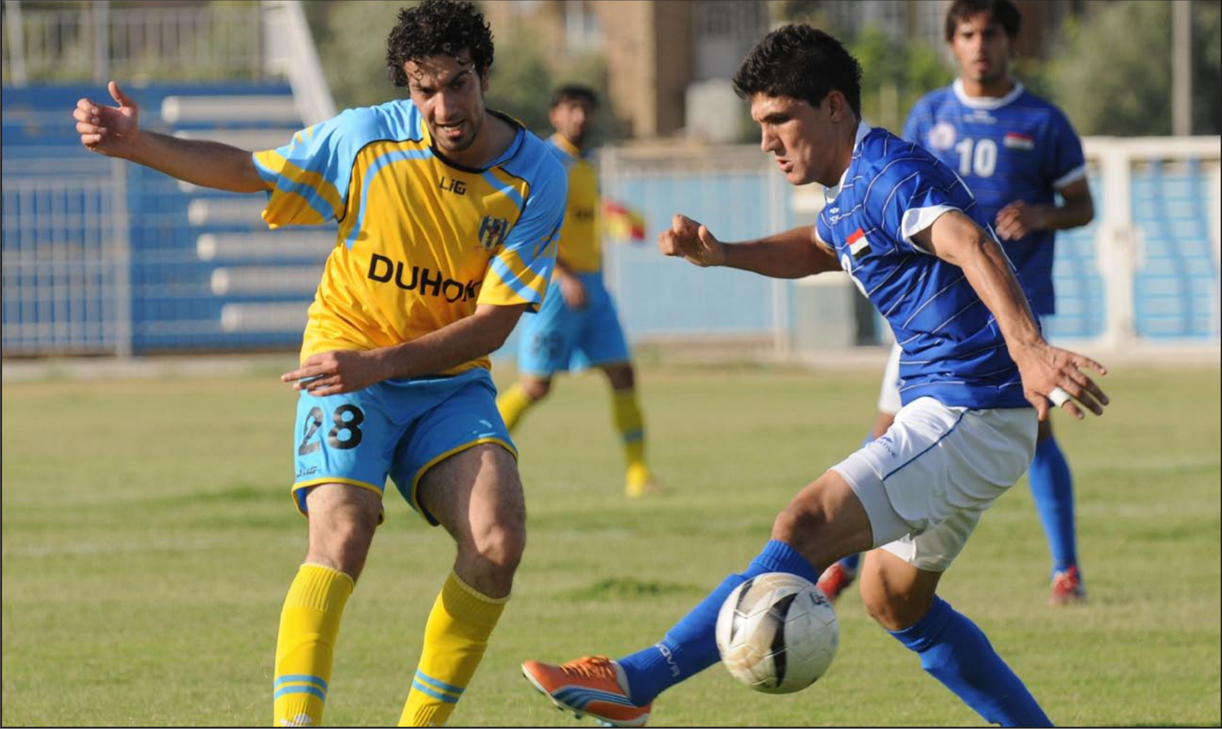
دهوك يلعب البقاء في صدارة المجموعة