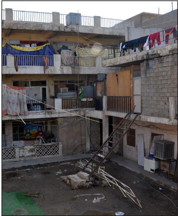
مجمعات سكنية عشوائية

قيمة الأراضي والعقارات والإيجارات في مناطق بغداد.