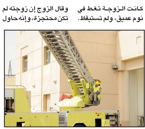
يو بي اي

فتح الباب بعدة طرق من دون أن يسبب لها الضرر الهلع، إلا أنه فشل ولم يتمكن من إيقاظها، ما استدعا لطلب المساعدة من الدفاع المدني. وقد حضرت إحدى فرق الدفاع المدني، وقامت بفتح الباب بكل هدوء من دون أي إزعاج أو هلع للزوجة.