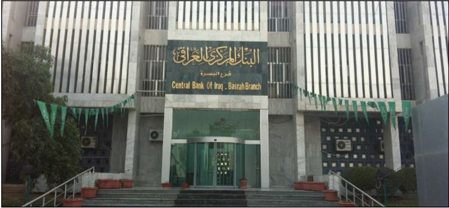
مبنى البنك المركزي العراقي في البصرة

كشف عضو لجنة النزاهة البرلمانية جواد الشهيلي، امس أن "عشرة أطنان من الذهب سرقت من البنك المركزي" خلال نهاية العام الماضي، وأكد أن الرئاسة الحالية للبنك "منورثة" بتلك السرعة، وفيما لفت إلى قرب الكشف عن "أكبر سرقة" في البنك حصلت خلال الأيام الماضية، اتهم رئيس الحكومة نوري المالكي بـ"إبعاد" المحافظ السابق للبنك سنان الشبيبي بسبب رفضه إقراض الحكومة "مبالغ مالية" خارج إطار القانون. وقال الشهيلي خلال مؤتمر صحافي عقده في مبنى البرلمان إن "الأيام المقبلة ستشهد افتتاح ملفين خطيرين بعمل البنك المركزي العراقي الأول بشأن تمويل شركات الهاتف النقال، والأخر سرقة عشرة أطنان من احتياطي الذهب من البنك المركزي في ١٥١ من تشرين الثاني ٢٠١٢. لم يعترف البنك بها حتى الآن، مؤكداً أن الرئاسة الحالية للبنك المركزي منورثة بتلك السرعة".