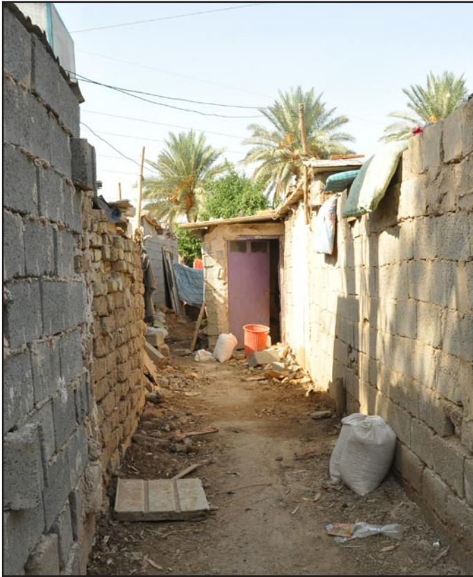
مسكن غير قانونية

□ بغداد / إيناس العبيدي .. تصوير / محمود رؤوف