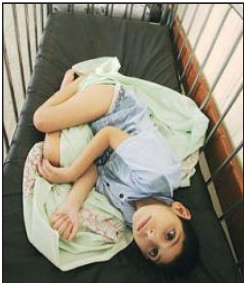
معاناة شديدي العوق في العراق في تزايد مستمر... أرشيف

وشدد الهبر على ضرورة "دعم المعوقين وتشريع قانون يحول هذه المؤسسات إلى تشكيلات وزارة الصحة، باعتبار أن هؤلاء المعاقين مصابون بأمراض معينة"، مؤكداً أن "هذا الأمر هو