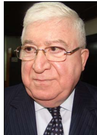
الدكتور فؤاد معصوم

الملاحج العمرانية لمدينتهم. للمرة الأولى احضر معرض المدى للكتاب، بهرني التنظيم، الحضور المتنوع للناشرين