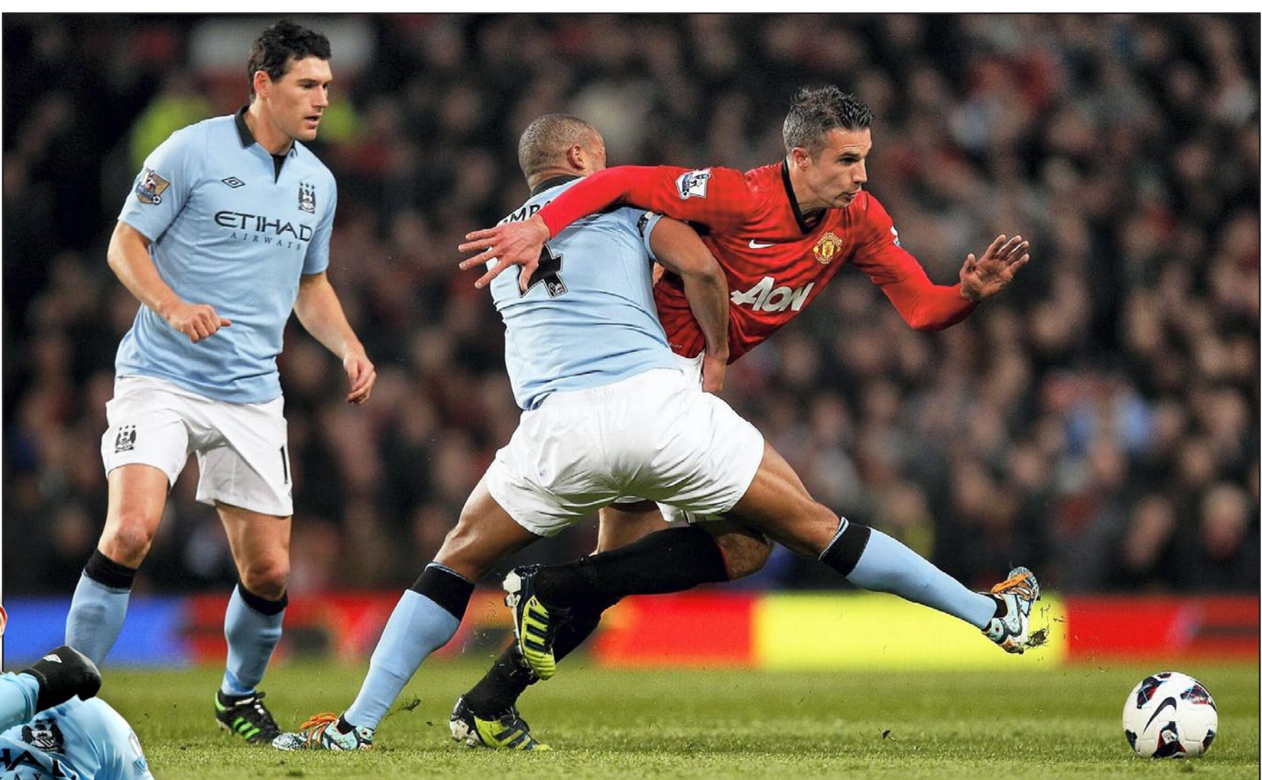
مانشستر سيتي يتأثر من يونايتد على ملعب الشياطين الحمر

بعيدا ثم سد كرة ارتطمت بلاعبين من مدى بعيد.