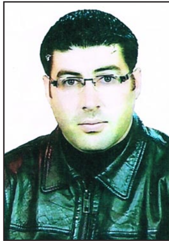
صورة الشاب المختلس

وفي هذا السياق، كشفت هيئة النزاهة عن قيام شاب مجهول الاسم والهوية ومحل الإقامة بأكبر عملية نصب تشهدها مصارف العراق، بقيمة ١٤ مليار دينار (نحو ١٢ مليون دولار) وخلال فترة زمنية لا تتجاوز الشهر. ويقول مدير عام التحقيقات في الهيئة ماهر رشيد، في حديث مع "المدى" أمس، إن "أحد المواطنين جاء إلى مصرف الرافدين الفرع الرئيسي في وزارة المالية، بعد فتح حساب جار له بمعية أحد التجار العملاء للمصرف".