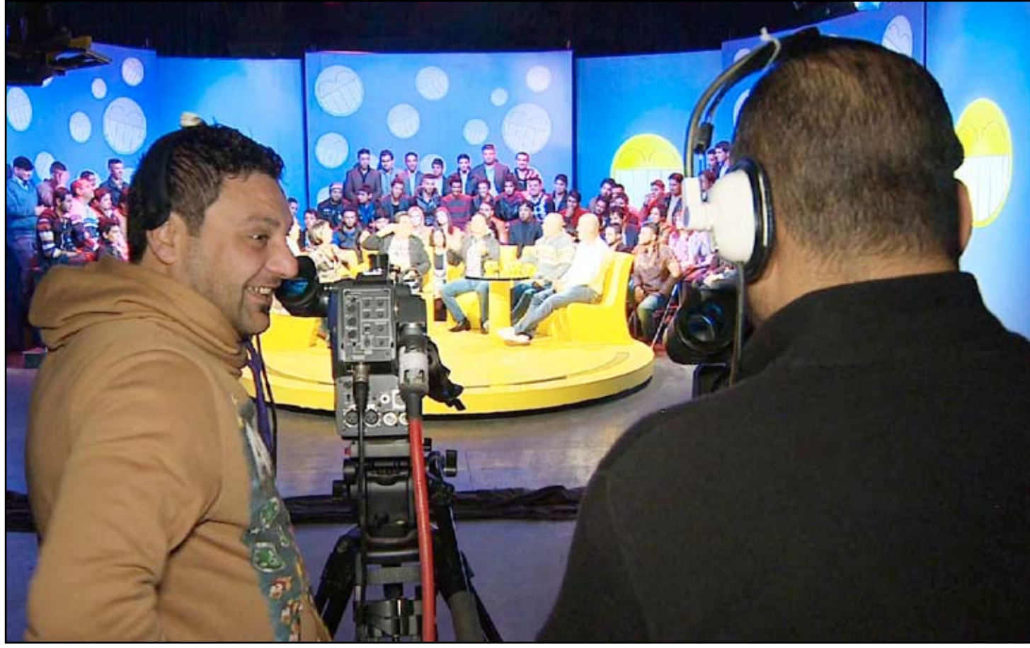
استديو البرنامج الكوميدي (اكوفد واحد) الذي تبته محطة السومرية

البرنامج اضطر لتغيير نهجه حتى يتمكن من مواصلة بث البرنامج. ويقول: "غيرنا أشياء في البرنامج، ويوضح "كان عندنا دي جي نسائي، لكن طلبوا منا إلغاه من العرض، وقلنا. "حتى في العراق الجديد، كما يقول ما زالت هناك "خطوط حمراء كثيرة لا يمكن تخطيها في المزاح والترفيه. ويقول "لو لم تكن هناك محددات مفروضة علينا، لكان