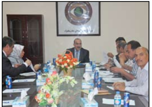
جانب من اجتماع شباب كركوك

■ شاركت مديرية شباب ورياضة كركوك في إطار التعاون مع مركز الأمن الوطني في مؤتمر الحد من ظاهرة المنشطات التي يتعاهاها الشباب والذي اقيم في قاعة مديرية الامن الوطني في كركوك بحضور اعضاء مجلس محافظة كركوك ومسؤول اعلام مديرية الشباب والرياضة وممثل عن الصحة ورئيس المظلية الاولمبية ورئيس اتحاد بناء الاجسام. ويهدف المؤتمر الى الحد من ظاهرة المنشطات التي يتعاهاها الشباب خلال ممارستهم الرياضية حيث لوحظ في الونة الاخيرة انتشار هذه الظاهرة، وتم تشكيل لجنة خماسية من المدعويين لوضع