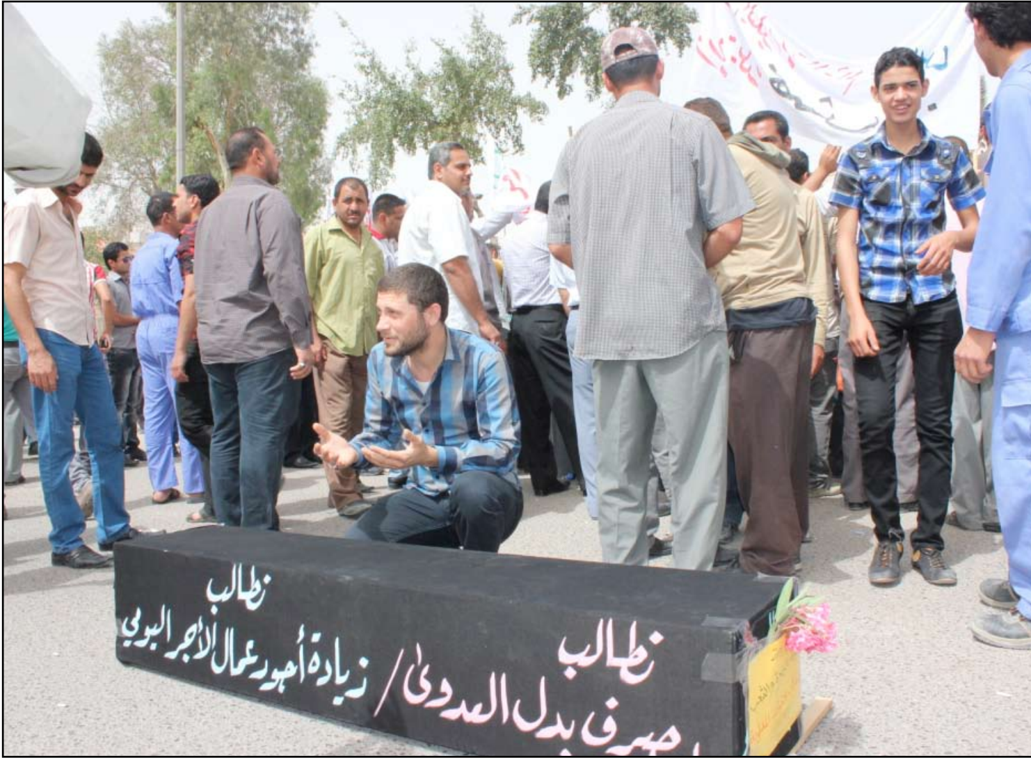
موظف في بلدية البصرة يقرأ الفاتحة على نعش حقوقه

بدوره قال معاون محافظ البصرة لشؤون الخدمات علي حسن عزيز في حديث لـ (المدى برس)، إن "مطالب المتظاهرين التي تخص الحكومة المحلية هي ما تتعلق بصرف المكافآت وساعات العمل الإضافية، التي يتم صرفها بشكل طبيعي وفق الاستحقاق لجميع المنتسبين"، مؤكداً أن "تعديل سلم الرواتب وصرف مخصصات الخطورة والعدوى وموقع العمل هي من