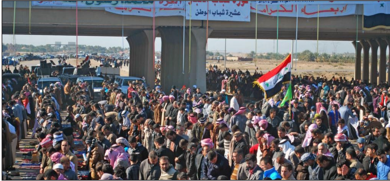
جانب من تظاهرات الرمادي