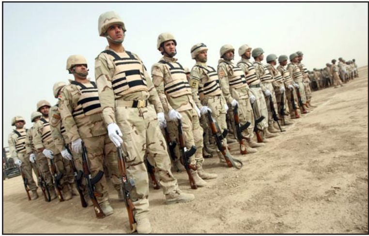
الجيش العراقي .. (أرشيف)

وأكد المصدر في اتصال مع "المدى" أمس أن عمليات تهريب الأسلحة ازدادت خلال اليوين الماضيين، مما جعل قوات الجزيرة تطلب معونات من وزارة الدفاع لملاحقة المجمع