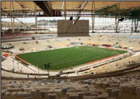
البرازيل تلن جاهزية ماراكانا للافتتاح

هذا اليوم حضور ستة آلاف من العاملين الذين شاركوا في تحديته وأقاربهم. وأوضح الاتحاد أنّ حضور