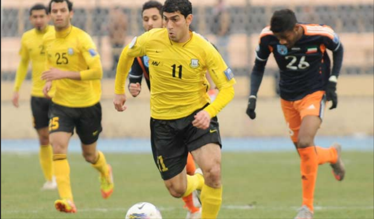
أربيل يهز شيكاف فنجان بالاربعة