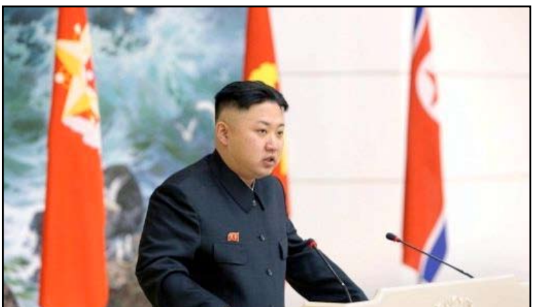
كيم جونج أون

وكان القصد من ذلك حينها التأكيد للعالم على عملية انتقال ناجحة وولاء القوات المسلحة للرجل القوي الجديد الذي يفقثر إلى الخبرة، والذي يقل عمره عن الثلاثين عاماً. وبعبارة أخرى التأكيد على استمرارية سياسة الوالد العسكرية عبر نجله، ورأت كيتي اوه من مركز الأبحاث الدفاعية في الكساندريا بولاية فرجينيا (شرق الولايات المتحدة) أن "من خلال إحاطته بأعلى العسكريين رتبة يكسب