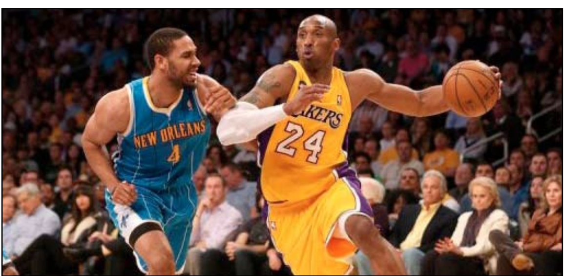
التأهل إلى الدور الاقصائية تشهد منافسة ساخنة في دوري المحترفين

ترافقت مع ارتباك دفاعي وركبته وخروج خاطيء من كاباييرو فوضعها في الشباك مدركاً التعادل (١٠٩٠).