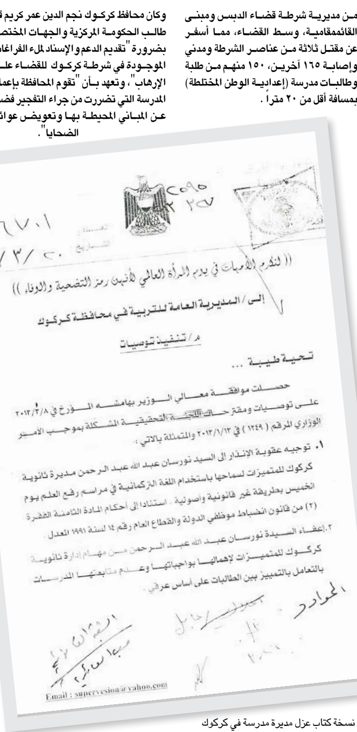
نسخة كتاب عزل مديرة مدرسة في كركوك

وأوضح توران أن هذه الظاهرة مخالفة للدستور العراقي وقرارات المحكمة الاتحادية العليا التي نصت على جعل اللغة التركمانية لغة رسمية في محافظة كركوك إلى جانب العربية والكردية والسريانية مع الأسف الشديد وزارة التربية أرسلت كتاباً بإعفاء مديرة مدرسة كركوك للتميزات من منصبها لاستخدام اللغة التركمانية في مراسم رفع العلم".