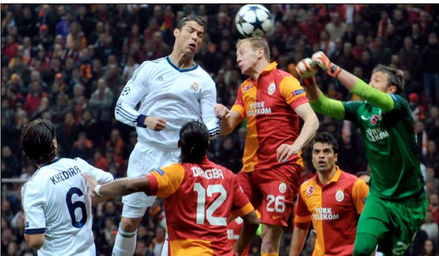
غلطة سراي يفسد فرحة الريال بالتأهل إلى نصف النهائي

وعزز دروغبا بالتالي بطريقة رائعة عندما تلقى كرة من الدولي المغربي نور الدين أمرباط، بديل حميد التيجنوب، فتابعها بكعب قدمه اليمنى وأسكنها على بين الحارس لوبيز (٧٢). وكاد رونالدو يقلص الفارق من تسديدة قوية من داخل المنطقة فوق العارضة