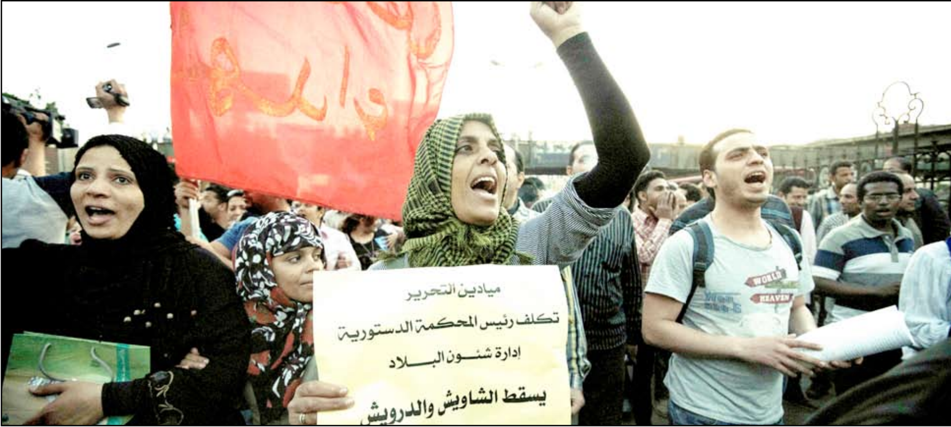
مظاهرة تحمل لافتة تندد بحكومة مرسي اثناء مسيرة تضامناً مع الكنيسة القبطية ( ا.ف.ب)

بديهياً أن التوافق على سلام رئيساً للحكومة لا يعني التوافق بين أطراف العمل السياسي، المهم أنه برّد لهيب الاحتقان الطائفي، ودفع إلى الإرضوخ لفكرة التوازن في اللعبة السياسية، وبات مؤكداً أن تيار المستقبل سيسعى لاستعادة دوره الذي حاول شيوخ السلفية التفرّد فيه، كما بات مؤكداً أن حزب الله اقتنص الفرصة لمنع توريطة في معارك جانبية، تمنعه من أداء دوره السوري، وإذ تعوينا على أن رمال السياسة اللبنانية متحركة باستمرار، فإن علينا توقع عدم التوافق بين القوى المتصارعة، وعدم إنجاز تأليف حكومة سلام بالسرعة المأمولة، كما أن التطورات الإقليمية ستكون عاملاً في تطويل فترة التأليف، بانظار حسم الملفين السوري والنووي الإيراني.