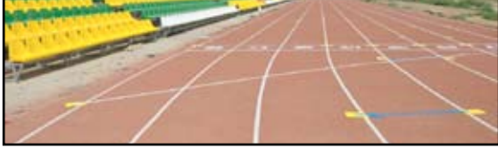
إنجاز مضمار الشعب