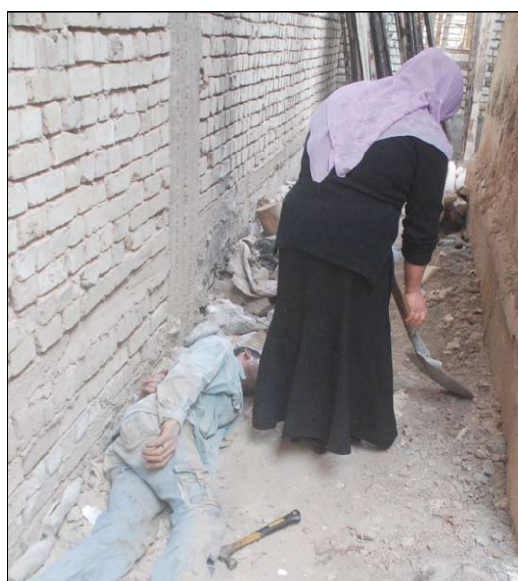
محاولة إخفاء معالم الجريمة

الخطة كانت تقضي بترك الزوجة الباب مفتوحا لكي يدخل العشيق إلى منزل المجني عليه ويرتكب جريمته بواسطة قطعة حديد(بوري)وضعتته له