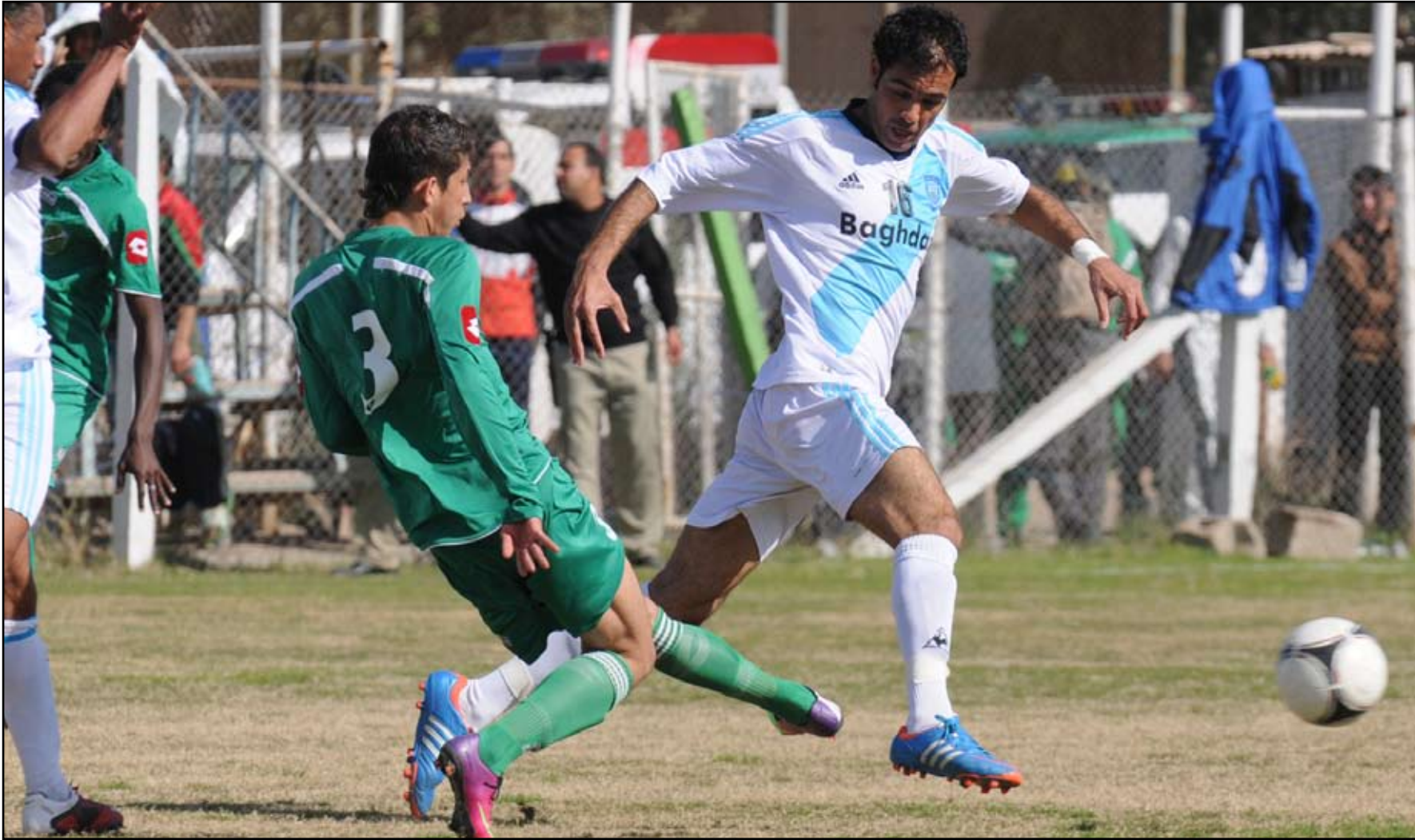
لقاء مشير يجمع الشرطة بضيافة النجف

ويخوض النفط السبت ايضا لقاء مطلباً فيه تأكيد فوزه الاخير على النجف باربعة اهداف وهو يلقي زاحو على ملعب الاخير الذي يأمل ان يستفيد من جمهوره وارضه وتخطي