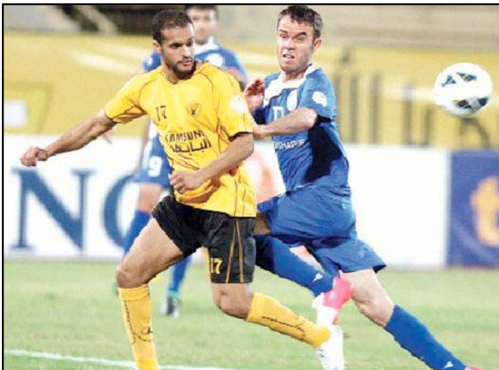
المطوع يحسم لقاء رافشان

وفي المجموعة الثامنة فاز ايست بنغال الهندي المنصهر (عشر نقاط) على المتذبل (نقطة واحدة) تامبينس روفرز السنغافوري 2-1، وسيلانغور الماليزي الثالث (أربع نقاط) على وصيف المجموعة (7 نقاط) نافي بانك سايعون الفيتنامي 3-1.