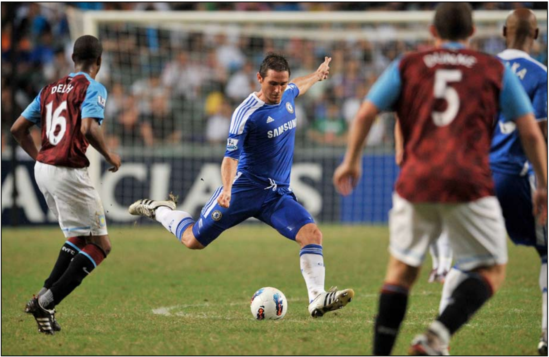
فرصة تشيلسي لمواصلة مشواره في الدوري الأوروبي

يذكر ان روبن تاهل الى ربع نهائي المسابقة لأول مرة في تاريخه وأطاح