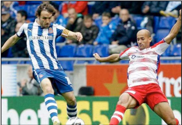
فالنسيا يتغنى امام سوسبيداد

الجمعية العمومية للاتحاد الآسيوي وحضور انتخابات رئاسة الاتحاد وعضوية المكتب التنفيذي. وتأتي تحركات أحمد وشقيقه طلال من أجل حصد أكبر دعم ممكن إلى سلمان بن ابراهيم قبل التوجه لصناديق الاقتراع في ٢ أيار المقبل. وكانت المساعي الأخيرة التي كان قد قام بها الأمير علي بن الحسين من أجل عقد اجتماع بين الثلاثي المرشح للرئاسة البحريني سلمان بن ابراهيم والإماراتي يوسف السركال والسعودي د.حافظ المدجج، قد باءت بالفشل. ومن المقرر أن يعقد اليوم اجتماع ثنائي بين المدجج والسركال ويضم لهما مرشح المكتب التنفيذي القطري حسن الذواوي، وتشير التوقعات إلى انه سيتم من خلال الاجتماع الاعلان عن انسحاب احد المرشحين من سباق الوصول لسدة الاتحاد الآسيوي لكرة القدم.