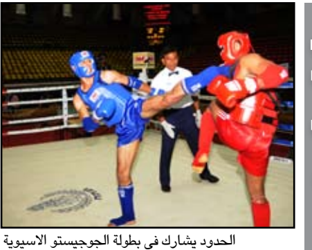
الحدود يشارك في بطولة الجوجيستو الآسيوية

■ أعلن الاتحاد العراقي المركزي للجوجيستو عن مشاركة بطل الدوري المحلي فريق الحدود ببطولة الآسيوية التي ستقام في العاصمة الماليزية كوالالمبور مطلع الشهر المقبل وتستمر لغاية السابع من الشهر نفسه . وقال رئيس اتحاد اللعبة الدكتور مخلص حسن ان بطل الدوري المحلي فريق الحدود سيكون ممثلاً للعراق في بطولة الآسيوية التي ستقام في ماليزيا، مشيراً الى ان فريق الحدود سبق وان شارك في النسخة الماضية في الهند وتمكن من الفوز