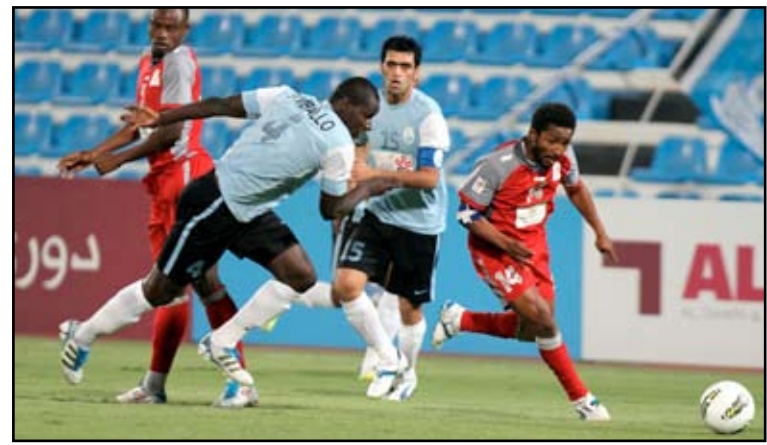
الاهلي العائد للدوري القطري يطيح بالوكرة

واختتم المدرب حديثه قائلاً " ساضل ادفع في اللاعبين للأمام حتى نحصل على اللقب رسميا وهم يعلمون ذلك جيدا فنحن لم نتوج بعد " .