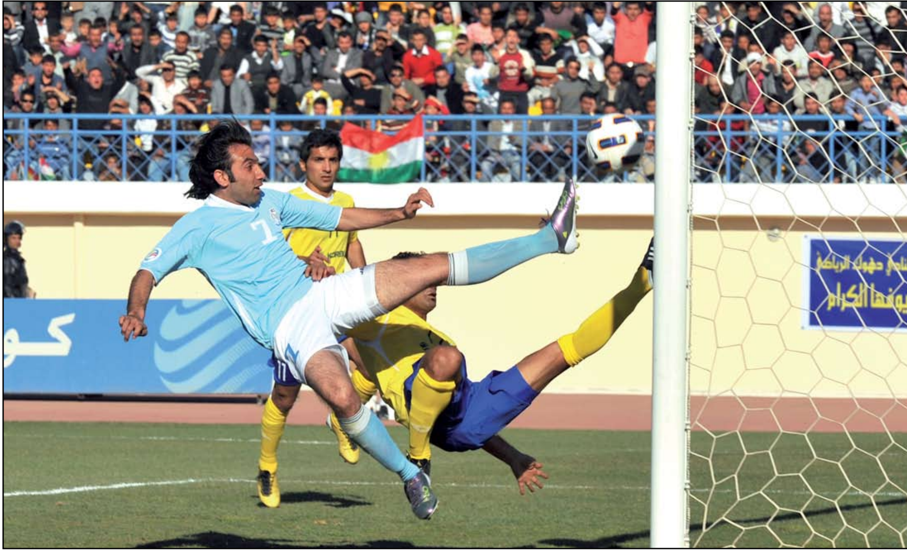
دهوك يأمل رد اعتباره امام الفيصلي