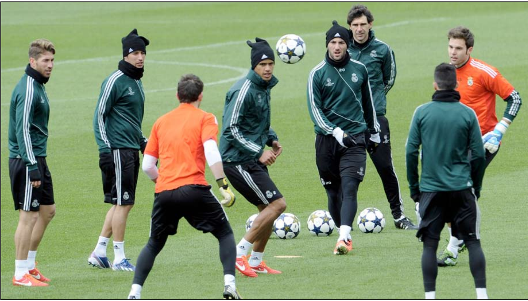
ريال مدريد يبحث عن الخروج من عنق الزجاجة

ريال يتابع بقلق الحالة البدنية للمحاربين، بدت صحيفة ماركيا لرونالدو، مشاركة البرتغالي لا تزال غير مؤكدة في هذه المباراة