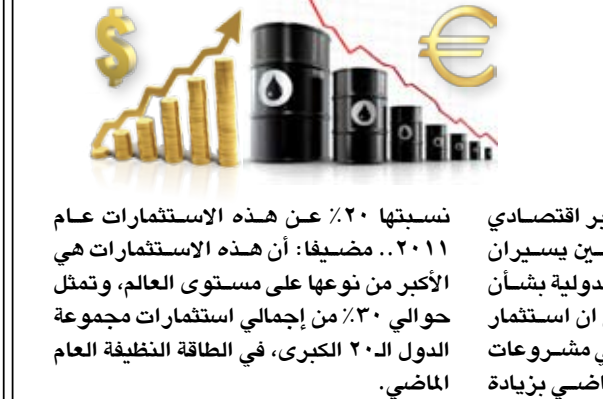
نسبتها ٢٠٪ عن هذه الاستثمارات عام ٢٠١١.. مضيفاً: أن هذه الاستثمارات هي الأكبر من نوعها على مستوى العالم، وتمثل حوالي ٢٠٪ من إجمالي استثمارات مجموعة الدول الـ ٢٠ الكبرى، في الطاقة النظيفة العام الماضي.

تصدرت تقارير إخبارية أمس الاثنين أن الصين تتصدر دول العالم في التوسع في استثمارات مشروعات الطاقة المتجددة للوفاء بالتزاماتها الدولية من أجل مكافحة ظاهرة التغير المناخي.. ونقلت وكالة أنباء الصين الجديدة شينخوا عن تقرير للجنة