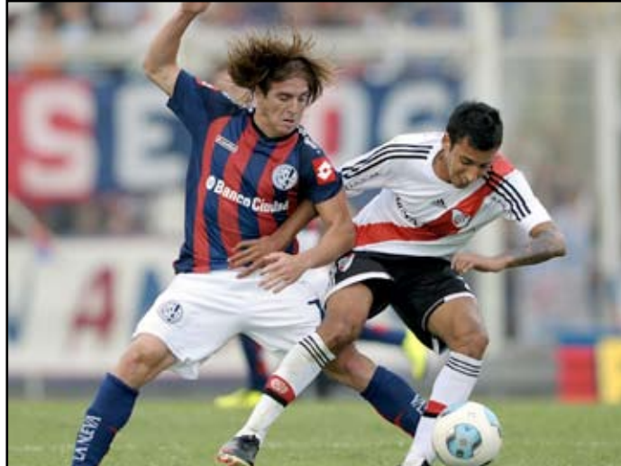
اندبدينتي ينهي مسلسل تقهقره

وضع العملاق المتعثر اندبدينتي حدا لسبع مباريات متتالية من دون فوز بانتصاره على ارجنتينوس جونيورز ١-٣ لينعش أمله في تجنب الهبوط من دوري الدرجة الأولى الارجنتيني لكرة القدم. ويواجه اندبدينتي صاحب الرقم القياسي في التتويج بطلا لأمريكا الجنوبية برصيد سبعة ألقاب والذي يحتل حاليا المركز ١٤ في ترتيب المرحلة الثانية من المسابقة برصيد ١٢ نقطة