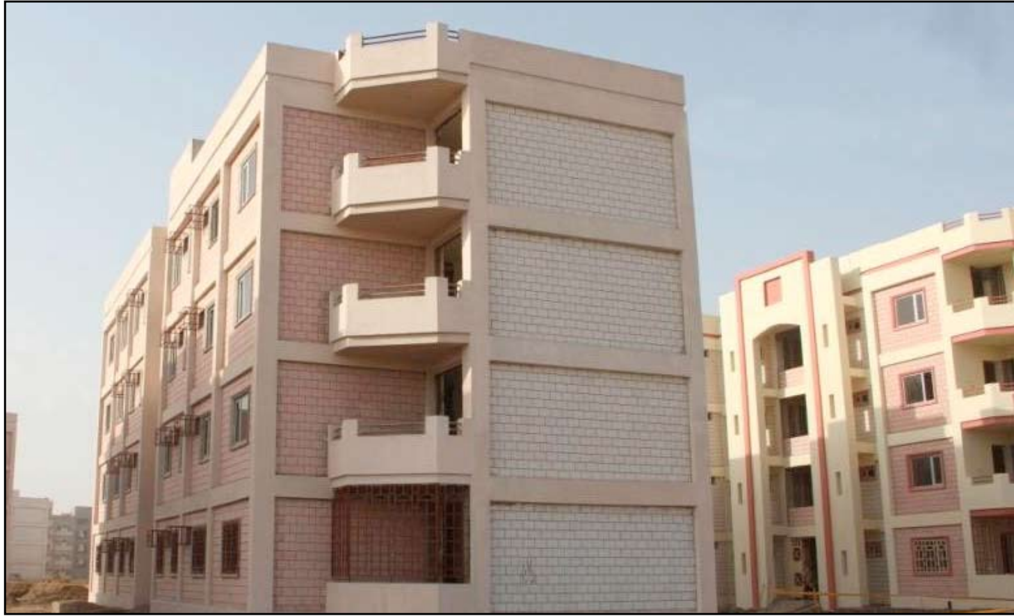
مجمع سكني في ذي قار

بشيرة الهبيات التابعة للأمم المتحدة، بالتنسيق مع اللجنة الوطنية للمستوطنات البشرية في العراق، بإعداد دراسة حول الحاجة الإسكانية لها لتكون أساساً لوضع إستراتيجية للإسكان في العراق. وكانت هيئة الاستثمار الوطني أعلنت في الرابع من تشرين الأول الماضي، أن ١٢٥ شركة من جنسيات مختلفة قدمت عروضاً لإنشاء مليون وحدة سكنية في عموم المحافظات العراقية، في إطار مشروع الإسكان الوطني، على أن يتم اختيار ٣٥ شركة من بينها لتنفيذ المشروع وفي حين كشفت وزارة الإسكان عن سعيها لإنشاء مليون وحدة سكنية إضافية في حال إنجاز المرحلة الأولى من المشروع المذكور.