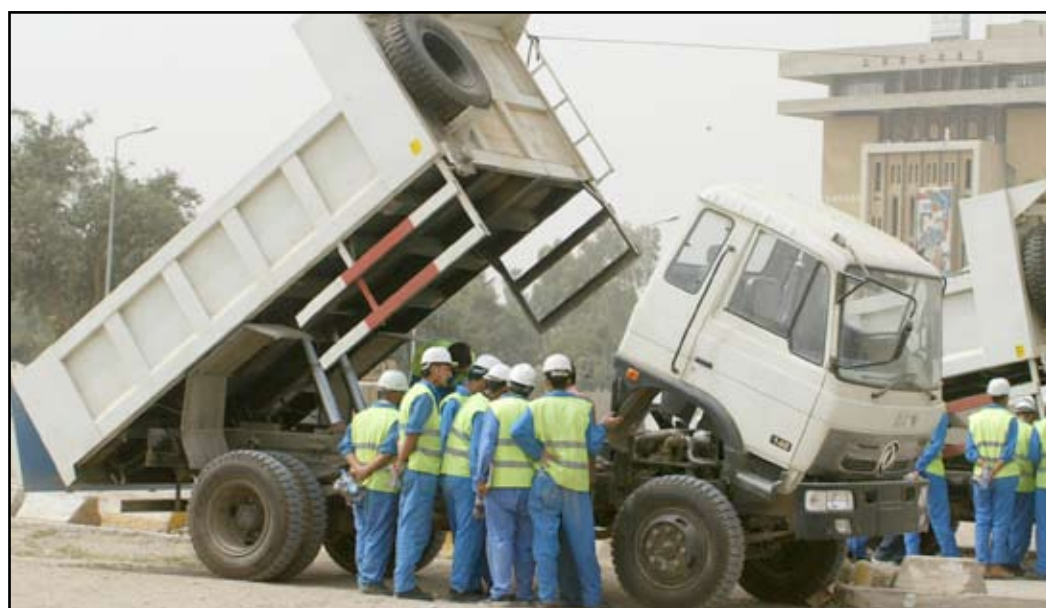
ورشة عمال التنظيف

العمال العراقيون يستحقون الكثير، فعيدهم هذا يرمز الى النضال ضد كل أشكال الاستغلال والاضطهاد والقهر، ويشكل لطبقتنا العاملة العراقية حافزاً ومعيناً لا ينضب في نضالها الشاق في الوقت نفسه يشكل مناسبة لتصعيد النضال من أجل تحقيق المطالب العادلة والمشروعة لعمالنا أيضاً كانوا. وكذلك يأتي هذا اليوم تأكيداً للدور التاريخي والمستقبلي لهذه الطبقة الجماهيرية المنظمة والمتكاملة والتي دونت صفحات مشرقة ومنارات ساطعة لمسيرة كفاح متواصلة من أجل بناء مستقبل مشرق يعبر عن ثمره نضال طبقتنا الكادحة وتضحياتها. وبهذه المناسبة السعيدة، بمناسبة عيد العمال العالمي.