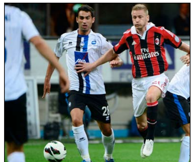
ميلان ينجو من فضيحة امام كاتانيا

ليجروتالي ولكن ماثيو فلوميني أدرك التعادل لميلان في نهاية الشوط الأول. وتمكن غونزالو برجيسيو من تسجيل الهدف الثاني للفريق الضيف في الدقيقة ٦٥. لكن ميلان لم يستسلم وحسم الفوز بهدفين حملا توقيع جيانباولو باتزيني في الدقيقتين ٧٤ و٧٧.