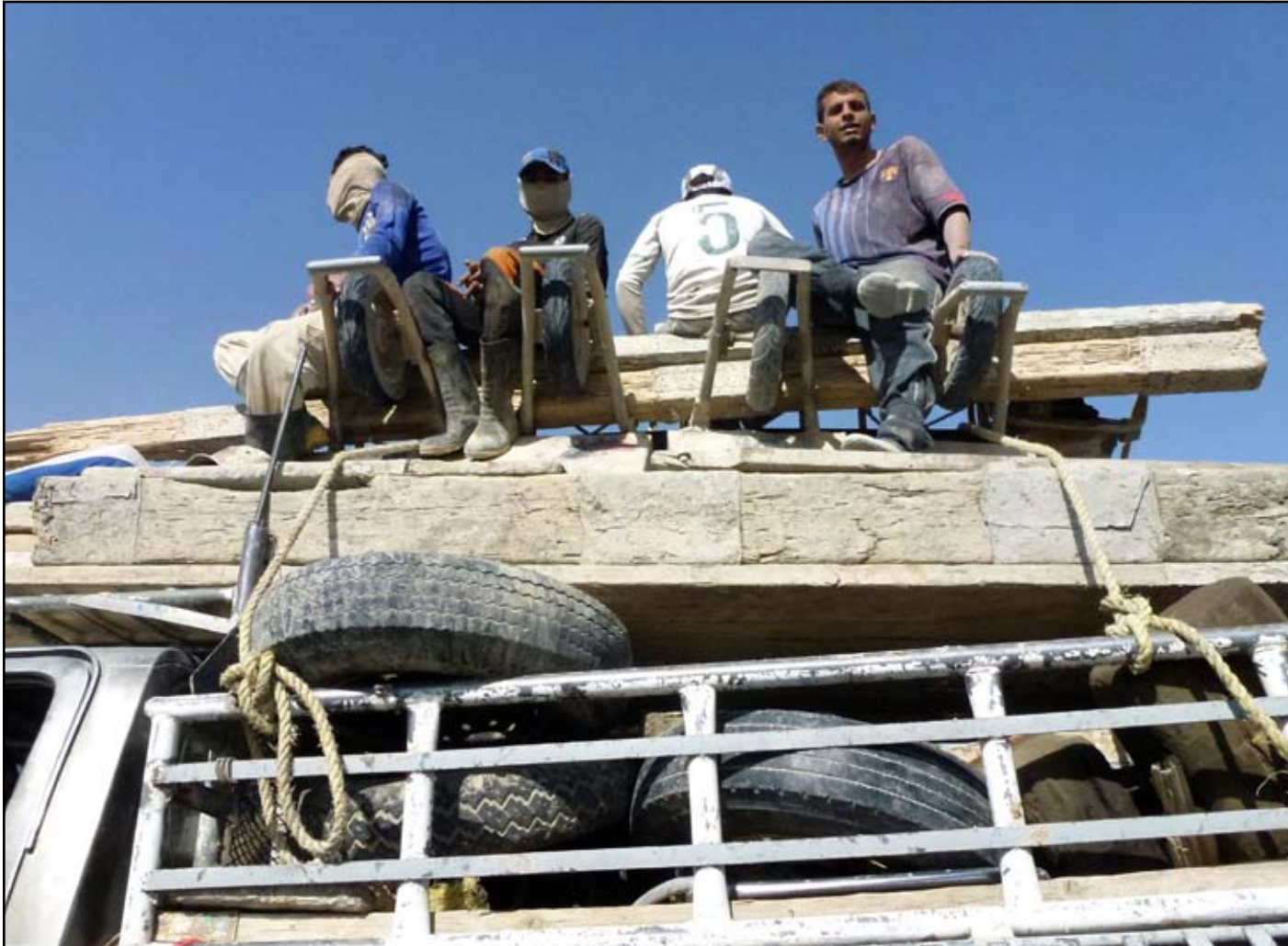
في طريقهم الى العمل

هل يمكن ان يكون حال عمال العراق هكذا بعد التغيير؟ وحالتهم لا تسر ولا تليق بهم، فهم يشعرون بأنهم غرباء في وطنهم ولا يملكون شيراً فيه وتمنوا من ان تكون الجهات المعنية رفيعة بهم وتعطيهم الأولوية في التعامل لاسيما إنهم اليد العاملة الوطنية، التي ربما ستختفي مع الزحف الآسيوي، ويحتفل العمال في جميع أرجاء المعمورة بالأول من أيار عيداً عالمياً للعمال، ولفت الأنظار إلى دور العمال ومعاناتهم، والعمل على تأمين متطلبات عيش كريم لهم ولعائلاتهم.