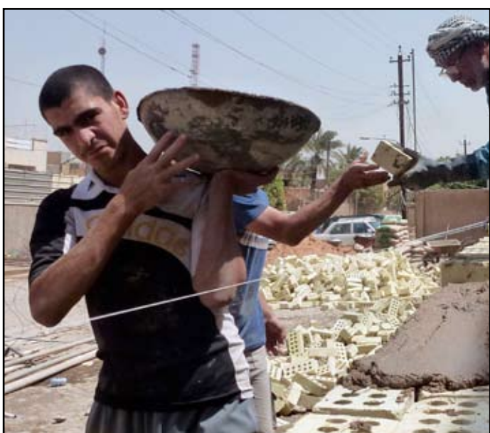
ظروف عمل بدائية

نتوجه بالتحية الى العمال والكادحين وكل شعوب العالم في نضالهم النبيل لبناء عالم جديد، تسوده قيم الديمقراطية والسلام والعدالة والتكافؤ والمساواة بعيداً عن الحروب والهيمنة