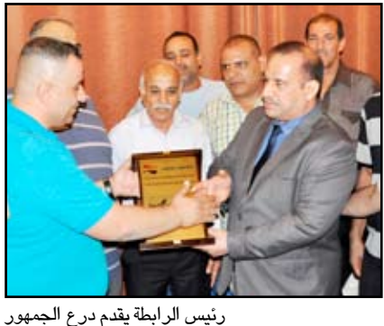
رئيس الرابطة يقدم درع الجمهور