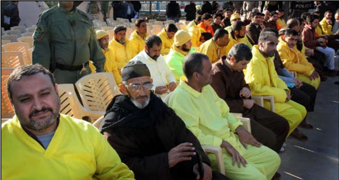
سجناء ينتظرون إطلاق سراحهم

وأوضح أن "ائتلاف دولة القانون يريد عدم شمول كل من ارتكب الجرائم التي ترتكب بدوافع الإرهاب ضد المدنيين أو العسكريين في حين بعض الكتل تريد استثناء جرائم القتل وهو محل خلاف أساسي فيما بينها". ولفت الى أن تشريع قانون العفو العام يحتاج إلى مزيد من الوقت بسبب الخلافات السياسية، مبيناً أنه من الممكن دمج مسودة اللجنة الخماسية ومقترح كتلة الأحرار بمشروع قانون العفو العام ورفع مجلس الوزراء وإرساله لمجلس النواب بعد توافق السياسي عليه ومن ثم تشريعه.