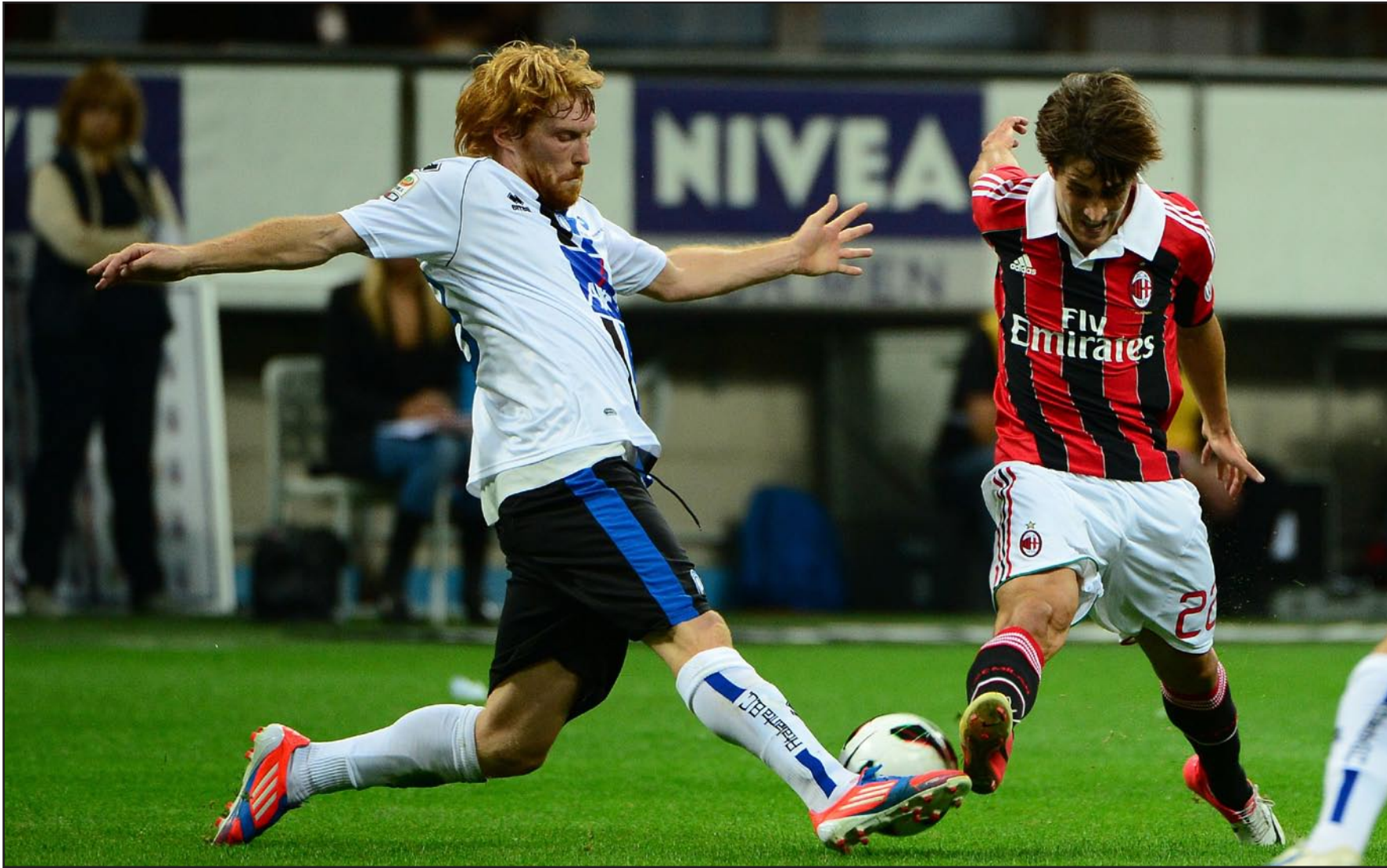
طموح مشترك بين ميلان وروما لقطع التذكرة الأوربية

ووعد روما نفسه مكتفياً بالبحث عن التأهل إلى الدوري الأوروبي، بعدما خسر على ملعب كييفو بهدف دون رد يوم الثلاثاء الماضي