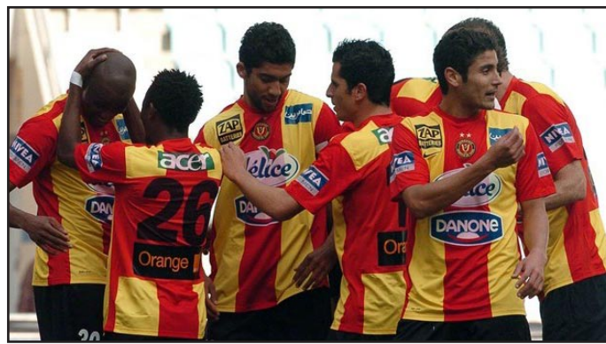
ثلاث نقاط مهمة للترجي في مرحلة التتويج