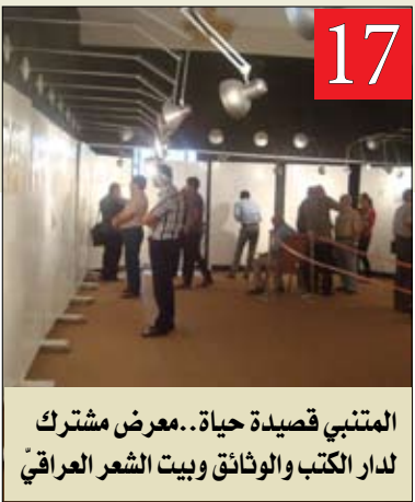
المتنبي قصيدة حياة... معرض مشترك لدار الكتب والوثائق وبيت الشعر العراقي