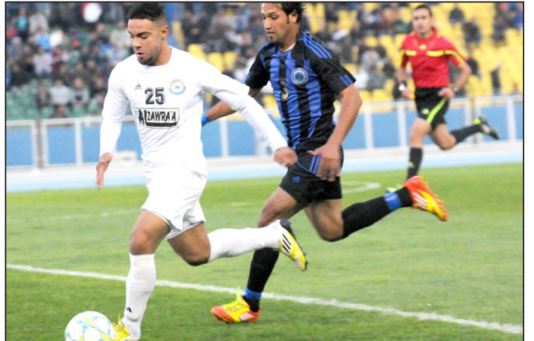
الزوراء يسعى لتعزيز مركزه في النخبة

وما يرفع من سقف الصراع والإثارة في لقاء الفريقين اليوم يتمثل بتواجد عدد من لاعبي منتخباتنا الوطنية في تشكيلتي الفريقين في بغداد خصوصاً حيث يضم عدداً من اللاعبين الدوليين يُنتظر منهم تقديم ما هو الأفضل مع فرقهم. وفي العودة لإحصائيات الفريقين نجد ان الزوراء خاض ٢١ مباراة حقق فيها الفوز في ١١ مباراة وتعادل في سبع مرات وخسر بثلاث مباريات ويمتلك ٢٩ هدفاً واهتزت شباكه عشرين مرة بينما حقق بغداد الفوز في ٨ مباريات من اصل ٢٠ مباراة وله ٢٠ هدفاً و دخلت مرماه ١٥ هدفاً وتعادل في سبع مواجهات وخسر في خمس مباريات.