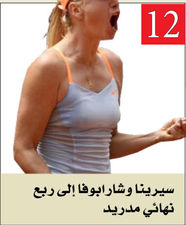
سيرينا وشاربوا إلى ربيع نهائي مدريد