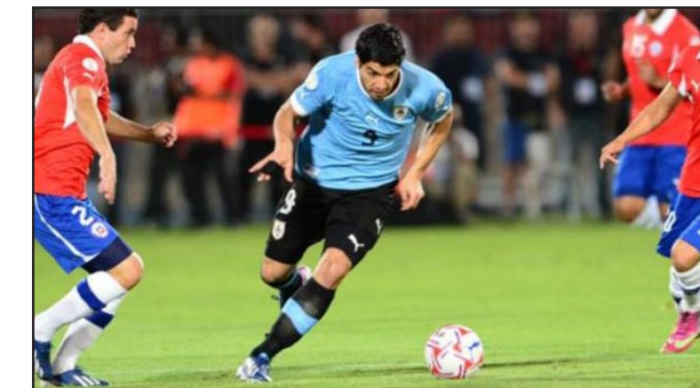
قضية سواريز تثار من جديد

وكان سواريز قد وجّه لكمة إلى خارا خلال المباراة التي خسرها مهاجم ليفربول ورفاقه (٢-٠) في آذار الماضي ضمن تدافعهما إثر ركلة ركنية للأورغواياني