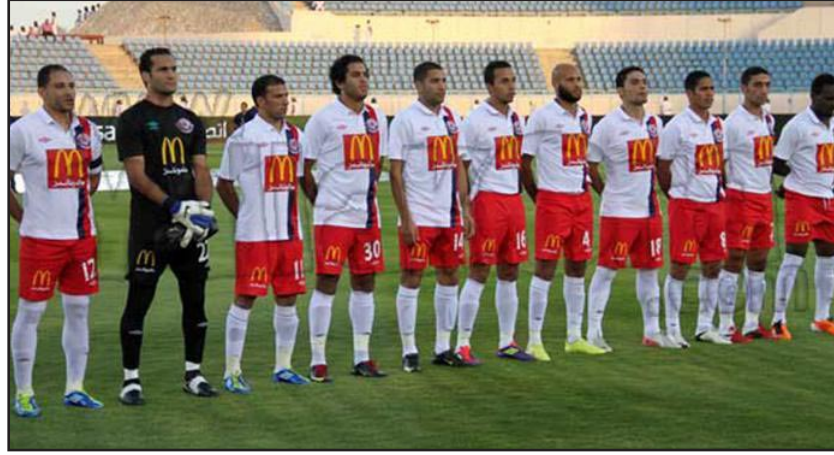
الزمالك يكيو امام بتروجيت

فيما رفع سموحة رصيده إلى ١٧ نقطة في المركز الثالث.