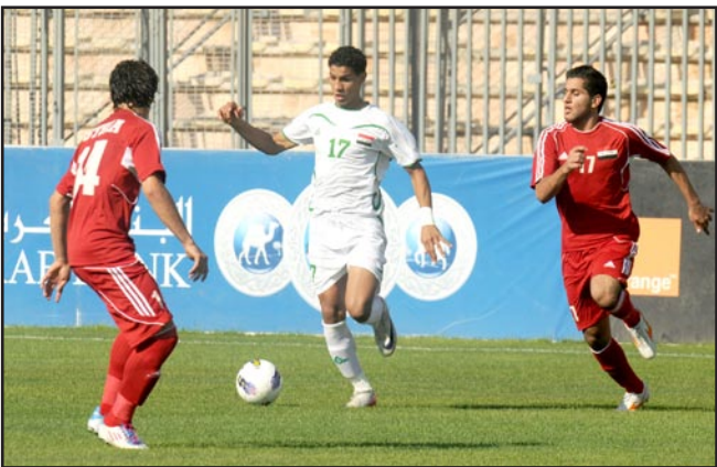
الشباب يواصل استعداده للمونديال

الاردني الشقيق يوم ٤ حزيران المقبل على ملعب الشعب الدولي في العاصمة بغداد. وأوضح زغير: ان منتخب الشباب سيسد الرحال يوم ٧ حزيران المقبل الى مدينة انطاليا التركية لإقامة معسكر تدريبي هناك يتخلله خوضه ثلاث مباريات ودية دولية مع منتخبات الأورغواي يوم ١٠ والسلفادور يوم