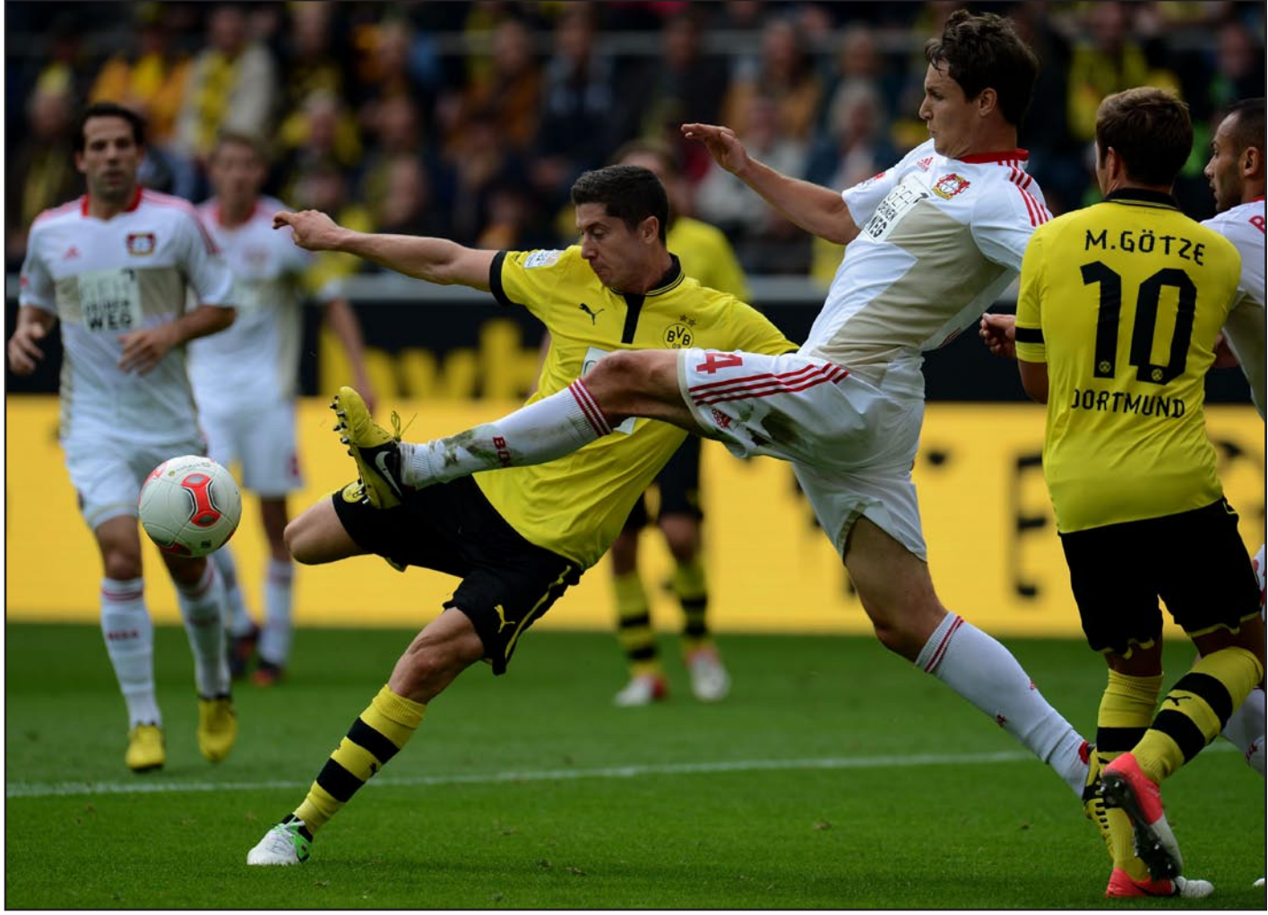
دورتموند يلتقي فولفسبورغ في البروفة الأخيرة قبل موقعة لندن

قبل اسبوع واحد من اختتام منافسات "البوندسليغا" لهذا الموسم التي ستصل محطاتها الأخيرة في الثامن عشر من الشهر الحالي، وكذلك قبل اسبوعين من "معركة" البافاريين والبروسيين في نهائي دوري الاندية لابطال الذي سيجتمع بايرن ميونيخ وبروسيا دورتموند والذي سيكون ملعب "ويمبلي" اللندني مسرحاً له في الخامس والعشرين من ايار الحالي قبل هذا كله يحل بروسيا دورتموند صاحب مركز الـصيف برصيد ٨٥ نقطة اليوم السبت "ضيفاً" على نادي فولفسبورغ صاحب المركز الحادي عشر برصيد ٤١ نقطة في افتتاح مباريات الجولة ٣٣ من المنافسات التي ستكون "البروفة" قبل الأخيرة للذهاب الى لندن ومواجهة بايرن ميونيخ في واحدة من المباريات النهائية التاريخية لـ"الشامبيونز ليغ" التي ستجمع ناديين من بلد واحد للمرة الرابعة في تاريخ المسابقة الأوقى والأجل والأهم في القارة الأوروبية.