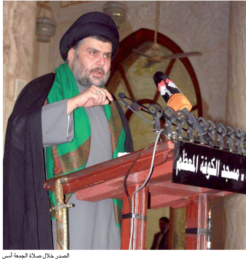
الصدر خلال صلاة الجمعة أمس

وفي جانب آخر من الخطبة طالب الصدر ذوي الضحايا الذين سقطوا في أعمال العنف طيلة الأعوام الماضية، إلى "مقاضاة كل من قام باستيراد أجهزة السونار إلى البلاد".