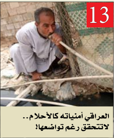
العراقي أمنياته كالأحلام... لا تتحقق رغم تواضعها