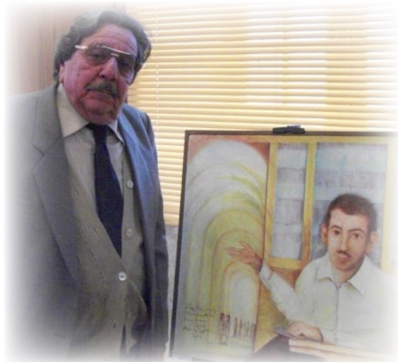
الهيبي مع لوحة السياب

تناوله في موضوعنا هذا. والهيبي رسام غير تجاري لا يبحث عن ربح أو بيع لوحة كي يستفيد منها، بل هو يرسم لإرضاء ذاته والتعبير عن هواجسه وخلجاته، ويجمع لوحاته في منزله محملاً عائلته عيناً كبيراً، وعيناه متجهتان نحو صوب (متحف سبتي الهيبي) الذي يزعم إقامته في مسقط رأسه (هيبي)، بعد أن منحه السيد رئيس الجمهورية قطعة الأرض لإنشاء المتحف عليها، وهو ينتظر دعم الدولة في ذلك حتى تتحقق أمنيته في حياته وليس بعد ممانته.. وقد أوصى الهيبي أولاده بأن لا يبيعوا لوحاته بل يحتفظون بها اعتزازاً