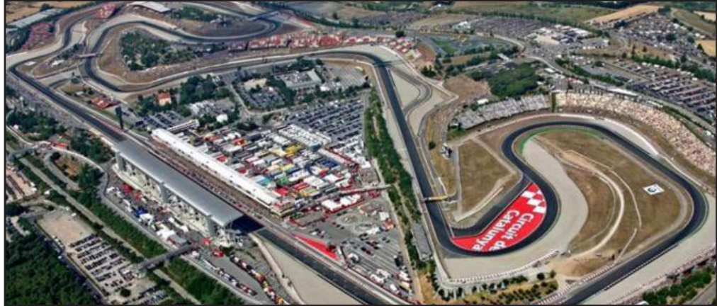
حلبة كتالونيا تشهد السباق الأروبي

فريق ريد بول حيث خالف فيتل تعليمات فريقه وخطف الفوز من زميله الأسترالي مارك ويبر في ماليزيا، إلا أن الفيتر