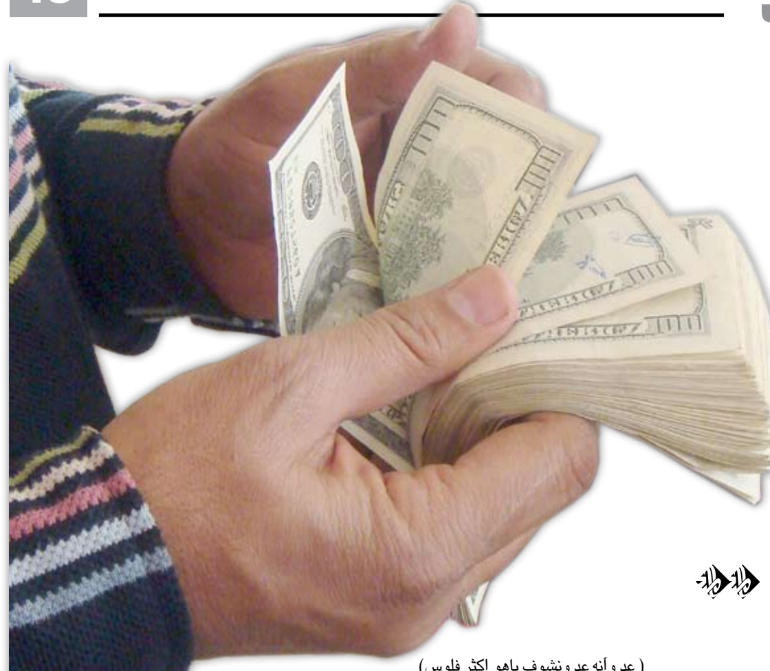
(عد وأنه عد ونشوف ياهو أكثر فلوس)

□ بغداد / يوسف المحمداوي