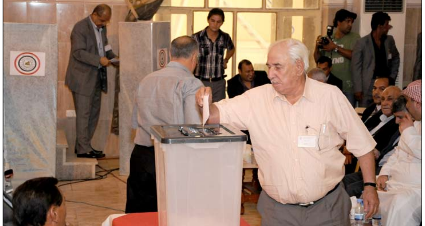
الانتخابات السابقة لاتحاد الكرة