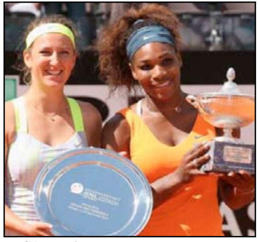
سيرينا تنهي دورة روما بلقب جديد

أحرزت الأميركية سيرينا وليامس المصنفة الاولى لقب بطلة دورة روما الدولية لكرة التنس، خامس دورات الألف نقطة للماسترز والبالغة جوائزها ٢,٣٦٩ مليون دولار للسيدات، بفوزها السهل على البيلاروسية فيكتوريا أزارنكا الثالثة ٦-١ و٦-٣ في المباراة النهائية. وهو اللقب الرابع على التوالي لسيرينا هذا الموسم بعد فوزها بدورات ميامي الأميركية وتشارلستون الانكليزية ومدريد الاسبانية، والخامس لها بعد فوزها مطلع العام بدورة بريزباين الأسترالية، كما أنه