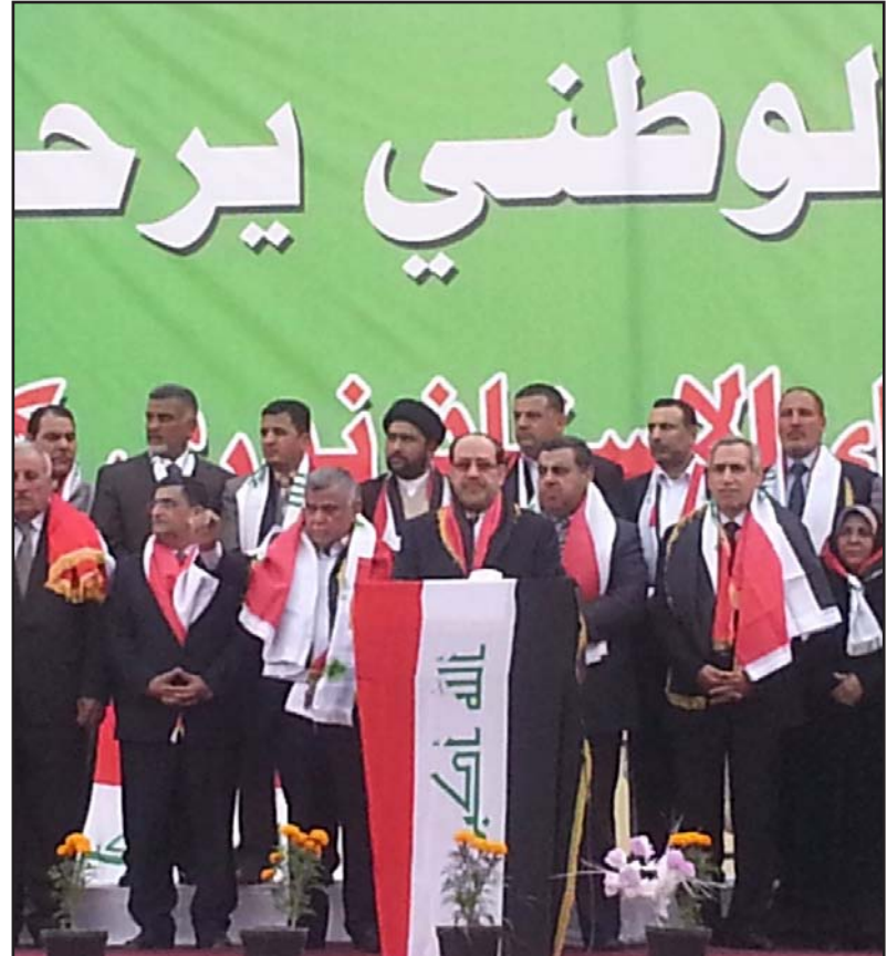
الملكلي خلال حملته الانتخابية في ديمالي...ارشفيف

وكانت كتل "عراقية ديمالي وائتلاف العراقية الوطني واقتلاف ديمالي الجديد وعازمون على البناء"، في ديمالي، أعلنت الاسبوع الماضي، تشكيل تحالف جديد يضم (١٤) مقعداً، فيما عدت ان التحالف بات الاحق باستلام منصب