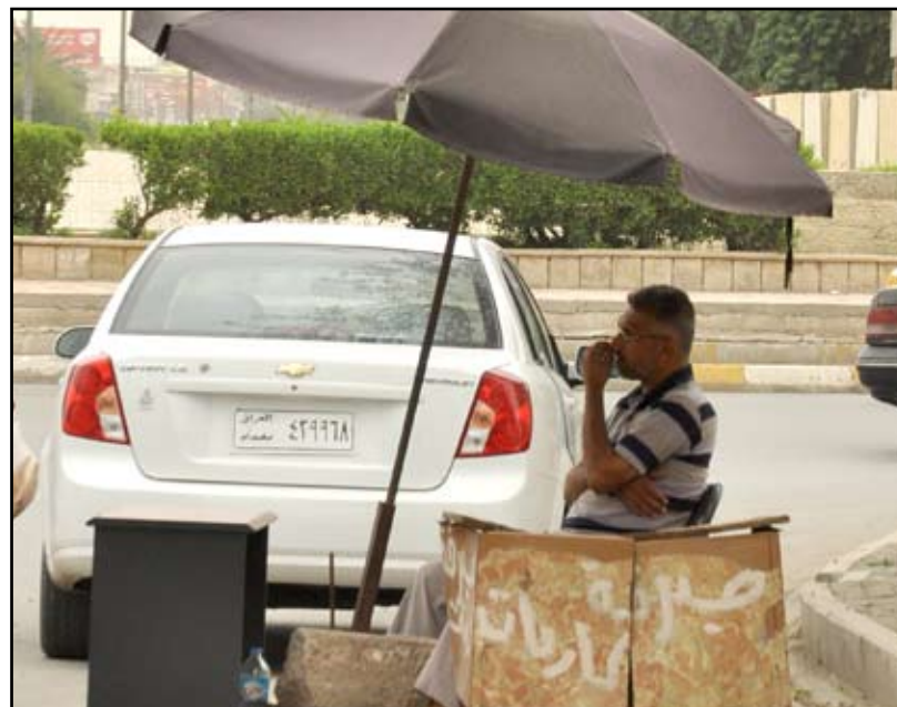
احد اصحاب الاكشاك