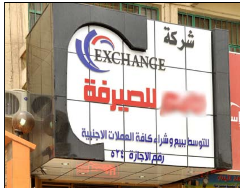
احدي شركات الصيرفة

اغلب شركات الصيرفة التي حاولنا الحديث معها رفضت التصريح تحت ذرائع عدة مثل غياب صاحب الشركة ونحن عمال وغير مخولين