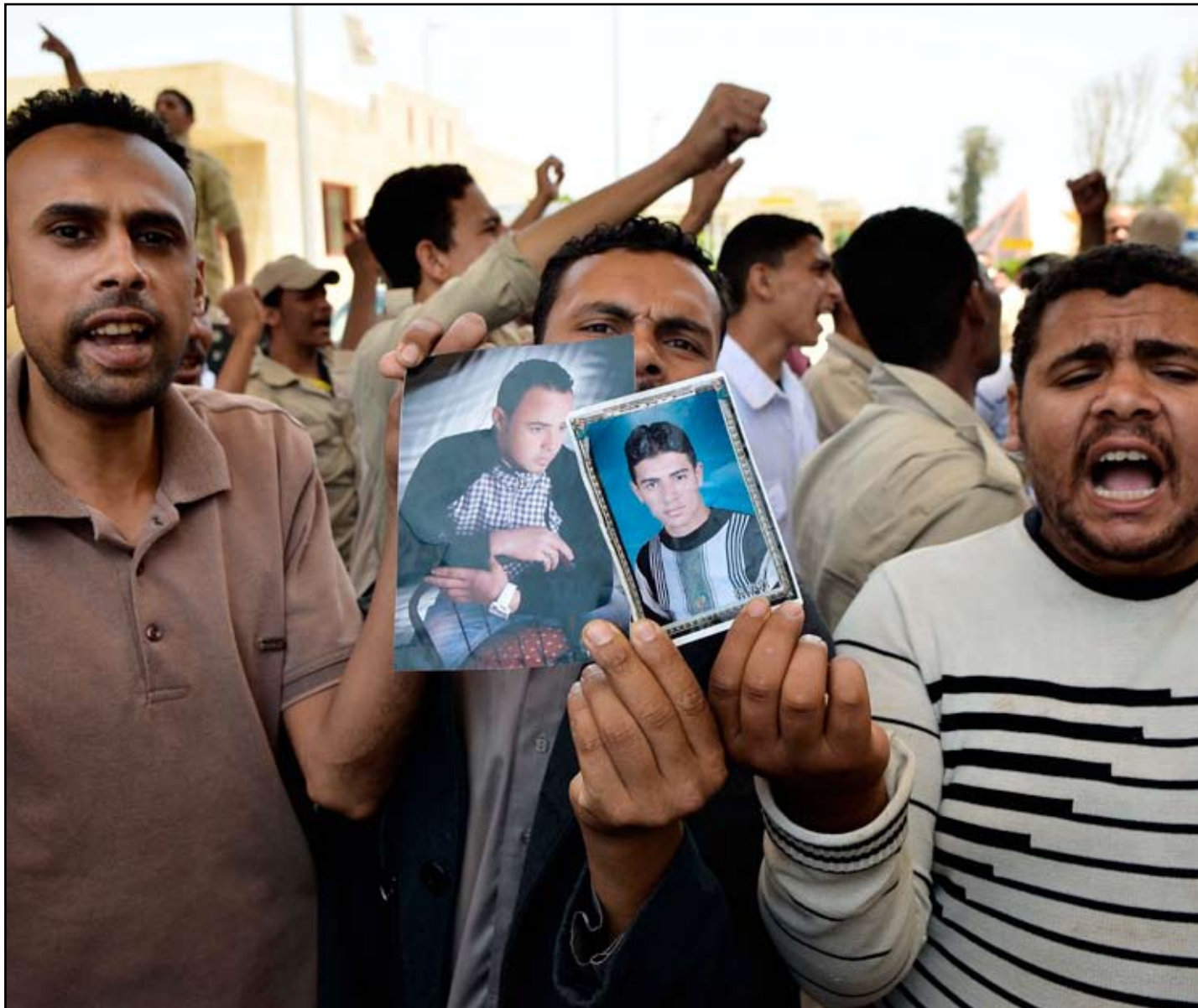
مصريون يرفعون صورة لجنود مخطوفين بالقرب من بوابة معبر رفح الحدودي بين مصر وقطاع غزة.. (أ.ف.ب)

أرسل الجيش المصري تعزيزات إلى شبه جزيرة سيناء يوم الاثنين بعد أن قال الرئيس محمد مرسي إنه لن تكون هناك محادثات مع متشددين إسلاميين خطفوا سبعة أفراد من قوات الأمن وقال مسؤول عسكري إن القرار جاء بعد اجتماع بين قيادات عسكرية ومرسي الذي قال إنه لن يذعن لابتزاز الخاطفين الذين يطالبون بالإفراج عن متشددين سجنوا بسبب هجمات وقعت عام 2011