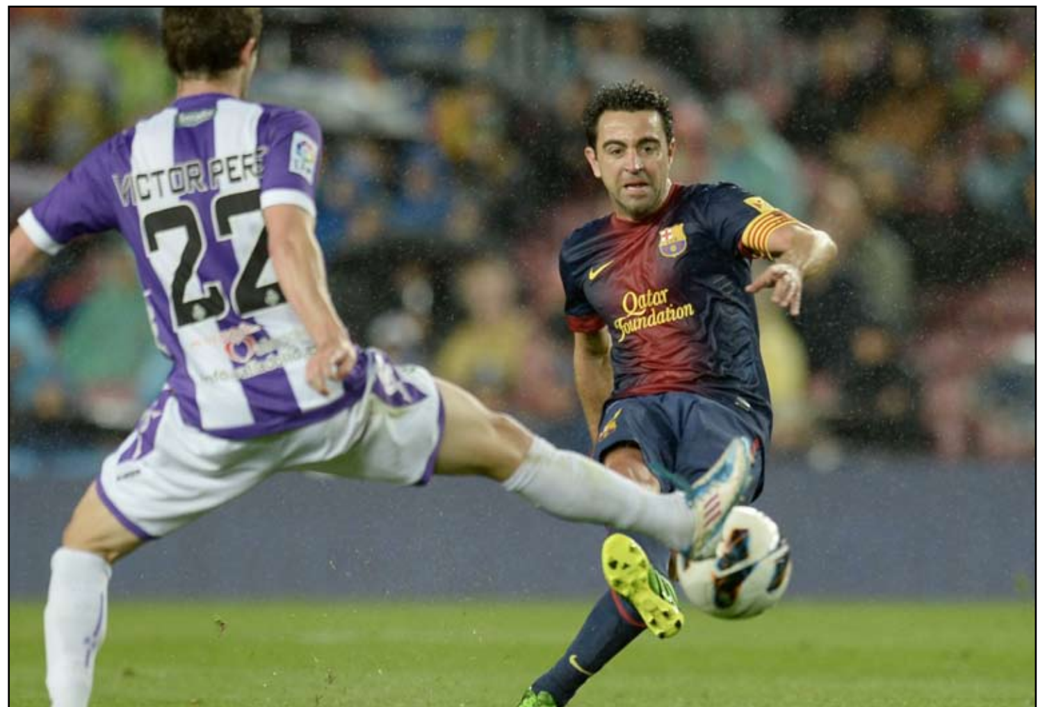
برشلونة يعبر بلد الوليد ويؤكد استحقاقه اللقب