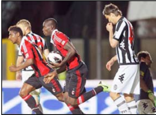
ميلان في دوري الأبطال