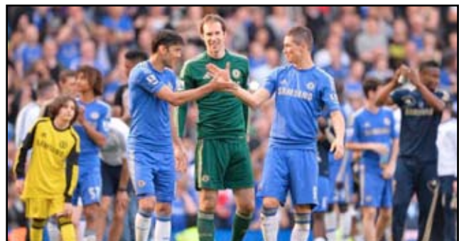
تشيلسي يدين بوصولة الى دوري الابطال للتوريس

استمرارها وأنهاها في الشباك (٧). وجاء ردّ إيفرتون سريعاً أيضاً (١٤) بعد أن مرّر النيجيري فيكتور أنيتشيبي كرة بينية تسلمها الاسكتلندي ستيفن نايسميت وركنها في أسفل الزاوية اليمنى لرمي الحارس الدولي التشيكي بيتر تشيك.