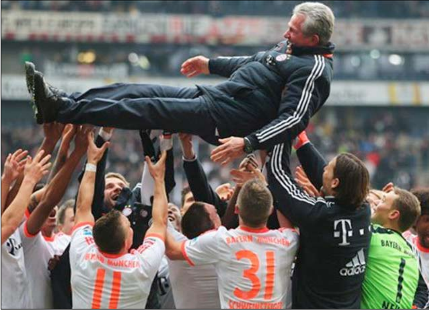
رجل الانتصارات على الاكتاف

وعدّ مدرب النادي يوب هاينكيس ٦٨ عاما البطل الاول في هذا الموسم ولاسيما بعد ان كان واضحا في عمله وتصرفاته وقراراته وخاصة عندما اعلن في فترة التوقف الشتوية عن قرار اعتزاله العمل التدريبي وقام بترتيب اوراق النادي البافاري وبناء فرقة الكروي بطريقة ستلعب دورا ايجابيا في تقديم يد العون للمدرب الاسباني بيب غوارديولا الذي سيسلم الراية في الاول من تموز المقبل خلفا للمدرب هاينكيس الذي حقق للنادي البافاري