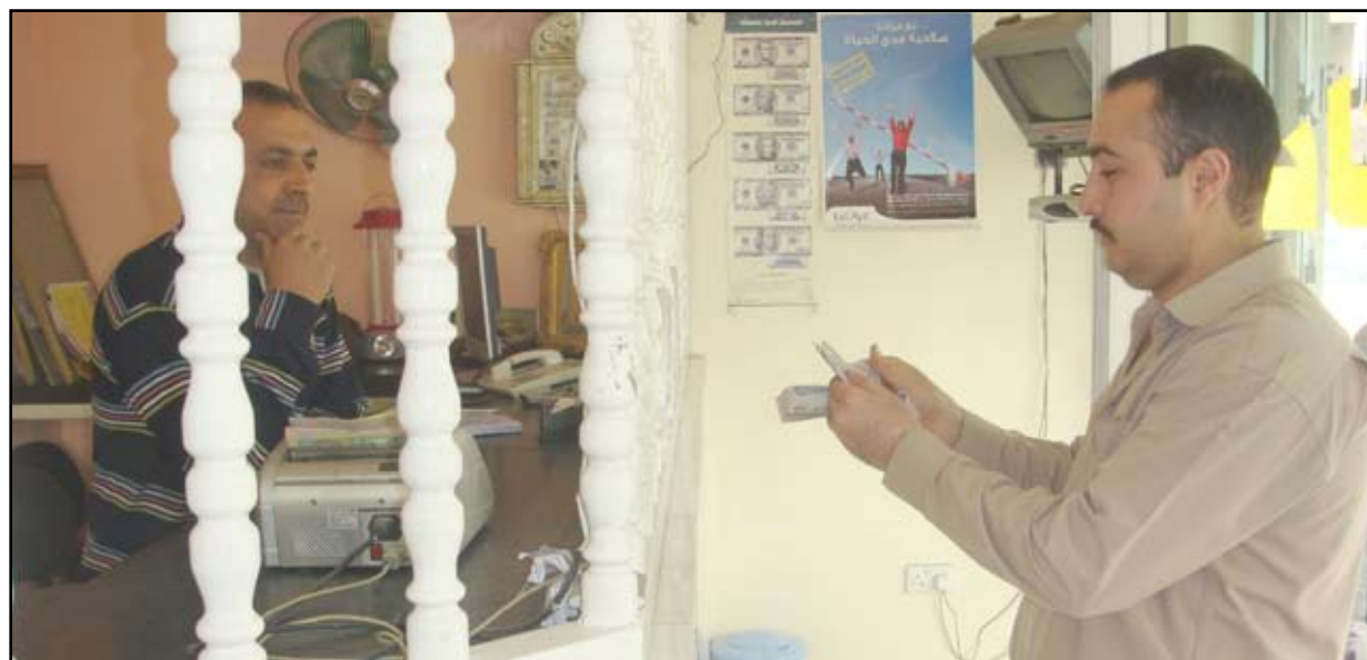
امام شباك احدي شركات التصريف

وأشار الصائغ إلى أن "مزيد بيع العملة كانت تعرض فيه من ٢٥٠ - ٥٠٠ مليون دولار، الأمر الذي يوفر سيولة مالية من الدولار أمام الدينار، ويسحب كميات من العملة المحلية، موضحة انه عندما يتم التعامل بموضوع الحوالات وهذه يتم حصرها بتداول الدولار، بمعنى تكون هناك سلعة مقابل هذه التحويلات، فإن هذا سيؤدي إلى تقليص نسب النقد السائل من الدولار في السوق وتحديد كمية الحوالات التي يتم التعامل بها، فهي مسألة عرض وطلب في السوق؛ كلما زاد المعروض قل السعر، وكلما قل العرض زاد السعر".