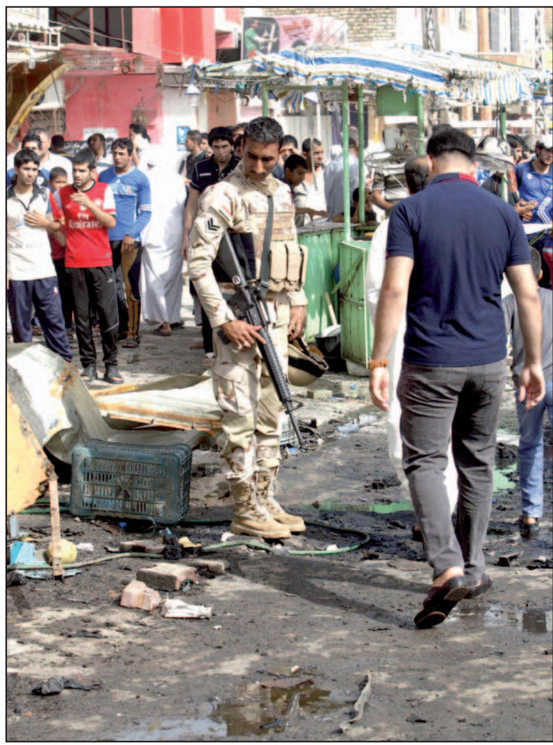
جنود يتفقدون مكان انفجار سيارة مفخخة انفجرت أمس..