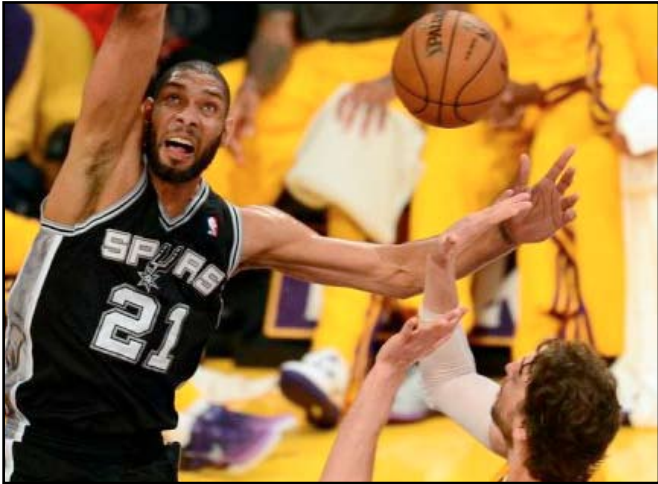
سلة سان انطونيو توصل تألقها في الدوري الاميركي

من ان ممفيس سيتسعيد توازنه". تقدم سان انطونيو على أوكلاهوما سيتي (٢-٠) في نهائي المنطقة الغربية العام الماضي لكنه تابع المباراة النهائية للبالي أوف أمام شاشة التلفاز. ولم يقدم نجم ممفيس زاك راندولف مستواه المعهود وهو الذي نخل المباراة ومعدله ٢٠ نقطة في المباراة الواحدة في البالي أوف، لكنه اكتفى بتسجيل نقطتين فقط ونجح في تسديدة واحدة من اصل ثمان. وقال باركر "ارننا جعل مهمة راندولف صعبة من خلال مراقبته من لاعبين اثنين، لم يكن في يومه وهذا امر يحصل لكنه قد لا يتكرر مرتين". وتابع "الطريق ما زالت طويلة".